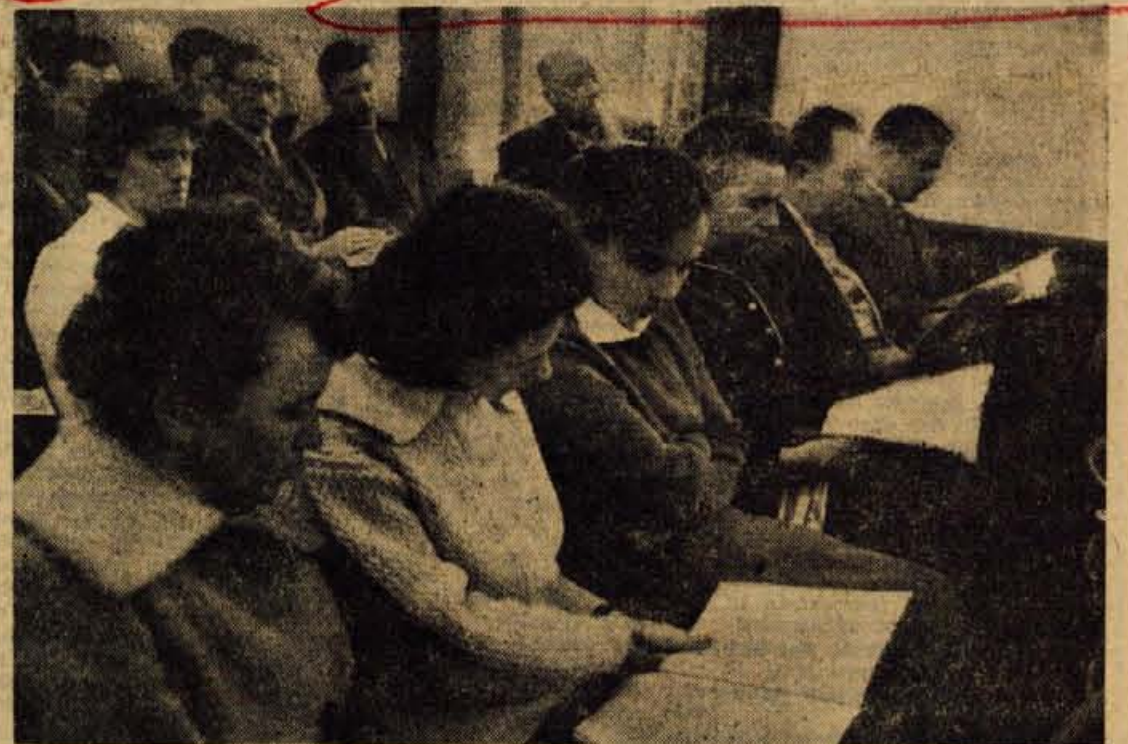
Z občnega zbora Občinskega sindikalnega sveta v Radovljici

Jutri bodo odprli spomladanski Gorenjski sejem.