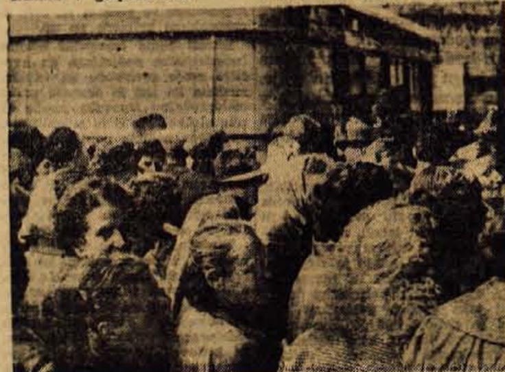
Pred dvomese TVD »Partizan« na Jesenicah je veliko število ljudi...