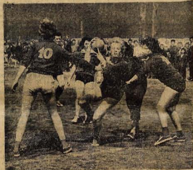
Z nedeljskega srečanja med Mladostjo in Rudarjem