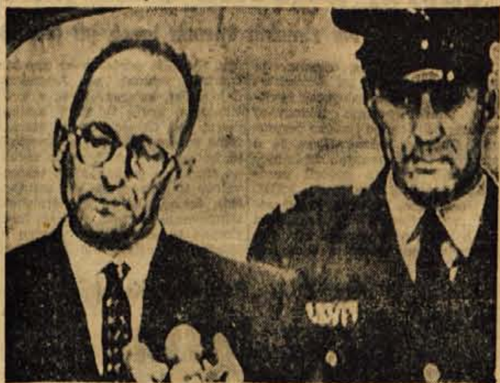
Včeraj je minilo teden dni, odkar se je v Jeruzalemu začel proces proti Eichmanu. Dogodki v zvezi s tem zanimajo skoraj ves svet. Številni ljudje pa potek procesa spremljajo tudi po televiziji, kar jim je omogočila ljubljanska RTV, ki je od nekega angleškega podjetja odkupila vse dokumentarne filmske posnetke iz sodne dvorane. Naša slika je posnetka s televizijskega ekrana, zato je morda tudi malo popačena. Vendar pa ne samo zaradi tega. Eichmann se zaogovarja v stekleni kabini, ki tudi delno popači sliko.