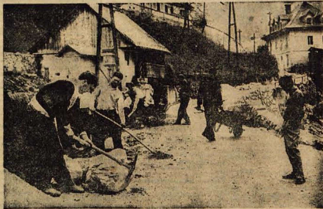
Proletarska cesta v Trzinu je bila že nekaj let kamen spoilke za promet. V zadnjem času pa so se ureditve te ceste lotili z največjo prizadevnostjo

Z ustanovitvijo gostinskega šolskega centra na Bledu smo tudi na Gorenjskem, sicer razmeroma zelo pozno, pridobili možnost, da problem kadra v gostinstvu v bližnji prihodnosti rešimo. Seveda pa ne smemo misliti, da bomo problem gostinstva rešili, če bomo uredili velike hotele; vsek, še tako majhen gostinski obrat, je po svoje pomemben in je tako prav lahko udeležen pri tem, da gost dobi o gorenjskem gostinstvu pozitivno ali pa porazno predstavilo.