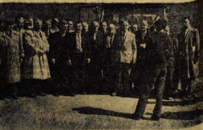
Udeleženci z obiska v Medjurečju

27. marca so se gostje iz Slovenije napotili v Medjurečje, kjer je bilo ob pričetku vojne taborišče za komuniste in antifašiste iz Slovenije, Bosne in Makedonije.