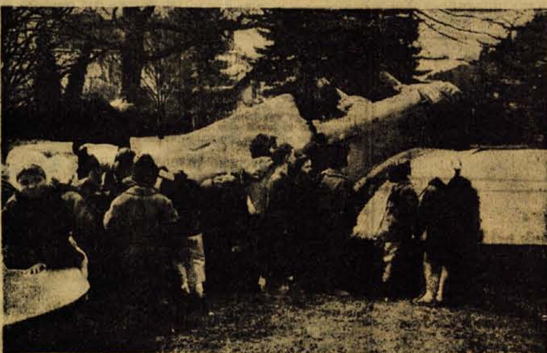
Otroški vrtec na Jesenicah je prelesen za vse, ki bi radi v njem dobrega varstva in vzgoje. Vendar se v njem vsak dan zbere okrog 160 malčkov, ki v okusnih, čeprav majhnih igralnicah, preživijo čas, ko so njihove matice na delu. Ko preneha mraz in posije toplo sonce, se preradi zberejo na velikem vrtu, kjer se lahko igrajo na gugalnici, vrtiljaku, na velikem drevesnem deblu, ki stoji sredi dvorišča lid. Na sliki pa vidite naše najmlajše Jeseničane prav v trenutku, ko so se zbrali na velikem letalu, ki ga je vrtec poklonilo družstvu Ljudske tehnike z Jesenic