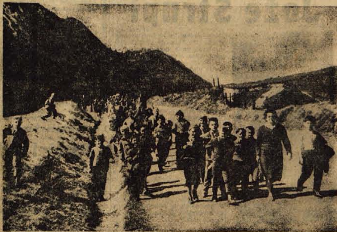
Cepprav je skopnel sneg, so športni dnevi za naše šolarje še vedno zabavni. Na sliki je skupina otrok s svojo razredničarko na izletu v Gornjesavski do lina, kjer je zmeraj lepo

sklada za šolstvo in o sredstvih, ki se stekajo v ta sklad. V ob-razložiti odloku o ustanovitvi družbenega sklada za šolstvo je bilo rečeno, da se ta ustanavlja zaradi zanesljivejšega dotoka denarnih sredstev, ki so potrebna za finansiranje šol. Tako se v občinski družbeni sklad za šolstvo prenesejo iz občinskega proračuna vse dotacije mlačnim kuhinjam, zavodu za prosvetno pedagoško službo ter dotacije 19 šolam in vrtcem. V celoti se iz proračuna ObLO prenese v sklad nad 161 milijonov dinarjev sredstev ali 27,5 odstotkov celotnega občinskega proračuna. V proračunu sveta za šolstvo pa še nadalje ostanejo sredstva za tečaje in seminarje, za učila in regres za vožnje ter sredstva za štipendije.