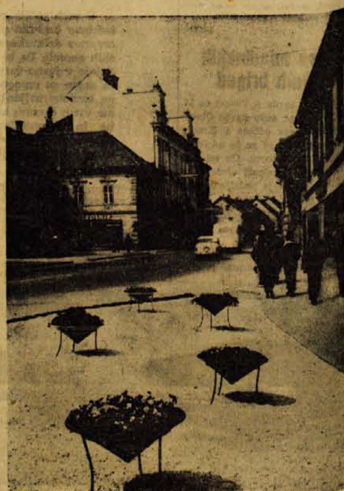
Turizem, pomlad, promet... Vse to narekuje posebnih oblik in včasih tudi domišljje o urejanju posameznih parkov, križišč in javnih prostorov. Na sliki tak poskus na cestnem križišču v Kranju pred Staro pošto

Letos bo zadruga morala posekati s svojimi delavci približno 3 do 4 tisoč kubičnih metrov lesa. Imajo ustajalne tri skupine delavcev, ki so jih sedaj opremili tudi z novimi motornimi žagami. Seveda bodo pri vsem tem delu sodelovali tudi kmetje, lastniki lesa.