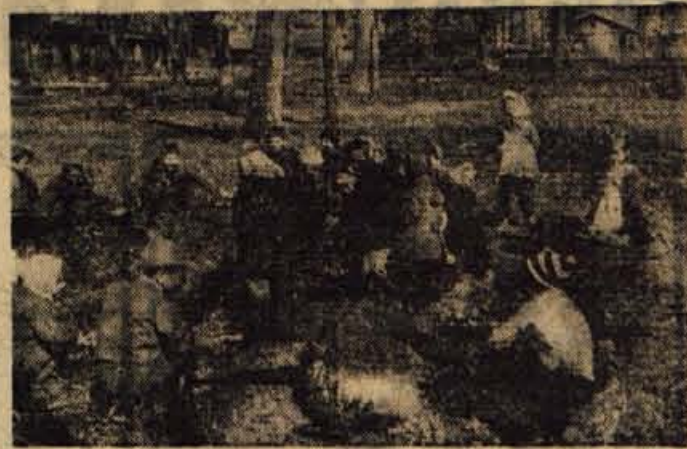
Ob lepem vremenu se igrajo otroci v bližnjem gozdičku

Na Trati pri škofjeloški železniški postaji rastejo novi bloki. V zadnjem bloku, ki je bil zgrajen pred dvema letoma imajo Dom igre in dela. Vsako jutro pešjeje v vrtec svoje malčke mamice, zapostene v Gorenjski predlinici ali v Jelovici in mirno, z zavestjo, da so otroci na varnem, odhajajo na delo. Tako se že v dopoldanskem času zbere v lepo opremljeni sobi kar lepo število otrok v starosti od drugega do petnajstega leta. Starejši otroci, ki hodijo v šolo in pridejo v vrtec k učnim uram, kjer jih nadzorujejo vzgojiteljice, pa pridno pomagajo mlajšim pri umivanju, oblačenju in se z njimi pridno igrajo. Tako se pod skrbnim vodstvom upravnice in dveh vzgojiteljic navajajo starejši otroci pomagati mlajšim. Dopoldne in popoldne je v vrtcu 62 otrok, in sicer 41 predšolskih in 21 šolskih. Ob lepem vremenu se skupno z vzgojiteljicami podajo v bližnji gozd, doma pa se motijo z igranjem, risanjem in izrezovanjem najrazličnejših stvari. Včasih prireajo razne prireditve, na katere povabijo tudi svoje starše. Radi bi imeli otroško igrišče z gugalnicami, vrtiljaki itd., pa upajo, da ga bodo na prostoru pred blokom, v kraikem postavili. Vendar število otrok tako hitro narašča, da je nujno treba misliti na nove prostore v samem Domu. Najboljša pa bi bila rešitev z gradnjo nove vzgojno-varstvene ustanove.