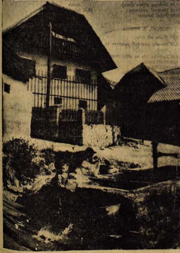
Motiv z Gorenjske

Strokovna komisija, ki bo ocenjevala ta nastop zabavnih ansamblov, bo predlagala najboljše od teh za nastop na republiški reviji, ki bo v drugi polovici meseca junija v Kopru.