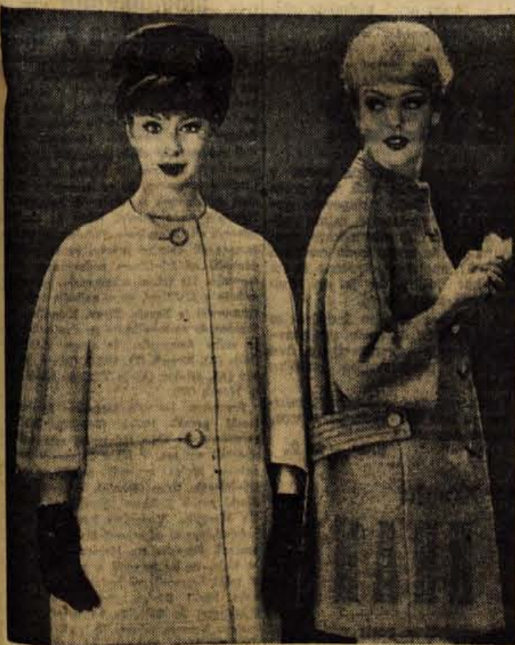
Ob predstavljanju letošnjih modnih časopisov, lahko vedno znova ugotavljamo, da je letošnja moda sila enostavna. Plašči so izredno pogoste brez ovratnikov, žepov in zavrhov na rokavih. - Sportni plašči imajo spei večkrat pošite robove, zalikane gube in pasove