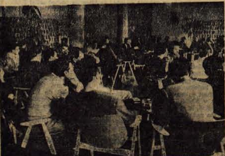
Z ustanovne skupščine Občinske športne zveze v Kranju

BITNJE — Danes ob 20. uri bodo mladinci iz Bitenj uprizorili v gasilskem domu »Težko uro«. Jutri ob 16. uri pa isto tam igra »Kam iz zadreg«.