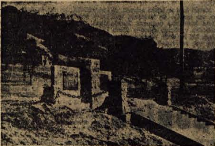
V okviru letošnje 20-letnice revolucije po vseh naših krajih pripravljajo primerno prireditve ožega ali širšega značaja. Večina teh praznov bo v počastitev velikih in odločilnih bojev, v spomin padlim žrtvam in podobno. Zato povsod urejajo, lepšajo in pripravljajo ustrezna obeležja na takih mestih. Na sliki: Grobišče padlih borcev in talcev v Dovjem, ki ga tudi preurejajo v okviru letošnjih praznov

Po osvoboditvi, ko so se delavci otresli izkoriščevalcev in postali v resnici kovači svoje usode, so s sproščenim delovnim zagonom začeli ustvarjati temelje za boljše življenje. Vse to je dobilo svojo obliko v delovnih brigadah po velikih gradbiščih, v številnih udarnikih v tovarnah in podobno.