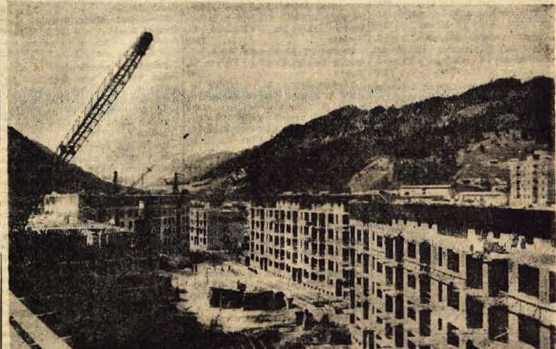
Zivahna gradnja na Plavžu obeta, da bodo na Jesenicah enkrat le ublažili hudo stanovanjsko stisko

Tarifnih postavk v BPT sploh nimajo, pač pa se tu določa delavcem osebni dohodek po točkah. Kolikor točk si po prizadevanosti delavec zasluži, toliko denarja dobi po vrednosti posamezne točke. Delavcem točke določajo tarifne komisije po ekonomskih enotah.