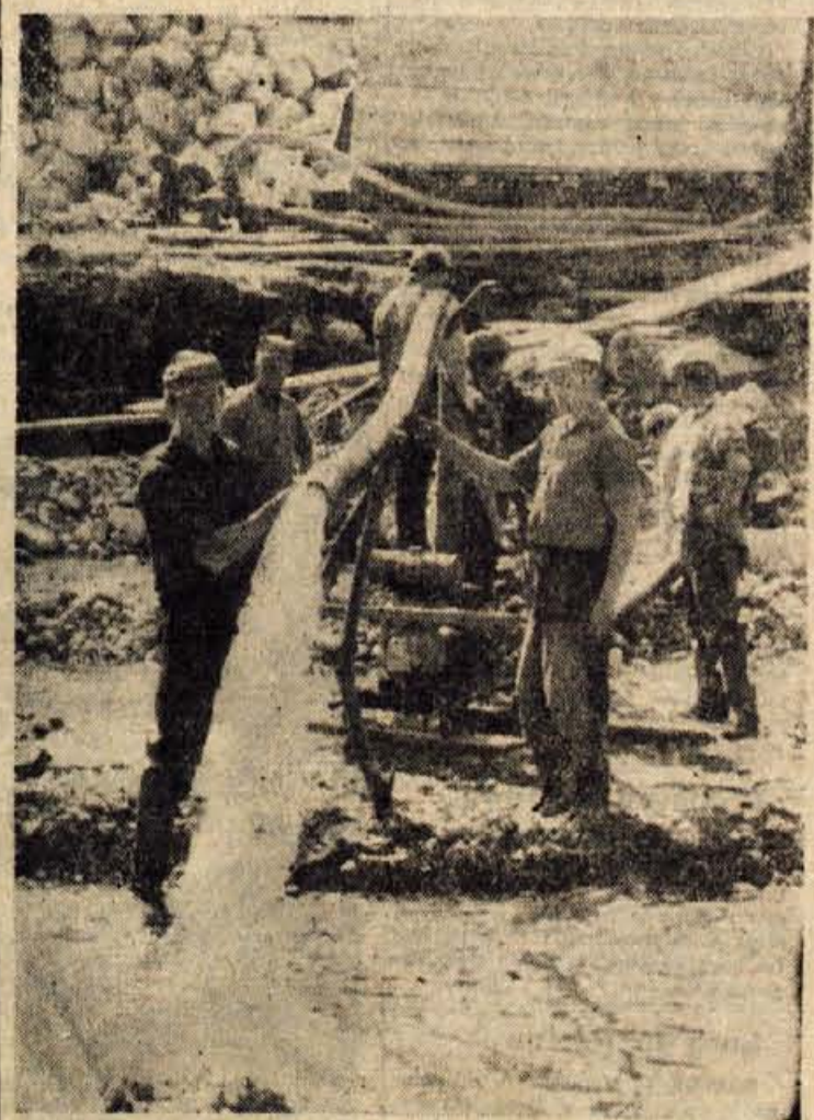
Podjetje za urejanje hišnih in pridne in požrivovalne delavce. Ti jezijo potok Ljubljanice pri Kropi in Gorenjskem. Naša slika jih prikazuje pri urejanju vode, ki jim je velika ovira pri delu

Kamnik - Za popis prebivalstva v kamniški občini bodo potrebovali 76 popisovalcev. Posebna komisija je že razdelila občino na popisne okoliše.