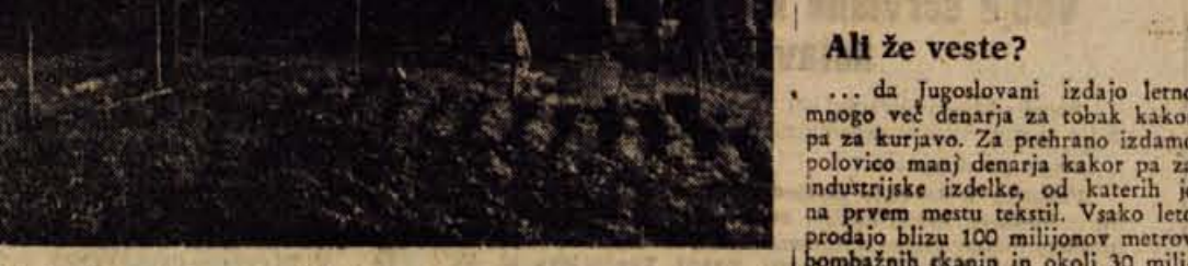
Zakosten je pogled na pogorišče...

Istočasno pa je začela nemška tajna služba, ki je morala najbrž prelistati marsikatero pikro, intenzivno loviti tuje agente. Dasiravno ni imel André, ko je enkrat spet uredil barako za pisarne, v Bois Carre pravzaprav nobene