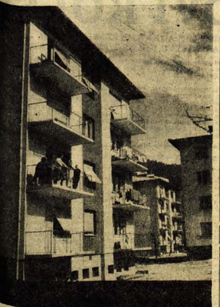
Na Jesenicah se je na Plavžu pred dnevi vselilo v nove stanovanjske bloke kar 52 družin