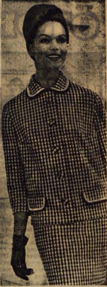
Letos kostimi skorajda nikoli ne bodo krojeni po klasičnem vzorcu. Priljubljene bodo ravne jopice, majhni ovratniki, še večkrat pa so jopice kar brez njih. V modnih časopisih so zelo pogosti modeli z oroblenimi robovi. S to zamisljivo si homo lahko pomagale tudi pri obnavljanju lanskega kompleta

Nizozemke so menda v Evropi prve pile čaj. Verovale so, da je čaj zdravilo za nekatere ženske bolezni.