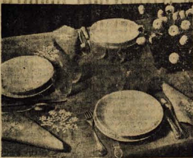
Ce je pomlad zunaj, naj bo še na naših mizah. Dočarali jo bodo lahko še majhni, enostavni šopki, izvezeni na platno lepe barve