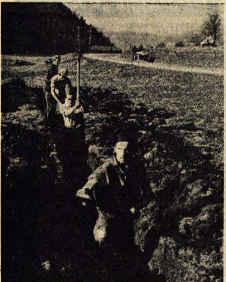
Tudi pri Poljanah nad Skofjo Loko, kot marsikje po naših krajih, kopijejo jarke za nov vodovod. Dobro plino vodo bodo zagotovili tamkajšnjemu kmetijskemu posestvu. Hbrati pa bodo dobili vodo tudi prebivalci v Dobjem in v okolici Poljan, kar bo pomenilo zanje velik dogodek.

Ljubno Krajevna organizacija ZB v Ljubnem pri Radovljici se je letos resno lotila dela. Za krajevni spomenik nameravajo odkriti spomenik padlim borcem. Temeljni zanj so postavljene že od leta 1955. Da bi zagotovili potrebna finančna sredstva, so člani ZB organizirali še več prostovoljnih delovnih akcij, sečnje lesa, kakor tudi prostovoljno nabiralno akcijo. Odkritje spomenika bo združeno s proslavo 20-letnice vstaje in Krajevnega praznika, ki ga bodo praznovali ves teden. Program praznovanja bodo dopolnile še razne druge organizacije. Turistično društvo Posavec pa bo organiziralo »Teden narodne noče«.