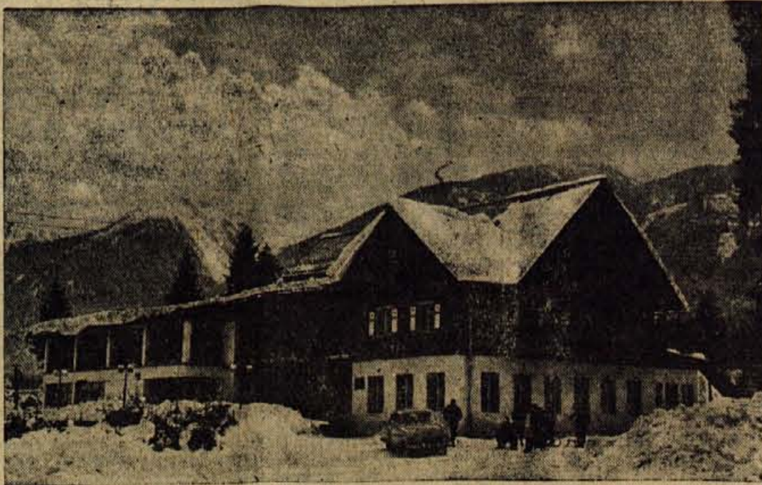
Freurejen hotel Jezero je vsekakor velika pridobitev za bohinjski turizem

Nestalno, z možnostjo večje ohlajditve in močnejših padavin.