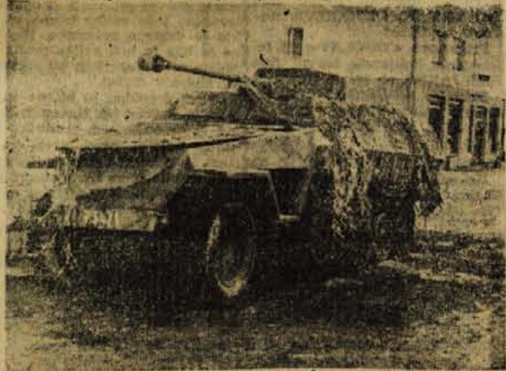
Prve kadre filma so snemali v Kropl, kjer pred kulturnim domom še vedno stoji oklopnjak z grozečim "hackenkreuzom". Toda režiser filma nam je povedal, da si s tem oklopnjakom niso mogli pomagati pri snemanju. Preveč star je že in kolesa se mu ne vrte

In sedaj k odgovoru na prejšnje vprašanje: "Vojni zakoni, sprejeti v Zenevi so zastareli. Treba jih je vskladiti s sodobnostjo. Vzeti življenje desetim talcem zaradi enega okupatorjevega vojaka, ni pravično. To so dokazali dogodki v drugi svetovni vojni. Tudi partizane so bili priznali kot vojske