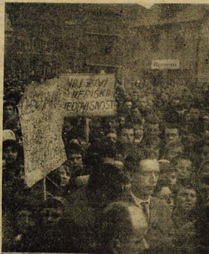
Vel ogorčenih protestov proti zločinskemu umoru kongoškega premiera je zajel tudi delavstvo središče Jesenice. Po vseh kolektivih so delavci ostro obsodili zapadne kolonialiste, ki hočejo zatreti težnje po svobodi in afriških narodih. Najbolj pa so jeseniški delavci izrazili svoj gnev do belgijskih in drugih kolonialistov na množičnem zborovanju, na katerem so, kot kaže slika, napolnili ulice mesta in sproščeno dali duška solidarnosti z bojem za neodvisnost Konga.

Take in podobne oblike dela je rodila že sama predkongresna dejavnost. Tudi člani pričakujejo od kongresa, da jim bo preko izvoljenih delegatov dal še nove spodbude in še konkretnije naznake nekaterih smernic v prihodnjem družbenem razvoju pri nas, kar je zlasti pomembno sedaj, na pragu novega perspektivnega načrta. K. M.