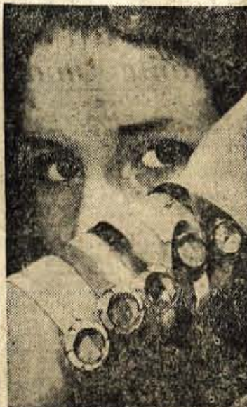
Neka švicarska tovarna ur je začela izdelovati ure, katerih oblika je s posebnimi dodatki prav lahko spreminljiva. Ta novost je pri kupcih našla velikega odziva, saj si tako namesto ene naenkrat kupijo kar 5 različnih oblik.

ji, ki jih oddaja z vseh teh oddajnikov še ne bo pokrila. Zato bo nujno za te kraje postaviti posebne oddajnike, ki bodo služili izključno samo krajevnim potrebam. Vendar postavitev teh krajevno-prenosnih oddajnikov ni vedno dolžnost področne organizacije za izvedbo televizijskega programa (v našem primeru RTV Ljubljana), temveč občin ali pa podjetij, ki so na tem zainteresirane. Omeniti moramo, da bi ta investicija ne predstavljala kdo ve kako velikega problema. Ti oddajniki stanje namreč nekaj nad milijon dinarjev in tudi postavitev letih je enostavna. Zato je vsekakor priporočljivo, da bi si kraji, ki jih televizijska slika ne doseže ali pa je vidljivost zelo pomanjkljiva, pomenili o tem načinu izboljšanja. Le s takim postopkom bo možno »pripeljati televizijske valove« tudi v površinsko neprimkladne kraje.