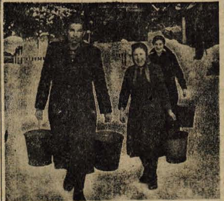
V Starf Fušini v Bohinju vaščan vsak dan že v zgodnjih jutranjih urah nosijo v golišah mleko v tankokajnuh sirarino, kjer izdelujejo masno bohiniško specializacijo - sir omentalec

Razumljivo je, da bo uresničitev tega plana zahtevala znatne napore delovnega kolektiva in velika investicijska vlaganja. Toda enkrat vendar moramo pričeti. To se ne nanaša izključno samo na Jelovico, temveč na vso našo lesno industrijo. Ta je bila do predzadnjih let samo industrijska stroka, od katere smo pričakovali samo koristi, za njeno nadaljnjo izgradnjo pa se nismo zadosti brigali.