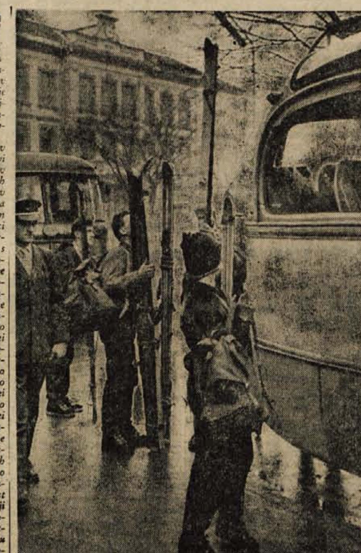
Danes in jutri bodo krvava smučišča še bolj živa kot so že sicer. To pa je razumljivo, saj se bodo na njih srečali najboljši mladi smučarji za nastove republiških prvakov. Na sliki: pred odhodom

Ceprav je bil dnevni red za torkovo sejo ObLO Jesenice precej obširen, je bila seja pred končano kot običajno. Odborniki so namreč v glavnem poslušali poročila o izpolnitvi družbenega načrta za preteklo leto, poročila o izpolnitvi proračuna in stanju skladov, o prioritetah bodočih investicijskih vlaganj in nekaterih drugih vprašanjih. Pred prehodom na predvideni dnevni red so razpravljali še o razmerah, oziroma točneje povedano o tem, ali naj gre izvozno podjetje „Ribnik“ v likvidacijo ali ne. Zaradi občutne konkurence sosednjih podjetij v državi, je „Ribnik“ v težavah. Ko je bilo to podjetje ustanovljeno, ni bilo nobenega podobnega podjetja pri nas, zato je imelo podjetje dovolj ve-