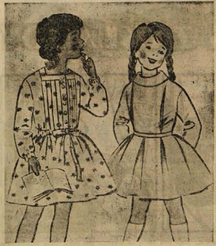
Nekaj za mlajše: dva priklupna in praktična modela za zimski čas

V slani vodi skuhajte ohrovtove glavice, ki ste jih predhodno zrezali na štiri dele. Odmehčan ohrovt ohladite in dobro odkapajte, ga nato z dlanmi iztisnite in oblikujte polpete. Vsako posebej povaljajte v moki, jajcu in drobtinah ter na masti ocvrite, postrezite s krom-