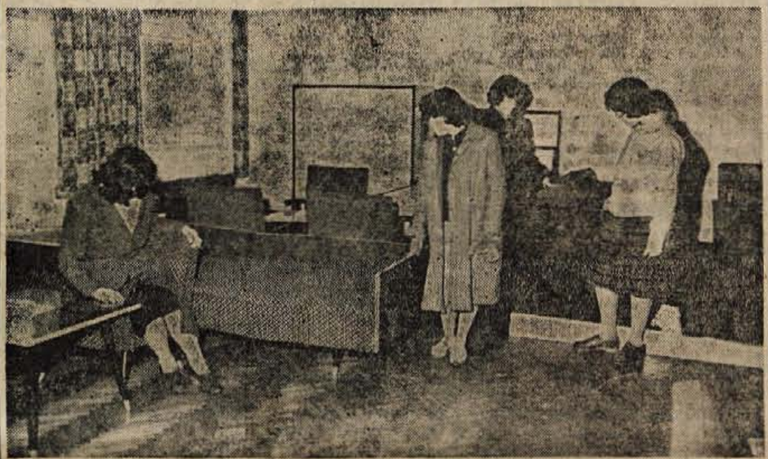
Za razstavo pohištva je v Kranju voliko zanimanje

Jesenice - S prvim januarjem so na Jesenicah preskrbo z mlekom in mlečnimi izdelki prevzele Ljubljanske mlekarne. Tako so mlekarne kakor tudi mlečna restavracija preskrbljene z vsemi potrebnimi mlečnimi izdelki, ki jih je prej primanjkovalo. Ljubljanske mlekarne so s to pogodbo prevzele v upravljanje tudi vse mlekarne in zaposlene osebe.