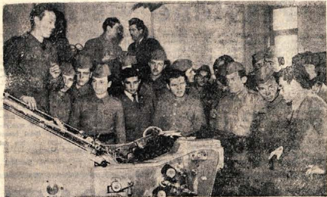
Vojaki kranjskega garnizona ogledujejo delo v Gorenjski tiskarni

GLASILO SOCIALISTIČNE ZVEZE DELOVNEGA LJUDSTVA ZA GORENJSKO