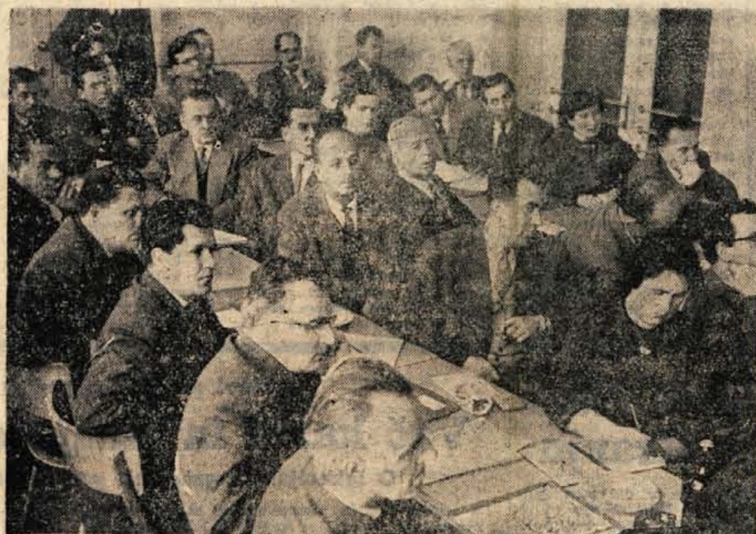
KRANJ, 10. decembra — Večraj dopoldne je bilo tu širše posvetovanje, ki so se ga udeležili predstavniki gospodarskih organizacij in družbene politični delavci iz vsega okraja. Na posvetovanju so govorili o nagrajevanju in delitvi dohodka v gospodarskih organizacijah, o čemer bomo še poročali v eni izmed prihodnjih številk