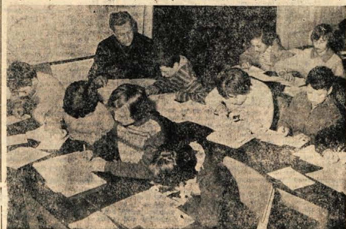
Kranj, 10. decembra — Nedelja je, toda kljub temu so se danes zbrali nekateri učenci v osnovni šoli na Primskovem. Tokrat ne bodo reševali nalog ali ponavljali zgodovino. Danes so sedli za mize zato, da bi svojim sovratnikom preverili znanje o prometnih predpilih. Učenci osnovnih šol v kranjski občini so namreč na posebnih listih napisali, kaj pomenijo posamezni prometni znaki. Tako se je nabralo kar precejšen kup lističev, katere je treba pregledati. To pa bodo danes ob širokovni pomoči storili učenci, ki že dobro poznajo prometne predpise in znake

KORISTEN RAZGOVOR SPORTNIH DELAVCEV Kranj, 10. decembra — Sinoč je Občinska zveza za telesno kulturo in Svet za šport in telesno vzgojo pri ObčL O Kranj priredil sprejem za športne delavce kranjske občine v Klubu gospodarstvenikov v Kranju. Na tem sprejemu so se predstavniki posameznih društev skupno z zastopniki sklicatelj tega sestanka pogovorili o problemih telesne kulture v kranjski občini, hkrati pa so posamezniki iznesli svoje težave v društvih.