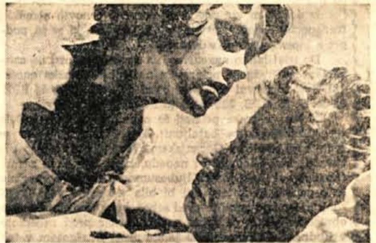
V Kranju bomo videli film sovjetskega režiserja Grigorija Cuhaja, ki ga pri nas poznamo po njegovih odličnih filmih Enainštirideset in Balada o vojaku. Film "Čisto nebo", ki je posnet v barvah, je dobil prvo nagrado na letošnjem filmskem festivalu v Moskvi.