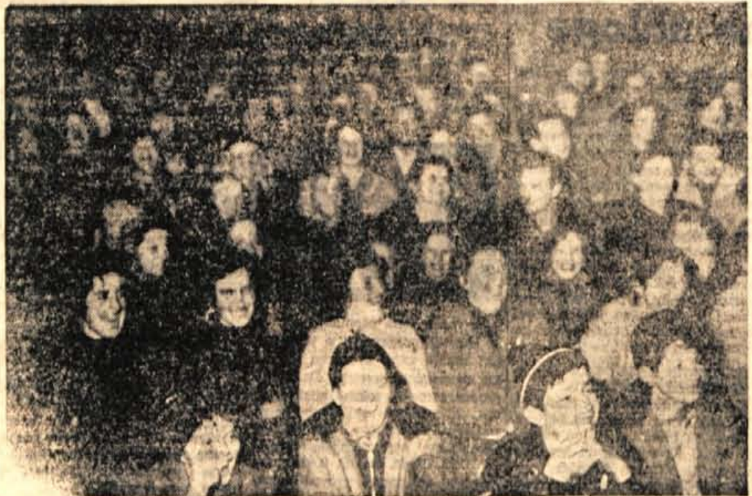
CESNJICA pri Bohinju, 10. decembra — Sinoči je bil v tukajšnji dvorani v Gasilskem domu »Novinarski večer«, ki ga je pripravilo naše uredništvo. Domačini so z zanimanjem spremljali pripovedovane novice novinarjev o dogajanju v njihovem okolisu in v svetu, prijeto pa so se razvedrili ob zvokih veselih godcev in smešnicah Lipeta Revšeta

V četrtfinale so se plasirale naslednje ekipe: Voglje I, Visoko I, Zabrnica, Besnica, Cerklje III, Trboje, Cerklje II, Voglje II. Tekmovanje je postalo zelo ogorčeno, posebno v politfinau, kjer so bili dosegeni naslednji rezultati: Visoko : Zabrnica 5:2, Trboje : Cerklje II 5:1. Finale: Visoko : Trboje 5:3. — R. J.