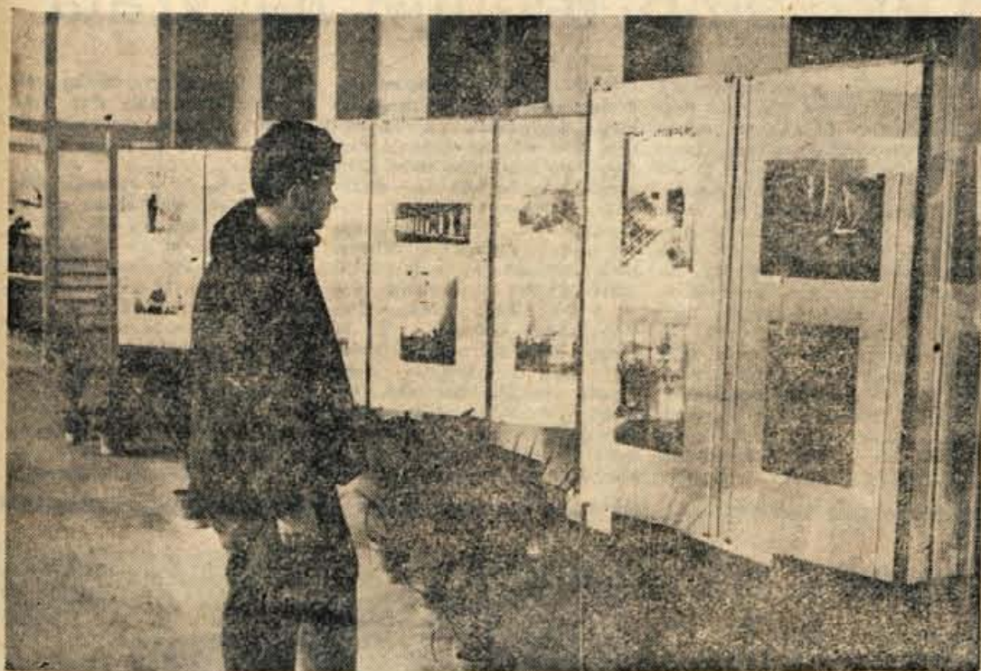
V Kranju je že nekaj dni odprta VII. republiška razstava umetniške fotografije, ki privablja številne gledalce

GLASILO SOCIALISTIČNE ZVEZE DELOVNEGA LJUDSTVA ZA GORENJSKO