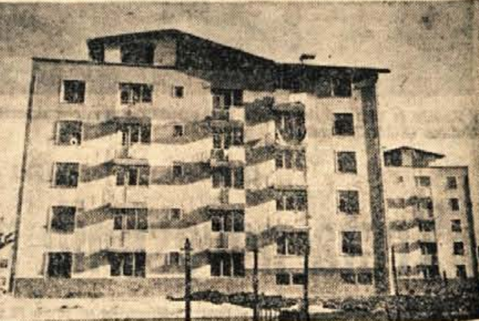
V zadnjem času so v Radovljici dogradili dva stanovanjska bloka. V prvem so se stanovalci že vselili, drugi pa bo pripravljen v tem mesecu

Pred časom smo pisali, da se v Cerkljah kar ne morejo posloviti od starega načina obveščanja prebivalcev ob nedeljah pred cerkvijo. To je veljalo tudi za nekatere druge okoliške kraje. V Cerkljah so menda s to prakso prekinili, odborniki v Zalogu pa so drugačnega mnenja. Pravijo, da je takšno razglašanje pred cerkvijo najbolj učinkovito. Kar ne morejo se otresti patine preteklih časov. Morda bi pa le poskusili z razglasnimi deskami. Sčasoma se bodo ljudje navadili tudi te nove oblike obveščanja. Seveda pa bo treba poskrbeti, da bo dovolj razglasnih desk. Trenutno so v 28 vaseh le 4 take deske. - S. S.