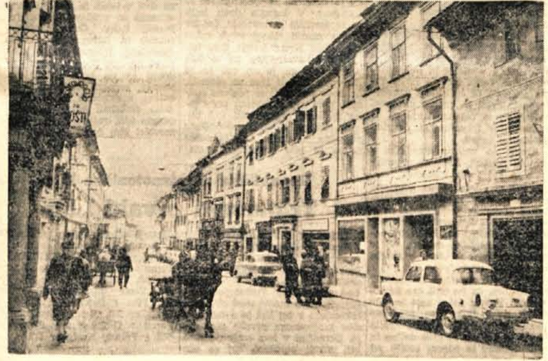
Parkirni prostori so v motoriziranem in prometnem Tržiču že dlje precej pereč problem. Celo v času, ko je na Ljubelju zatišje, je glavna ulica skozi Tržič preozka in večkrat za promet velik kamen spotike. Prav zaradi tega bi bilo treba že zdaj misliti na kakšno bolj primerno ureditev parkirnih prostorov, da ne bi tržiškega prometa povsem prehitela prihodnja turistična sezona. Odlašanje zaradi gradnje nove ceste na Ljubelj pa je neupravičeno. Nova cesta bo, če ne bo nepredvidenih ovir šele leta 1965 — B. F.

Ureditev kluba je veljala 500 tisoč dinarjev. Po 100 tisoč dinarjev sta prispevala Stanovanjska skupnost in ObO SZDL, 50 tisoč dinarjev je dal Krajevni odbor SZDL, 20 tisoč dinarjev pa organizacija ZB. Ostalo so zbrali prebivalci sami. Če pa bodo znali klub tudi koristno uporabiti, je odvisno od njih samih. — S. S.