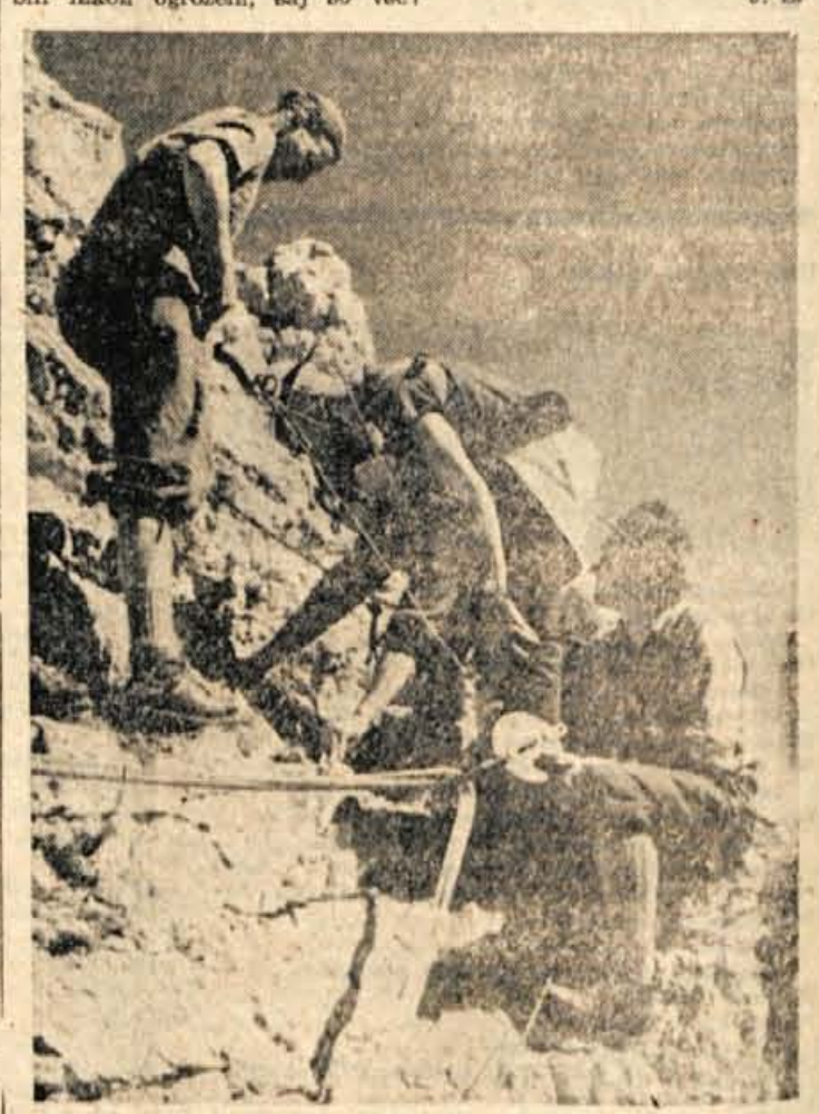
Gorski reševalci med akcijo

TRIGLAV : FUZINAR 9:0 Kranj, 3. decembra — V današnjem kolu republiške namiznoteniške lige so si igralci kranjskega Triglava z najvišjo zmago nad ravenskim Fužinarjem zagotovili prvo mesto med ekipami, tekmujejo v tej ligi in s tem naslov moštvenega prvaka Slovenije. Domačini v tem srečanju niso bili nikoli ogroženi, saj so vse