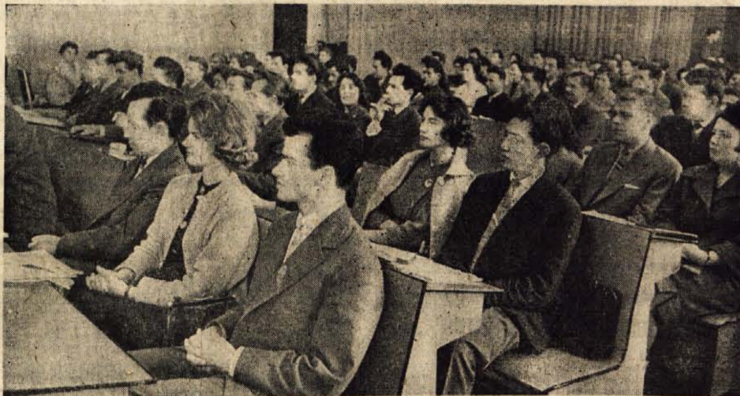
Približno 300 delegatov in gostov je v soboto in včeraj sodelovalo na konferenci mladine krajskega okraja

Občinski odbor bo te utemelje- ne potrebe določenih krajev sku- šal vskladiti z razpoložljivimi sredstvi, ozir. možnostmi. -I. c.