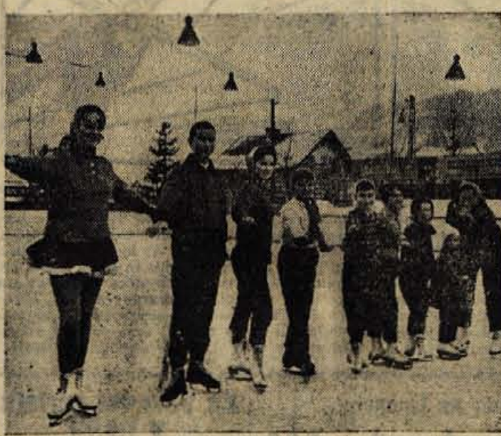
Na Jesenicah je še dlje vse večje zanimanje tudi za umotno drsanje. Na sliki skupina mladih, ki oblekuje drsalno šolo

jo obiskovalcev tovrstnih prireditelj. To nam potrjujejo že dogodki po zadnji tekmi med »Ljubljano« in beograjskim »Partizanom«, ko so nekateri vročekrvni hoteli fi-