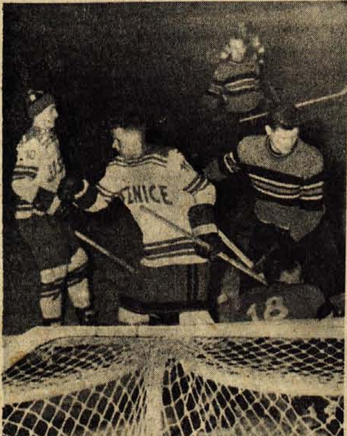
V soboto zvečer so si Jeseničani dokončno priborili naslov državnega prvaka, ko so v Ljubljani odpravili domačine kar z 12:2 - Poročilo o tekme berite na 4. strani

Zadnji dogodek preživele prakse stanovanjskega urada