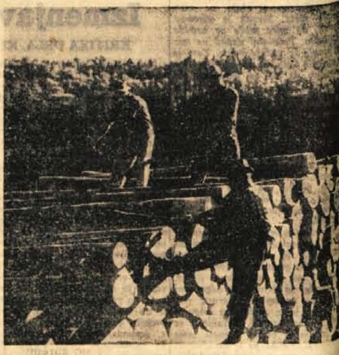
Na žagi v Cestnici v Bohinju imajo letos zaradi pospravljanja golemov na Poljkuki vedno velike skladišnice hlodov...