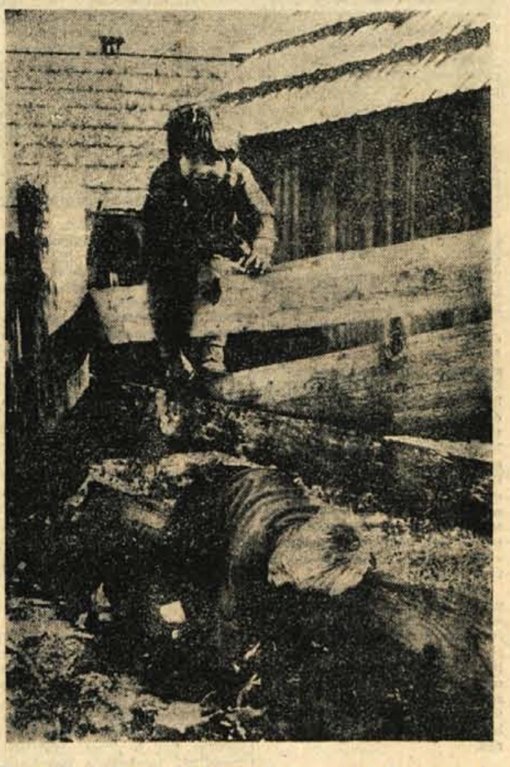
Kam neki sta se napotila naša maha prijatelja? - Prav gotovo k sosedomi mami po jabolka

vžgati, da so tudi taborniki tako pekli krompir, da je to tako lepo, da bo krompir dober, da... Oče sploh ni tega poslušal. "To je samo potraga! Nič ne bo nobenemu zaleglo! Zvečer boste prav tako hoteli jesti. Proč! Je škoda krompirja!" je vplj osorno, planil med otroke in s čevlji razbrckal žerjavico. Otroci so se razbežali. Na pol pečeni krompirji so ostali razmetani naokrog in otroci so se jokali. Kako lep bi jim bil tisti popoldne ob žerjavici in kako dober bi bil krompir! Niso in niso mogli razumeti, da je krompirja tako škoda. A to niso mogli razumeti niti sosede, ki so tisto popoldne videli takšen grob odnos in nerazumevanje očeta do igre in veselja lastnih otrok. K. M.