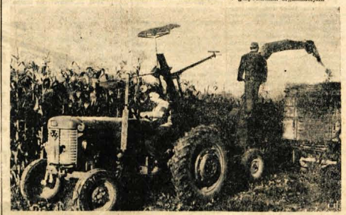
Radovljica (M. S.) - Kmetjsko posestvo Poljče za žetev silazne koruze že nekaj let uporablja silokombajn, ki koruzo požanje, obenem pa jo tudi zreže in tako pripravi za siliranje. Zmogljivost silokombajna je zelo velika, saj lahko v enem dnevu pripravi skoraj 100 ton silazice. Letos so pri kmetijskem posestvu v Poljčah s to krmo posejali okoli 30 hektarov zemljišča.