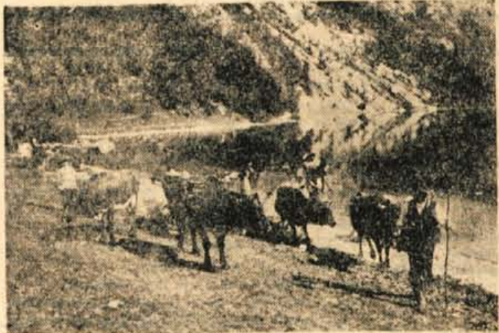
Na poti s planine do prireditvenega prostora so planšarji s svojimi tropi šli nekaj časa tudi po obali jezera, kjer se je živina odjezala.