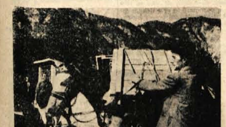
V ospredju slike vidimo delavca in obovornjenega konja, ki se vsak dan odpravita na tri ure hoda dolgo po na Vogel in skrbita za to, da imajo delavci na vrhu potreben gradbeni material. Gradnja tovar- ne žilnice na Vogel investira škofjeloško podjetje Transurist.

Radovljisko Turistično društvo se bo v kratkem uvrstilo tudi med peščico tistih jugoslovanskih tu- rističnih društev, ki so za boljše propagando svojih krajev izdala barvne diapozitive. Društvo je pri- pravilo 200 barvnih posnetkov, z katerimi nameravajo vzbuditi za- zanimanje za Radovljico predvsem med turisti iz ostalih jugoslovanskih republik.