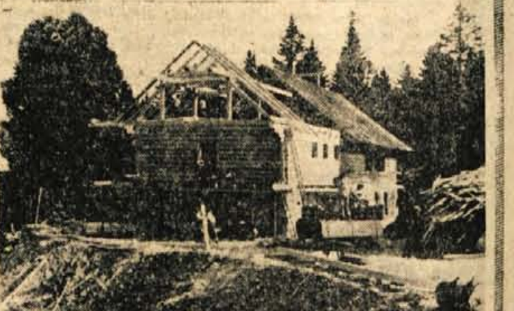
Adaptacija Partizanskega doma na Vodiški planini

Tako je v glavnem povedal tovariš Bortoncej, ki se zelo zavzema za zdravljenje bivših borcev in skrbi za ureditev prvega takega objekta v našem okraju. K. Makuc