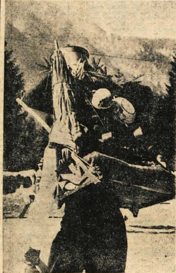
Krošnja z vsem, kar majer potrebuje v planini pod strmimi triglavskeimi vrhovi

planinskih kočah, ki imajo tri prostore: vežo, v kateri je ognjišče, omara za hrano in miza s stoli, desno je čevder za mleko, levo pa »hišca«, kjer so postelje in peč. V planinah Blato in Dedno polje pa imajo lesene staje, v katerih je spodaj živina, zgoraj pa so prostori za planšarje. Planinske kočje v