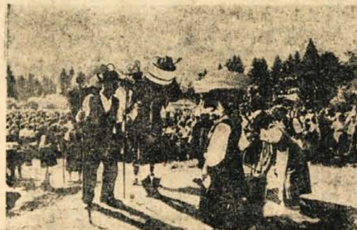
Majerji in majerice v popolni planšarski opremini in v bohinijskih narodnih nošah

Je za oboje v Bohinju dovolj prostora, ker se ne bosta niti živina niti turizem razvila v taki meri, da bi ogrozila drug drugega. Naši živini, ko postane v dolinah sopeno in vroče, ne moremo sleči kosmate kože, pa še začne nam bezljati pred obadi, zato se z njo pomaknemo v visoke planine, kjer je hladno in kjer je mlada paša. Razumljivo je, da se tukaj umaknemo, ko začne naraščati turizem, ker je to tudi za našo živino prav, povzemo se pa v jeseni zaradi mraza in slabega vremena, ko je turizem že v zadnjih vzdihljajih. Bohinj je v poletnem in tudi v zimskem času zelo lep in dober