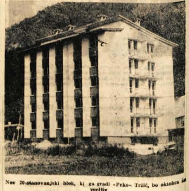
Nov 20-stanovanjski blok, ki ga gradi »Peko« Tržič, bo oktobra 60 vveljiv

Tržič, (B. F.) — Danes zjutraj se je tu sestala komisija za kadrovska vprašanja pri ObO SZDL. Razpravljali so o kandidatih za večerno politično šolo.