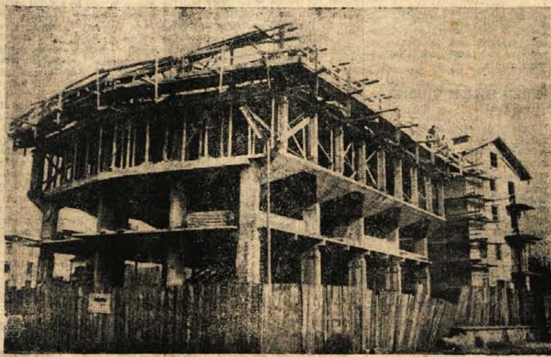
Novo poslopje Narodne banke v Kranju med gradnjo