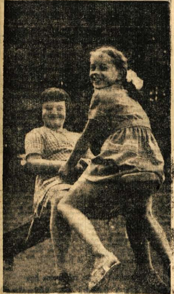
Veseli deklici na gugalnicah

(M. S.) — Ne dolgo tega smo se peljali z avtom iz Radovljice proti Kranju in opazili ob gozdni cesti v Podbrezjah vojo skupino otrok, ki so se veselo igrali. Največ jih je bilo okoli gugalnic, nekateri pa so se lovili ali drugče zabavali. Ker o igrišču v Podbrezjah še nismo pisali, smo se namenili, da to storimo ob tej priložnosti.