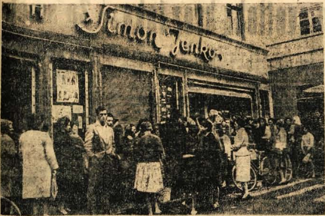
Kača na vsegodaj pred kranjsko knjižarno. Sola se je začela