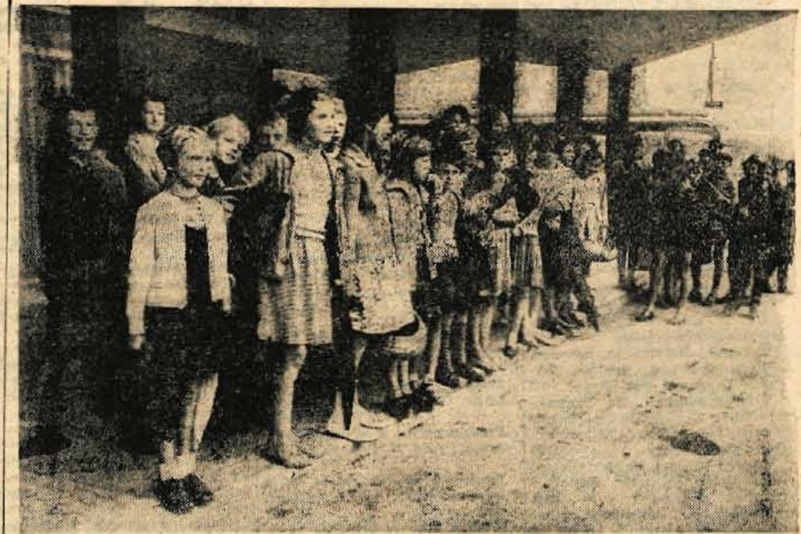
Otroci v Lancovem so ostali brez učitelja, zato se vozijo v šolo v Radovljico. Na sliki: na radovljiški avtobusni postaji