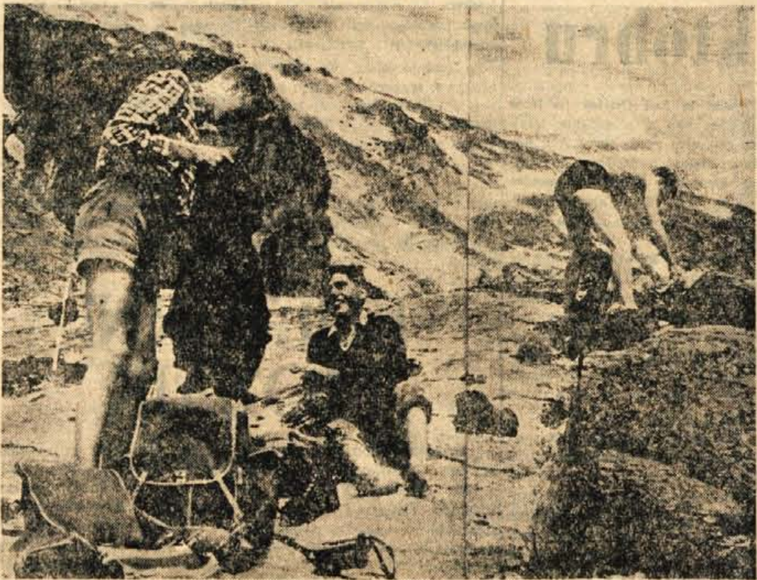
Pasneti film je razkril vzroke n esreče v skalah Grossglocknera. Pet nemških planincev doma iz Essena je zgubilo življenje zaradi preveč dolgega zadrževanja na soncu. Pozneje jih je mogla in snežni vihar zatekel v steni. Ko je prišla reševalna skupina do njih so našli samo še 5 trupel. Čeprav so bili dobro opremljeni in izkušeni alpinisti niso zdržali nuri v skali 3800 m visokega Grossglocknerja, najvišjega vrha v avstrijskih Alpah