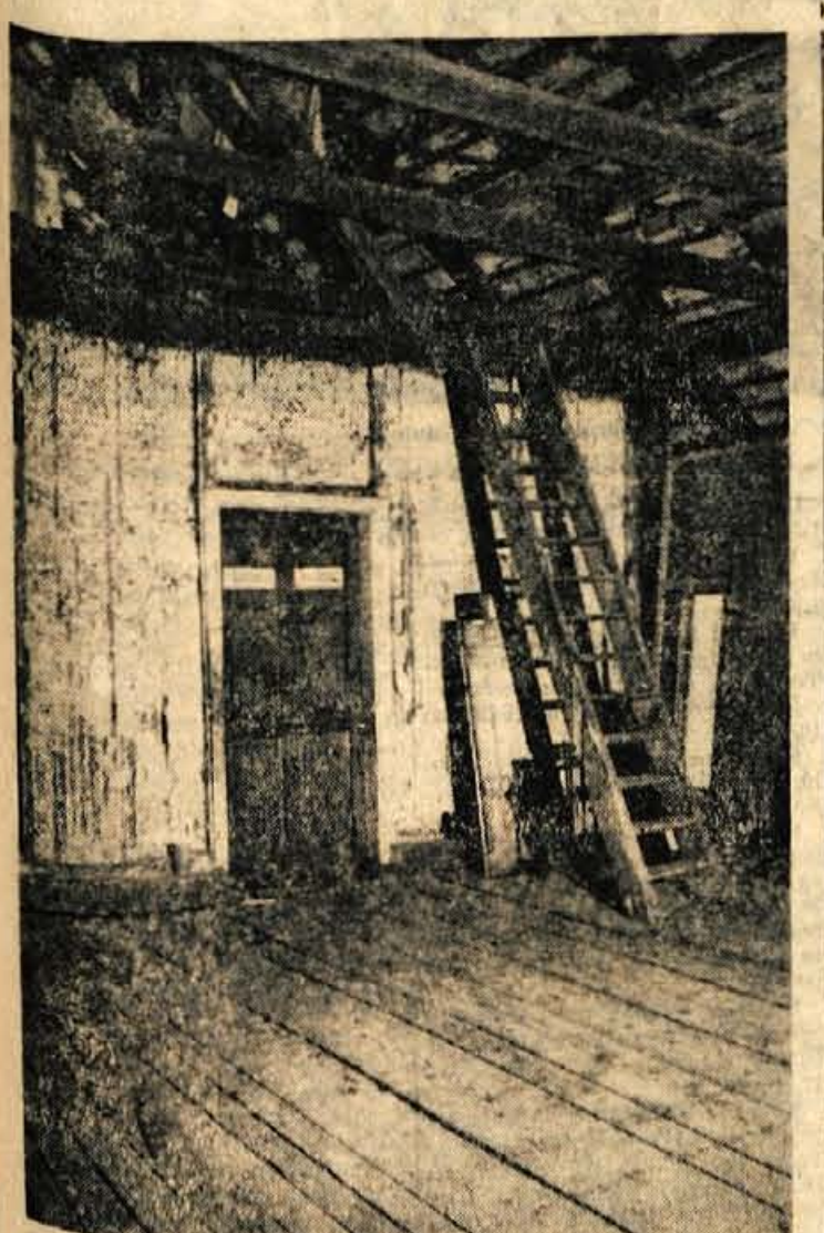
Vhod v 1.a in 1.b razred osmiletice v Gorjah

Izvoz v juniju je presegel dve milijardi. V juliju je izvoz iz Slovenije znašal 2168,3 milijona din; celotni 7-mesečni izvoz pa je 13.233 milijonov din, ali 11% več kot lani v tem razdobju. Pregled izvoza nam polkaže, da so je še nadalje povečal izvoz industrijskih proizvodov, ki je dosegel 1697 milijonov din, nekoliko manj pa kmetijskih pridelkov in gozdarstva.