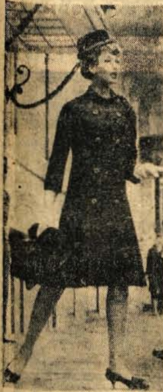
Jesenski plašč se prav posebno podrežajo novi modni zahtevi

In nakit? Nekaj nizov živobarvnih ogrlic, skromna broška in zapetnica, bi bilo vse najpotrebnejše. Pozlačeni nakit, težke verige vaših mamic in starih mamic, naj vas ne mikajo, saj bi take bile podobne dekletcu, ki je za eno popoldne ukradko iz mamine skrinjice nakit, da bi se postavila pred prijateljicami, in ne razumnemu dvajsetletnemu dekletu, ki ve, kaj mu pristaja; ena največjih mikavnosti sta še vedno skromnost in enostavnost.