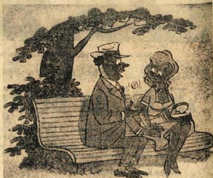
Prav ljubica, vrgla bova dinar. Grb pomeni prijateljstvo, ševilka pa zaroko

Neka ženska je prijavila v Pa- sadaeni (Kalifornija) nenavadnega vlomila. Ze večkrat je, tako je povedala, nepovabljeni nočni obis- kovalec epizelal skozi okno v njeno stanovanje. Proti pričako- vanju pa ni ničesar ukradel, am- pak vsakokrat vtaknil v njeno denarnico nekaj denarja. Denar - 49 dolarjev - je ženska izročila policiji.