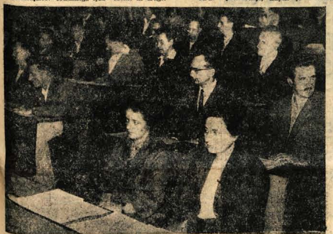
Z včerajšnje seje Občinskega ljudskega odbora v Kranju

Tako je zdaj sedel za mizo v sodobno opremljeni pisarni in pregledoval realizacijo plana za pretekli mesec. Pred uro je zadnjič