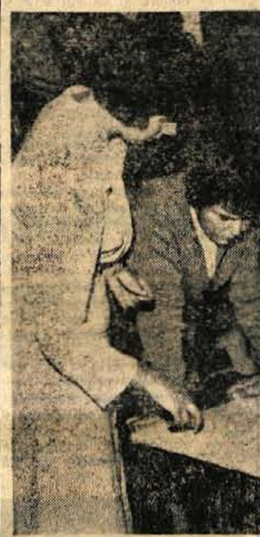
V Križah manjka učilnic, zato imajo prosvetni delavci precej dela pri sestavi urnika

Pravo šolsko poslopje bo čez tri leta staro 100 let. Ker ni podkleteno, udarja vlaga tudi v prvo nadstropje, v pritličje pa se je že naselila goba. V tem poslopiju so