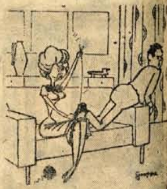
Ne zanima me kako je to delala tvoja mama.