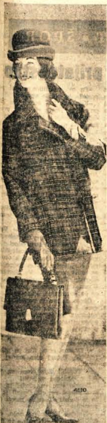
Za jopico in krilo na zgornji sliki ne bi mogli reči, da sta zadnji krik mode, ker smo take komplete že nosile. Pa zaradi tega ne bomo v takem oblačilu nič manj moderno obličene

Na obali mesta Lignano, blizu prostora za taborjenje se je pripetila huda tragedija. Ko je 400 otrok nekega italijanskega otroškega doma istočasno steklo v vodo, se je na nekem globokem mestu pričelo potapljanje okoli 30 deklic. Stevilni kopalci so bili priče neverjetni paniki italijanskih vzgojiteljev. Samo odločnemu posredovanju nekaterih turistov se mnogi otroci lahko zahvalijo za rešitev. Kljub temu pa so štiri potegnili iz vode že mrtve.