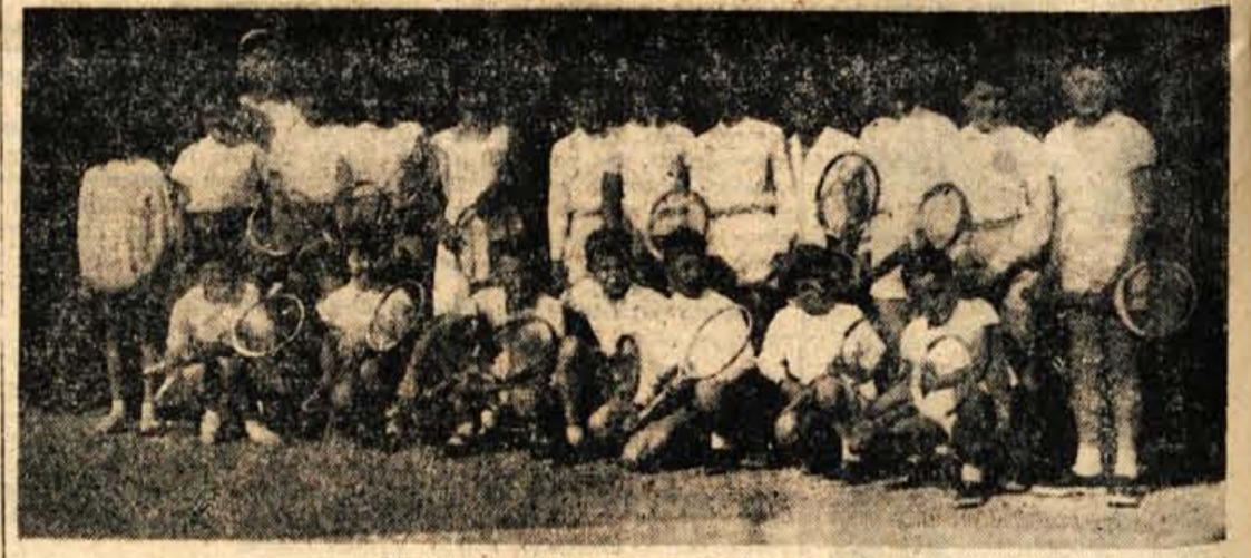
Mladi igralci tenisa kranjskega Triglava