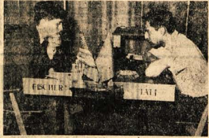
V ponedeljek je bilo največje zanimanje za njun dvoboj

(Kraljeva indijka) Partija iz I. kola blejskega mednarodnega veleturnirja 1. d4, Sf6, 2. e4, d5, 3. Sc3, Sbd7, 4. Sf3, g5, 5. e4, e5, 6. Le2, Lg7, 7. 0-0, 0-0, 8. Te1, c6, 9. Lf1, a5, 10. Td1, Te8, 11. d5, Sc5, 12. b3, ed, 13. cd, Ld7, 14. Sd2, Dc7, 15. a4, Tf8, 16. Sc4, Se8, 17. Le3, f5, 18. e7, g7, 19. Tcd, Sf6, 20. Sd6, Dd6, 21. Sb5, Lb5, 22. Lcd, Dd8, 23. Lb6, e4, 24. f3, Kh 8, 25. fe, S: e4, 26. T: e4, fe, 27. L: f3, D: f3, 28. d5, Td8, 29. d7, Df4, 30. Te4, Dc3+, 31. Khl, Lf6, 32. g3, Kg7, 33. Dg4+. Črni je prekorščil čas.