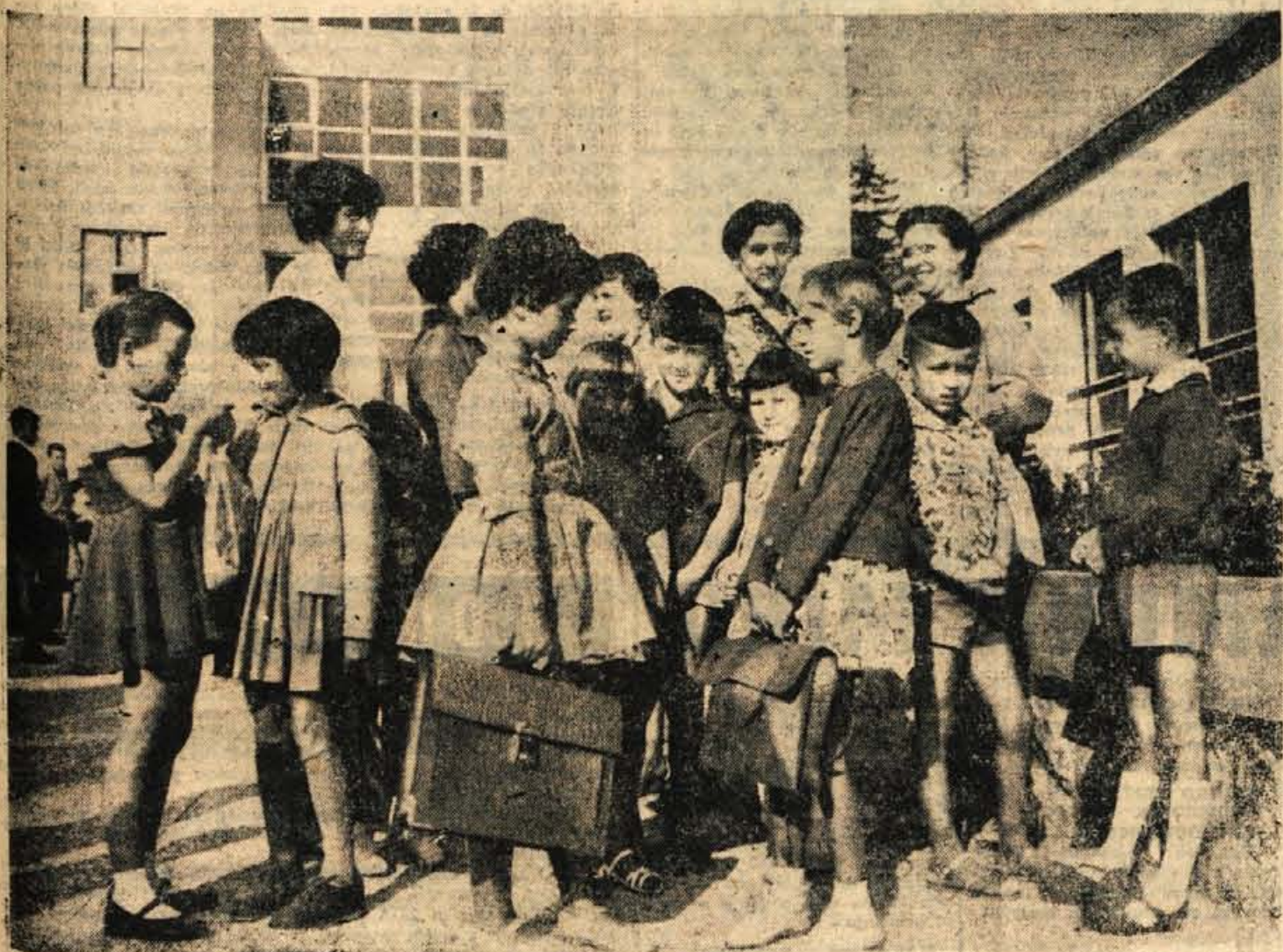
VČERAJ: PRVIC V SOLO

GLASILO SOCIALISTIČNE ZVEZE DELOVNEGA LJUBSTVA ZA GORENJSKO