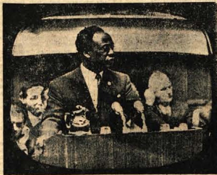
Predsednik Gane Nkrumah med govorom na beograjski konferenci

Tako kot po vsej Sloveniji, tako je tudi na Jesenicah veliko zanimanje za potek konference voditeljev neblokovskih držav v Beogradu. V ponedeljek, 4. sept. ob 13.30 uri, so se pred glavnim vhodom v železarno, v javni dvorani valjarnih in v predelovalnih obratih, zbrali jeseniški železarji k zborovanju. Predstavniki tovarniškega sindikata so ob tem priložnosti govorili o vlogi in pomenu nevezanih držav v boju za ohranitev miru na svetu in o pomembnosti mednarodnega sodelovanja. Brozjavko, naslovljeno na predsednika konference, ki so jo prebrali člani družbenega upravljanja v podjetju, so jeseniški železarji sprejeli z viharnimi aplavzi. Ostalim delovnim kolektivom, organizaciji Socialistične zveze, raznim družbenim in mladinskim organizacijam, ki ce na zborovanjih, predavanjih in sešanih seznanjajo s potekom beograjske konference, se je tako pridružil še 7000 jeseniških železarjev.