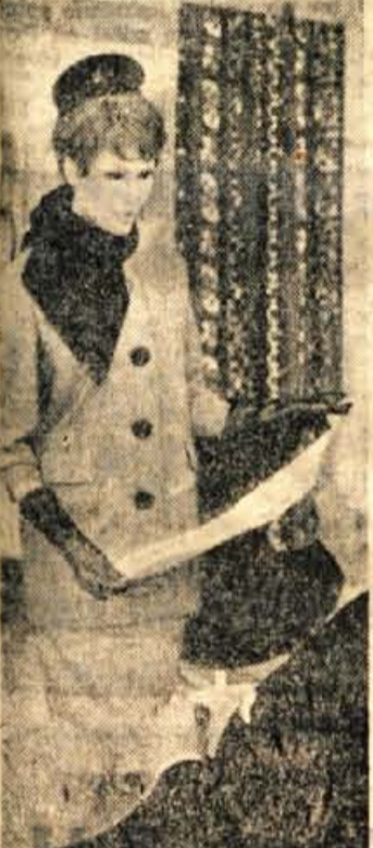
Tale komplet je pa seveda le za posebne priliko