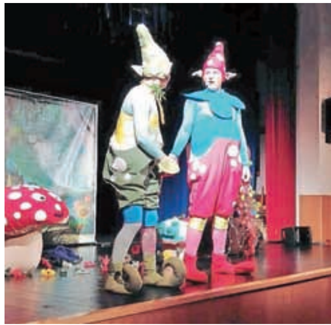
Igra Malina, v izvedbi gledališča Ku-kuc, najmlajšim sporoča, naj si nikar ne želijo čim prej odrasti in naj ubogajo starejše, ko jim ti kaj prepovejo.

LAS je v novembru pripravil več predavanj na temo interneta, njegove varne uporabe in tudi problemov, ki se pojavljajo v zvezi z njim in mladostniki – kot je na primer nadlegovanje. Organizirali so tudi nekaj delavnic na temo samopodobe, saj otrok, ki sam sebe spoštuje, to lažje zahteva tudi od okolice. Najmlajšim pa je bilo namenjeno spoznavanje s terapevtskimi psi