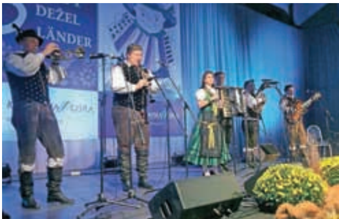
Slovenski zvoki