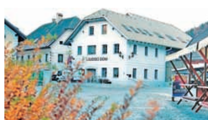
Novi Ljudski dom v centru Kranjske Gore

V objektu je večnamenska dvorana z odrom, v kateri je 108 sedežev v parterju in 48 sedežev na balkonu, prostori glasbene šole, prostori posameznih društev in manjša večnamenska dvorana. Prihodnji mesec bo prva abonmajnska predstava, opera Sneguljčica za otroke pa bo že decembra.