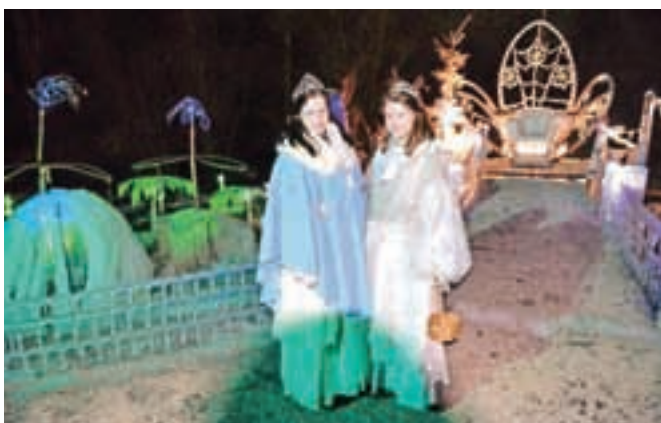
Jaslice v ledu lani