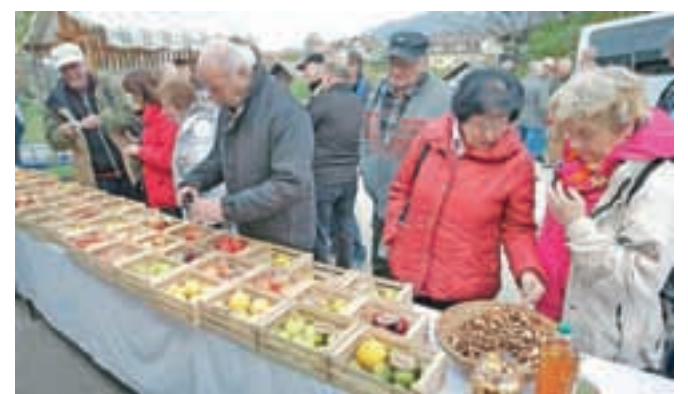
Plodove tunjskih sadjarjev so si z zanimanjem ogledali tudi občani Kranjske Gore.

Tunjice, ki pri nas slovijo kot eni tistih, ki si najbolj prizadevajo za ohranitev starih sadnih sort. Na Sadem dnevu so pripravili razstavo različnih sadnih plovov, povedali marsikaj zanimivega o zgodovini in pomenu sadjarstva ter zbranimi podelili vrsto nasvetov za vzgojo in nego sadnega drevja. Predvsem pa so ta dan slavnostno zaključili dva projekta Sadni mozaik in DynAlp Natura, v sklopu katerega so s pomočjo evropskega in občinskega denarja pravi »muzej« starih sadnih sort. Na hektaru in pol veliki površini so