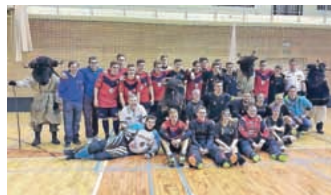
Tekmo je popestril tudi obisk parkeljnov.

Jesenski čas je prinesel nove obračune v državnem prvenstvu v floorballu. Člani in članice Športnega društva Zelenci Kranjska Gora zmagujejo skoraj tekmo za tekmo. V vseh selekcijah namreč dokazujejo, da se s trdim delom da veliko doseči. Z drugega turnirja U9 v Žireh so se vrnili z dvema zmagama in enim porazom. Ekipo InSport so premagali 15 : 2, Žiri pa 8 : 5. Boljši od zgornjesavske ekipe so bili le igralci Borovnice 10 : 6. Zmaga in poraz pa je bil izkupiček igralcev v kategoriji U13; InSport : Zelenci 12 : 2 ter Polanska banda : Zelenci 4 : 5. Domača trdnjava, Dvorana Vitranc v Kranjski Gori, pa za zdaj ostaja neporažena. Zelenci so v kategoriji U19 nadigrali Borovnico 7 : 4. Tekmo je popestril tudi obisk parkeljnov. Pa še to: letos imajo Zelenci tudi žensko ekipo, ki ni od muh. Članice so v državnem prvenstvu v floorballu že prišle do prve zmage. S 7 : 5 so nadigrale ekipo Borovnice.