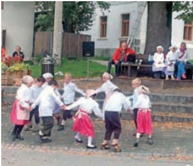
Pripravili so tudi bogat kulturni program.