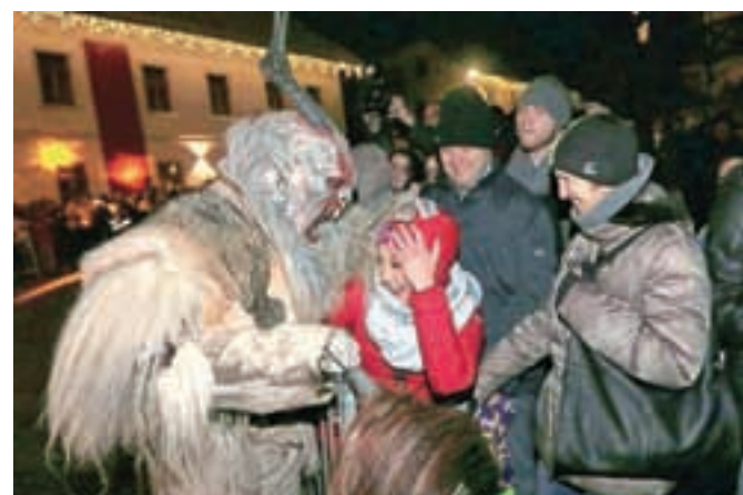
Kar devetnajst skupin rogatih in sajastih se je zapodilo proti lipi v centru vasi.