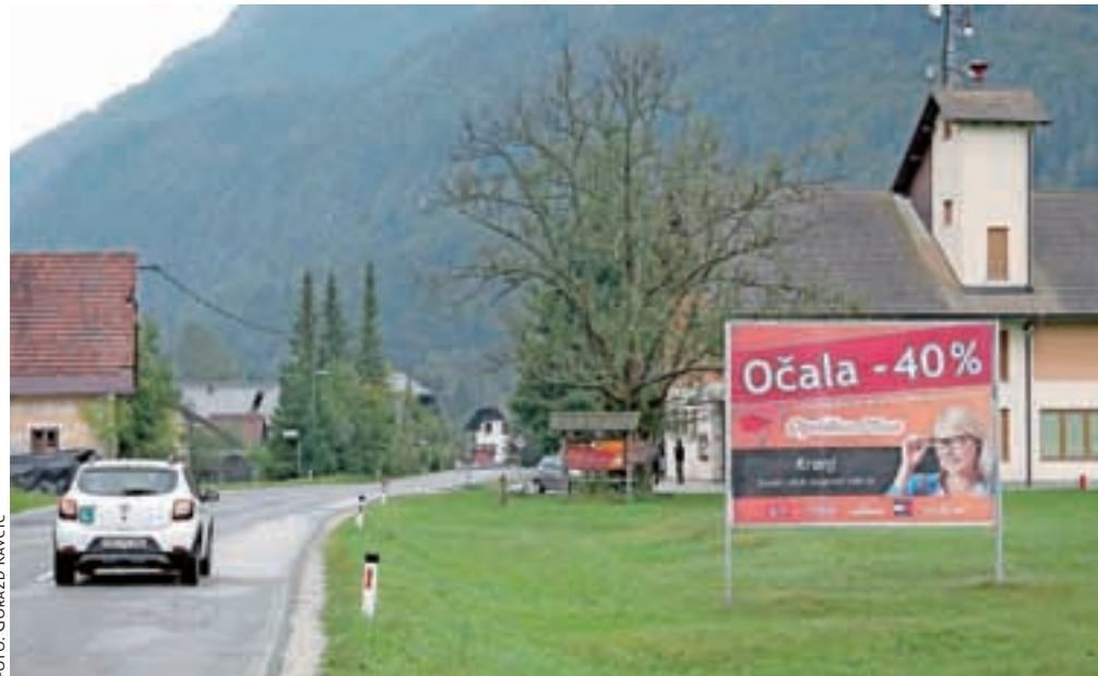
Novi odlok o plakatiranju in oglaševanju omogoča ostrejšje ukrepanje proti kršiteljem.

Reklamni panoji so tako v skladu z novim odlokom lahko veliki največ 12 kvadratnih metrov, dovoljenje za postavitev pa mora izdati pristojni občinski organ v skladu z občinskim prostornim načrtom in strokovnimi podlagami, ki jih bo sprejel občinski svet. Odlok med drugim preprečuje postavljati reklamnih objektov na javne objekte, v javne parke in na parkirišča, na kozolce in drvarnice ter na mesta, kjer bi postavitev zakrila javne objekte, obeležja ali javna obvestila, lahko