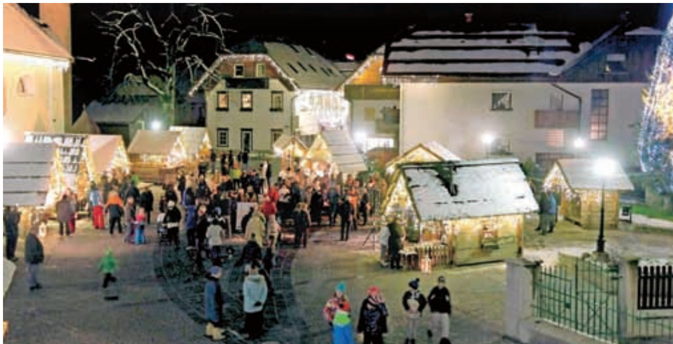
Zimsko vzdušje v idilični Alpški vasi v središču Kranjske Gore