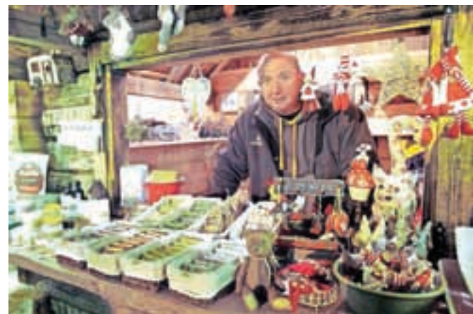
Police alpskih hišic se bodo vso sezono šibile pod težo privlačnih dobrot in domačih izdelkov.