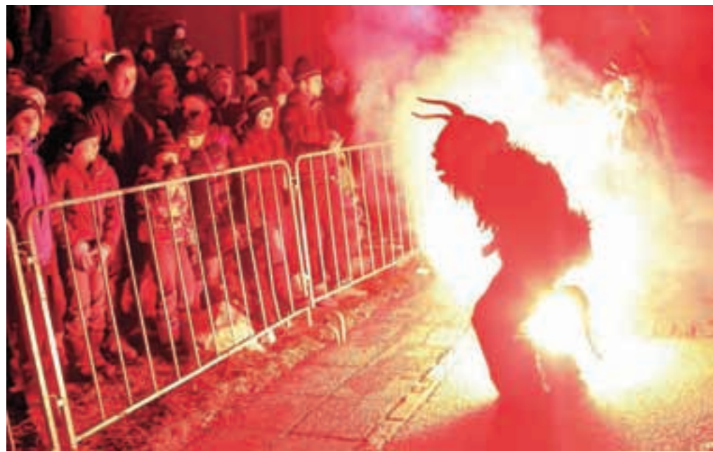
Prejšnji petek so v Podkorenu spet pripravili tradicionalno srečanje pakreljnov treh dežel.