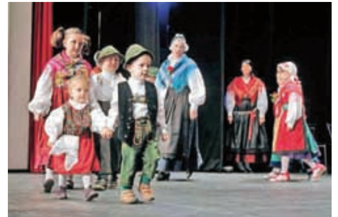
S posebnim veseljem so nastopili otroci.