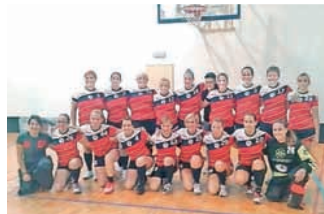
Letos imajo Zelenci tudi žensko ekipo.