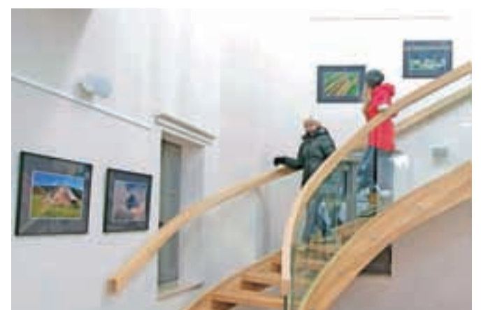
V predverju dvorane je od sobote naprej na ogled fotografska razstava del Janeza Kramarja.