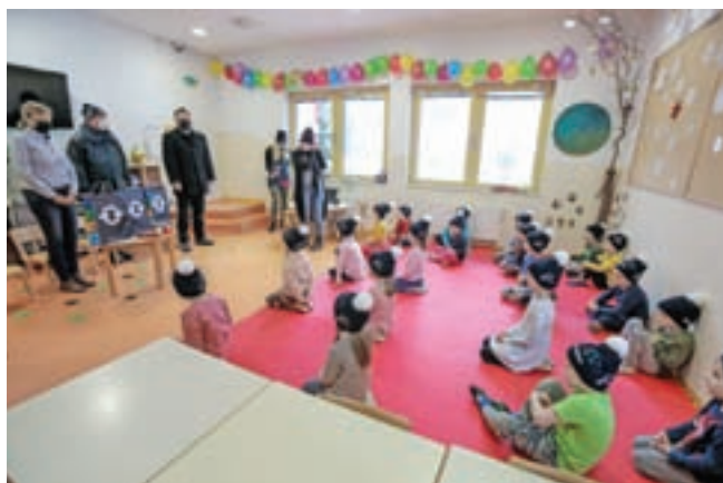
Otroci so se razveselili tudi toplih kap.