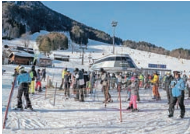
Kranjskogorsko smučišče je bilo polno domačih in tudi tujih turistov.