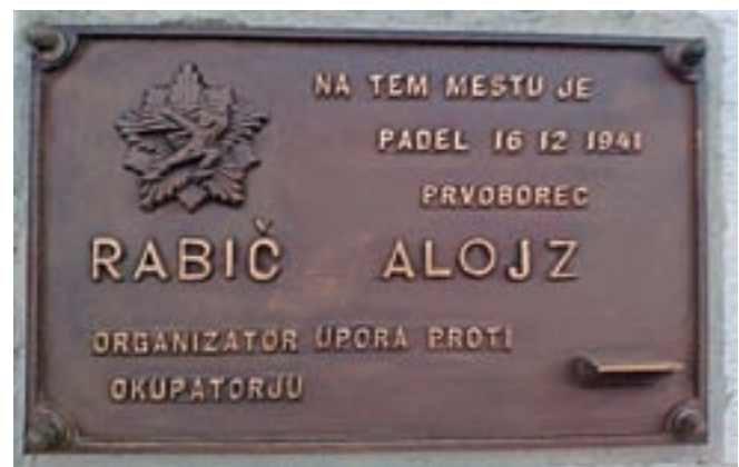
Spominska plošča v spomin na Alojza Rabiča z Dovjega