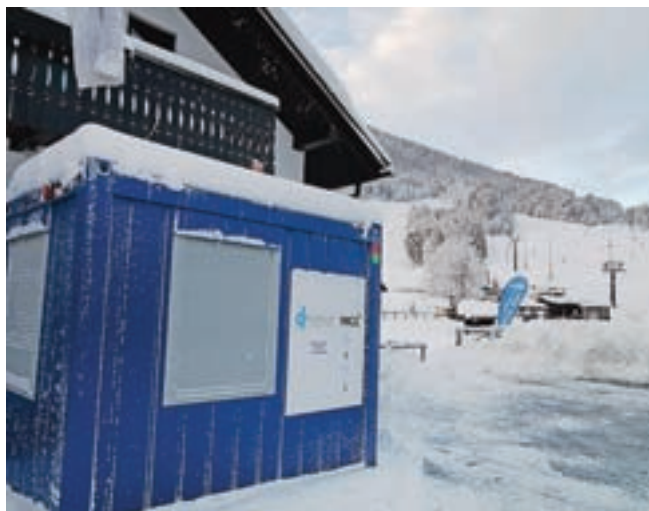
Mobilna cepilna enota je bila v Kranjski Gori.

V tem času je opazna strma rast okužb z različico omikron, ki je bolj nalezljiva kot različica delta. Kot pravi stroka, najučinkovitejši ukrep ostaja cepljenje, ki pomembno zmanjša verjetnost za težji potek covidne bolezni. V Zdravstve-