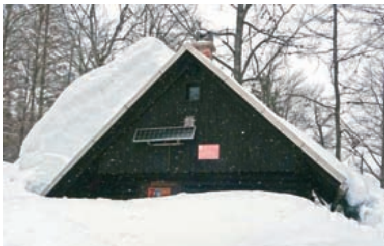
Bivak pod Špikom v snegu

Poleg virusa sta jih v spomladanskem času spremljali še dve nadlogi, in sicer ogromna količina snega ter izredno veliko število miši. »Kot običajno smo se 25. junija odpravili do Bivaka pod Špikom. Nemalo smo bili presenečeni, ker so miši tudi v zimski sobi naredile škodo. Pogrizle so vsa ležišča, odeje in blazine ter jih ponesnažile z izločki. Delovne