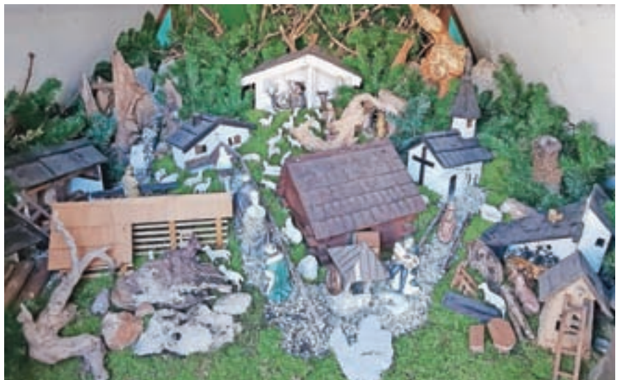
Gorske jaslice v vrtu Viharnik v Mojstrani