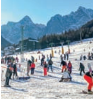
Na naslovnici: Smučanje v Kranjski Gori

ZGORNJESAV'c, ISSN 1580-7991 Ustanovitelj glasila: Občina Kranjska Gora, Kolodvorska 1b, 4280 Kranjska Gora