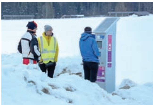
Plačilo parkirnine je možno s SMS-sporočilom, mobilno aplikacijo oziroma na parkomatih.

Javna parkirišča so razdeljena na štiri cone. Cona 1 pokriva ožji center Kranjske Gore in ključne turistične točke, ki so v času turističnih sezon najbolj obremenjene. V coni 2 je večina parkirišč v občini, cona 3 pa predstavlja parkirišča na obrobju in so jo vzpostavili z željo po preusmeritvi prometa z najbolj obremenjenih območij. Za cono 4 velja poseben režim, kot je predviden v dolini Vrata. Predvideli so tudi režim brezplačnega kratkotrajnega parkiranja v bližini pomembnih institucij, kot so občina, zdravstveni dom, knjižnica, pokopališča ... Na voljo so abonmaji (letni abonma za občane, letni in polletni splošni npr. za lastnike počitniških stanovanj, turistični 3-, 5- in 10-dnevni, letni abonma za zaposlene, ki v občini nimajo stalnega prebivališča). Letni abonma je na voljo vsem občanom občine Kranjska Gora. "Posameznik lahko pridobi več abonmajev, vendar ne več kot tri. Abonma se lahko kupi na spletni strani, fizično pa v Kranjski Gori v pisarni TIC od ponedeljka do petka med 8. in 16. uro," so povedali na Turizmu Kranjska Gora. Nakup primerne abonmaja omogoča časovno neomejeno parkiranje na javnih površinah, ki so za to določene, vendar pa še ne zagotavlja prostega parkirnega mesta. Plačilo parkirnine je možno s SMS-sporočilom, mobilno