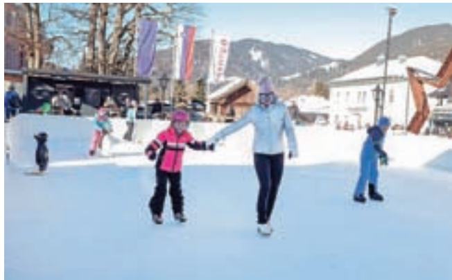
Drsališče v središču Kranjske Gore privablja tako mlade kot starejše drsalce.