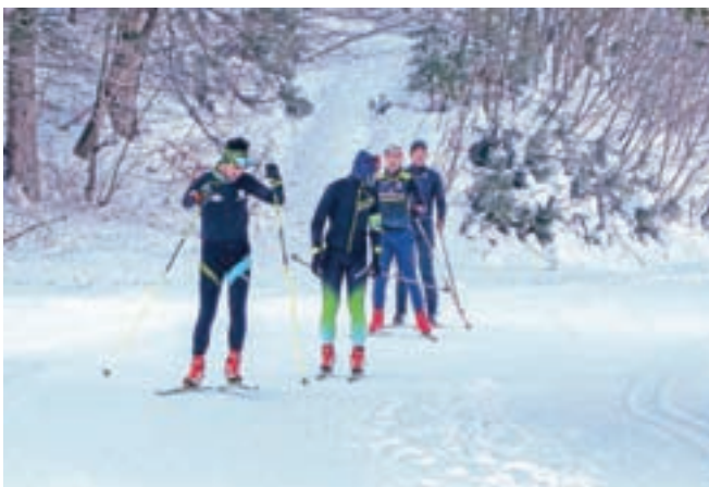
Zadnji dan starega leta so številni turisti izkoristili za tek na smučeh v Ratečah.