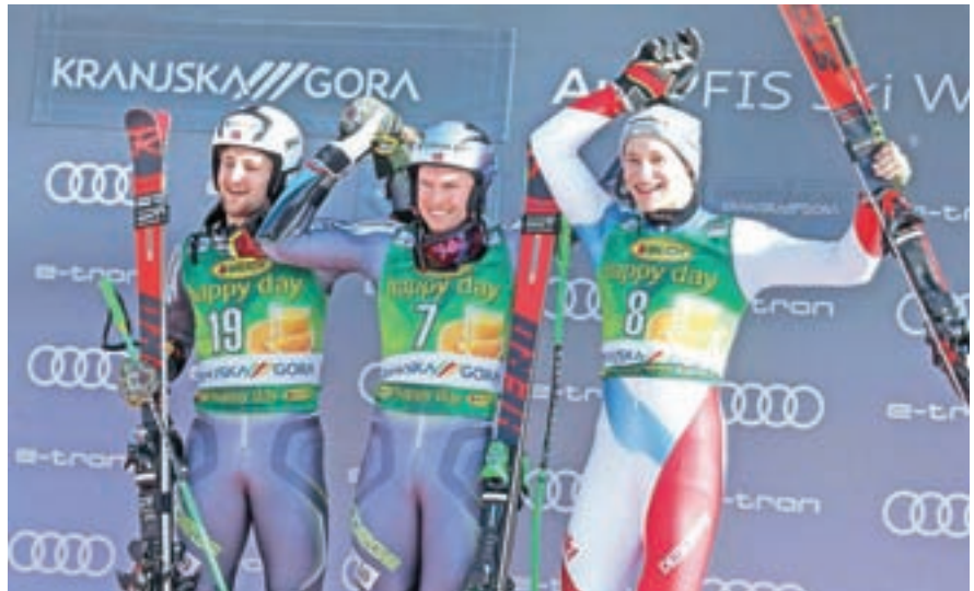
Najboljši veleslalomisti na zmagovalnem odru pod smučiščem

Sobotni večer je v času Pokala Vitranc rezerviran za veliko zabavo pred Dvorano Vitranc v Kranjski Gori. Najboljšim na veleslalomu podelijo medalje in opravijo žreb številke za nedeljski slalom. Obiskovalci imajo tudi nekaj priložnosti za fotografiranje s svojimi smučarskimi idoli. Približno pet tisoč obiskovalcev so na koncertu zabavali Samuel Lucas, Siddharta in Soulfingers.