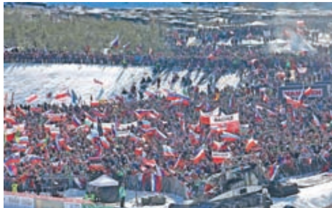
Planica se je vse dni kopala v soncu in množici obiskovalcev.

Že uvodni dan s preizkusom letalnice je napovedal izjemno Planico, ki se je vse dni kopala v soncu in množici obiskovalcev. Za Zgornjesavsko dolino je finale svetovnega pokala v smučarskih skokih izjemnega pomena. Prihodnje leto bodo pod Ponca letalci prišli že januarja, ko bo Planica gostila svetovno prvenstvo v poletih.