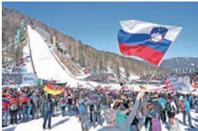
Letalnica bratov Gorišek ob petdesetletnici

sezone kar nekaj naučil, in upam, da bo prihodnja precej boljša," je nekaj besed namenil letošnji sezoni, za konec pa smo ga vprašali še o jubilentki, Letalnici bratov Gorišek: "Prvič sem bil v Planici, ko sem bi star pet let. Najbolj pa so mi v spominu ostali poleti leta 2005, ko sem bil star sedem let in je Norvežan Bjørn Einar Romøren skočil svetovni rekord. Takrat sem vzljubil skoke in rekel, da bom tudi jaz skakal. Uspelo mi je. Letalnica v Planici je doslej edina, na kateri sem skakal, tako da je ne morem primerjati z drugimi, fantje pa pravijo, da je izmed vseh najlepša."