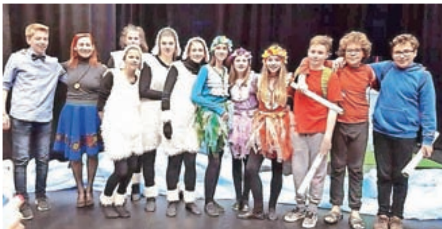
Čarobnost Blejskega jezera

Premiera predstave Čarobnost Blejskega jezera je bila 15. marca. Režiserka Metka Frelih, ki že 11 let živi na Bledu, je v legendi prebrala, kako je nastalo