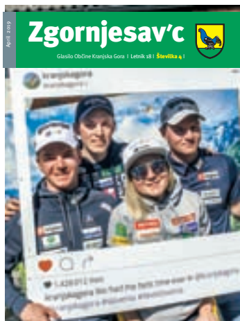
Na naslovnici: Junaki zime