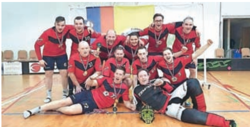
Državni prvaki v drugi slovenski floorball ligi