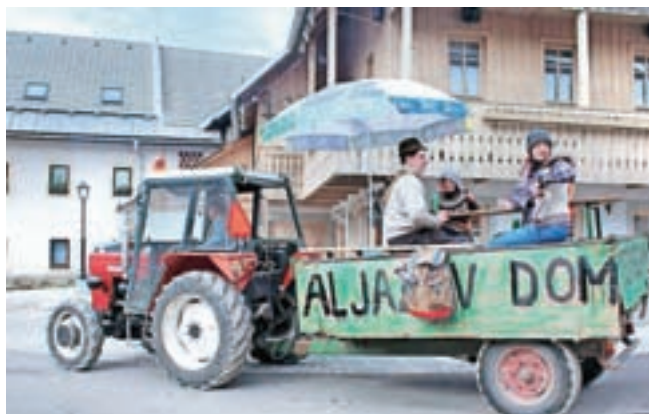
Zlatorog je obljubil, da bo Aljažev stolp spet v dolini – in res so ga pripeljali na Dovje.

Pustnemu dogajanju so na Dovjem in v Mojstrani namenili kar celo pustno soboto. Najprej so se maskare zbrale na trgu pred Hišo Pr' Katr, kjer so jih počakali pustno odeti traktorji, ki so jih nato odpeljali do Mojstrane. Traktorji so letos zajeli domačo tematiko, moč je bilo videti helikopter, Aljažev dom in Aljažev stolp. Prav za zadnjega so dejali, da so vsi verjeli, da ga še nekaj let ne bo v dolino, a so se organizatorji povorke posebej potrudili, da so ga znova pripeljali s Triglava. Na zadnji voz so maskare lahko splezale in se popeljale do naslednje točke povorke, ki je bila pri Žičnici v Mojstrani. Tam je bil že zabava, ki jo je vodil DJ Dar Mar. Pestro je bilo tudi pri piceriji Špajza in v baru Pr' Jozlno, kjer se je pustno rajanje nadaljevalo v noč.