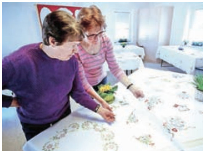
Razstavljeni izdelki so tudi letos navdušili obiskovalce.