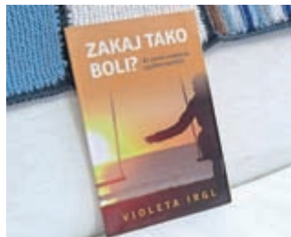
Knjižica z naslovom Zakaj tako boli?