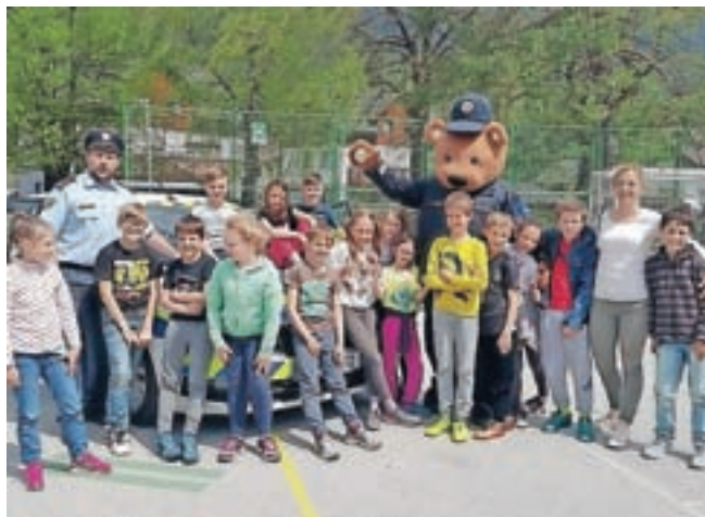
Pri projektu so sodelovali starejši otroci iz vrtca in učenci od prvega do tretjega razreda.