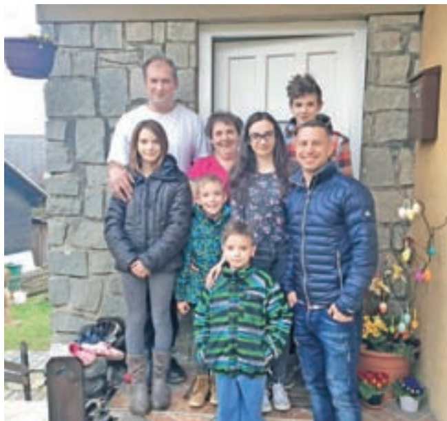
Družina iz Radelj ob Dravi bo z denarjem uredila sobo za otroke.