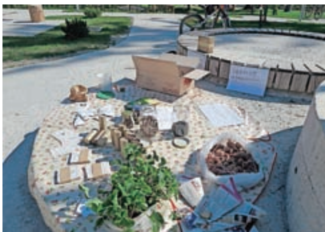
Pripravili so prostor za izmenjavo sadik ...