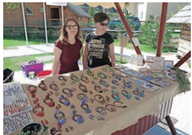
... ter promovirali lokalne pridelke in izdelke.