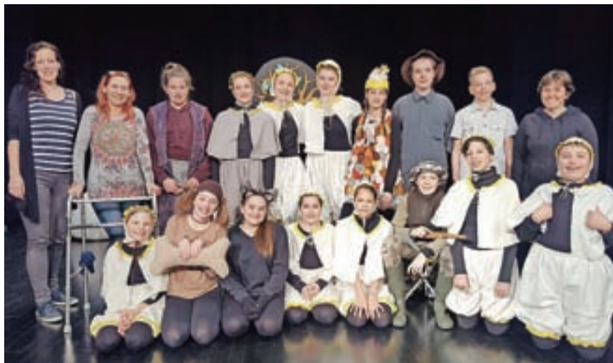
Ustvarjalci predstave Grdi raček