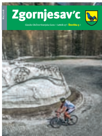
Na fotografiji: Cesta na Vršič