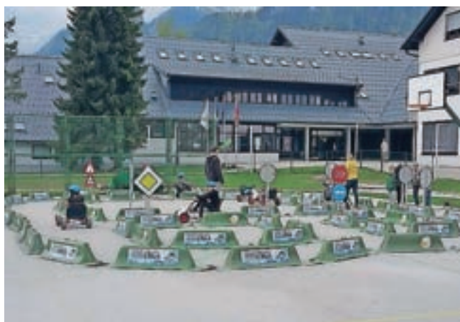
Projekt Jumicar otroke poučuje, kako se vesti v prometnem okolju – in sicer tako, da so postavljeni v vlogo voznika.

Miniaturni avtomobil vsebuje vse elemente pravega vozila: od varnostnega pasu in zavore do stopalke za plin.