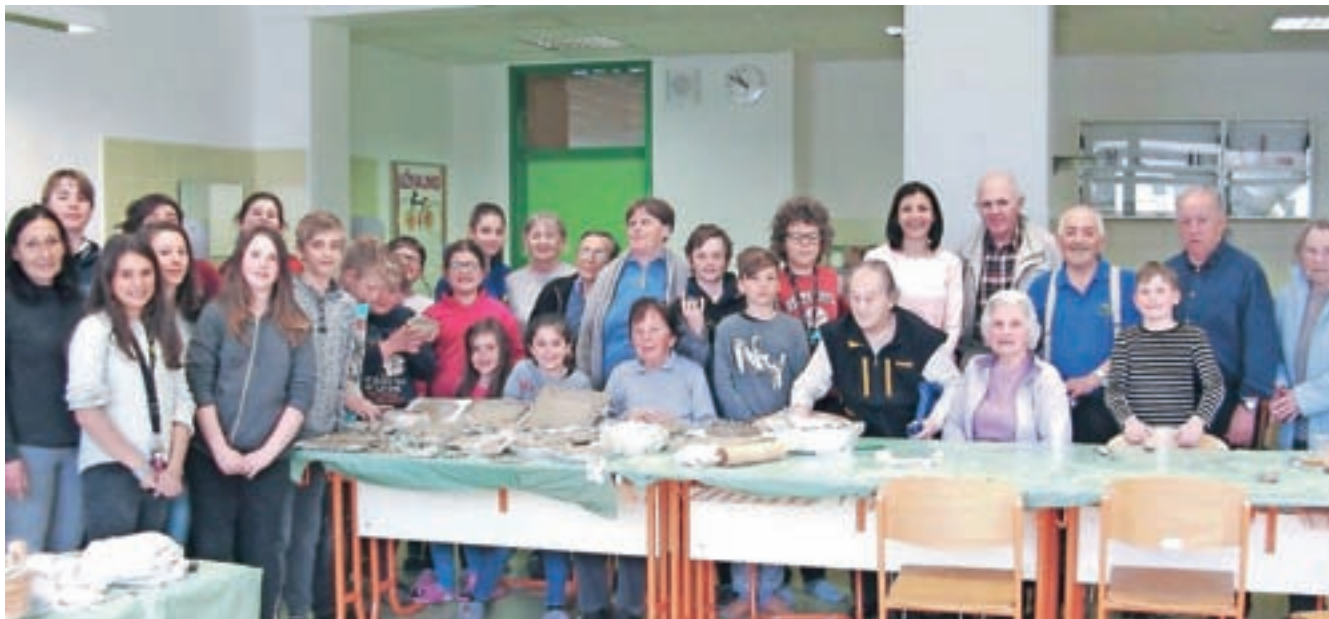
Šolarji iz Kranjske Gore in stanovalci Doma Viharnik se radi družijo.