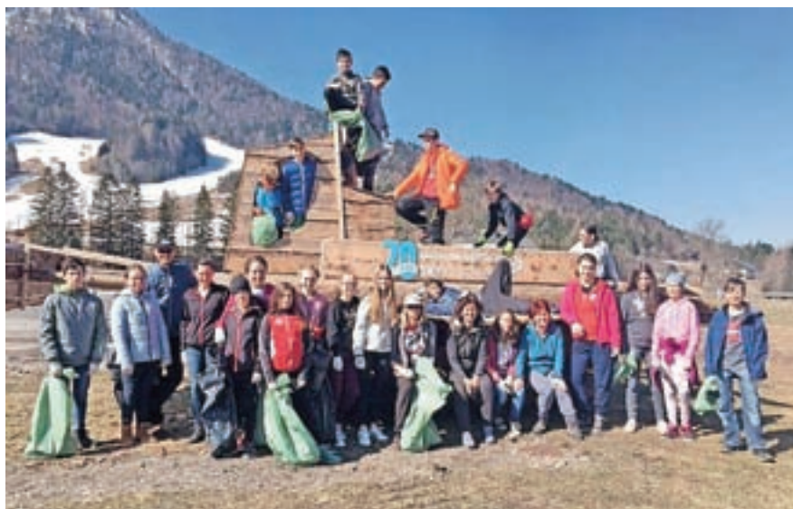
Učenci OŠ Josipa Vandota Kranjska Gora so med drugim pobirali smeti na parkiriščih v Kranjski Gori.