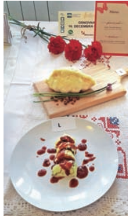
Glavna jed, ki so jo predstavile, so bili krapji s kranjsko klobaso. Za sladico so pripravile še skutine štruklje s suhimi slivami.