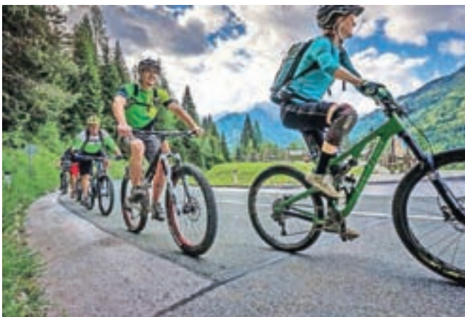
Odpravili so se tudi na novo gorskokolesarsko pot.