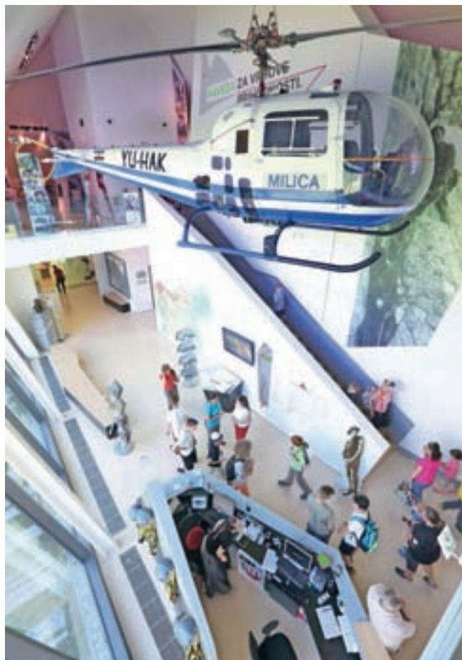
Legendarni helikopter je velika pridobitev za muzej.

"Poznavalci ocenjujejo, da trenutno po svetu leti še okrog tisoč primerkov različnih verzij modela Bell 47. Kar nekaj jih je na ogled v muzejih širom po svetu. Vendar takšen, kot si ga lahko ogledate v Slovenskem planinskem muzeju, sodi med tako redke, da jih lahko preštejemo na prste ene roke."