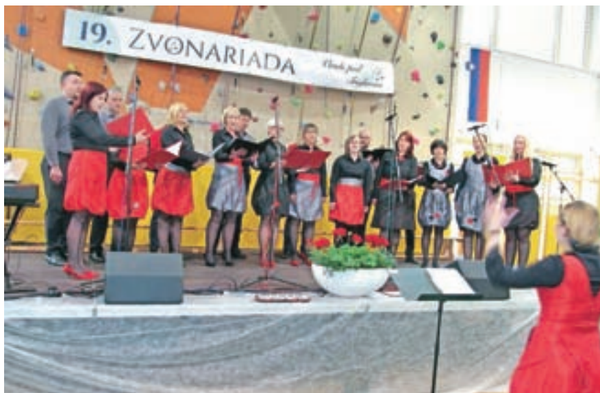
Domači zbor, Vokalno-instrumentalna skupina Triglavski zvonovi, gostitelji letošnjega srečanja

vključevali so se novi zbori, nekateri so prenehali sodelovati, sedaj nas sodeluje osem, devet zborov. Drugo leto bo jubilejna, dvajseta prireditev, nisem si predstavljal, da bo toliko časa trajalo.« Pevska prireditev je v Mojstrani tudi obogatila turistično ponudbo na pra-