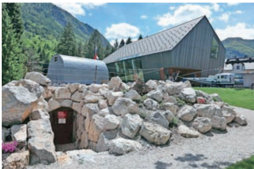
Projekt Pobeg v bivak je prejel častno Valvasorjevo priznanje za leto 2016.