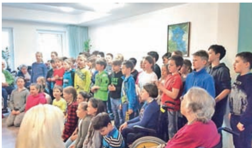
Učenci kranjskogorske osnovne šole večkrat gostujejo v Domu Viharnik.

Učenci kranjskogorske osnovne šole večkrat gostujejo v Domu Viharnik, tako z raznimi nastopi kot na ustvarjalnih delavnicah. Starostnike so tako obiskali tudi prvošolci in drugošolci ter učenci likovnega krožka. Otroci se veselijo takih srečanj in s svojo otroško razposajenostjo razvedrijo stanovalce Doma Viharnik.