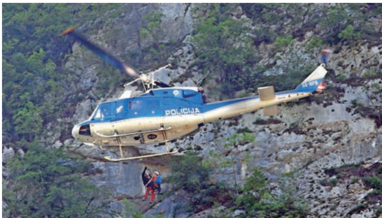
Ob tej priložnosti so v Mojstrani pripravili tudi prikaz helikopterskega reševanja v gorah.