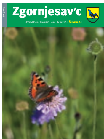
Na naslovnici: Metulj na cvetu