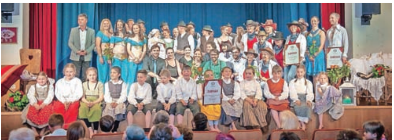
Zaključni plesni spektakel na Dovjem

Kot je še poudarila, folklorna skupina po zaslugi svojih članov, ki s srčnostjo prostovoljno prispevajo prosti čas in sredstva za ohranjanje gorenjskih ljudskih plesov in običajev, uspešno deluje in tudi zastopa svoje kraje. Zahvaljujejo se vsem, ki kakorkoli podpirajo njihovo dejavnost, Občini Kranjska Gora, ki je zagotovila sredstva za nove kostume, ter domačemu šiviljstvu Janja za odlično izdelavo.