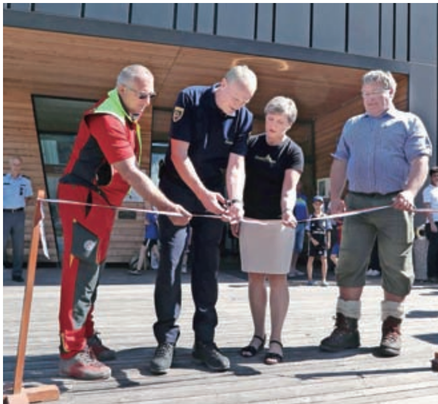
Novo pridobitev Slovenskega planinskega muzeja so slovesno predstavili na letošnjih dnevih Alpske konvencije prejšnjo soboto.

Dne 24. marca leta 1968 je ob pol osmih zjutraj pod severno steno Mojstrovke na območju Jam kložasti plaz zasul šest od osmih turnih smučarjev, ki so se namenili z Vršiča prek Vratc in čez Sleme proti Tamarju. Četrť ure pred njimi se je tam spustilo prvih osem smučarjev; zadnja dva sta še postala na Slemenu in videla vso nesrečo. Čez pobočje je smučalo drugih osem smučarjev. Najprej se je pod njimi premaknila s smučino odrezana plast, debela več kot meter. Čez nekaj trenutkov pa se je iz ozke grape petdeset metrov nad njimi s pokom utrgal plaz sprijetega, kložastega snega. Šest smučarjev so zajele velike kocke klož. Štirje so umrli, peto, ki je imela hude poškodbe, in šestega, nepoškodovanega, sta s pomočjo prve skupine rešila nezasuta tovariša, « je nesreča, v kateri je gorskim reševalcem prvič prišel na pomoč tudi helikopter, opisana v zborniku Reševanje v gorah.