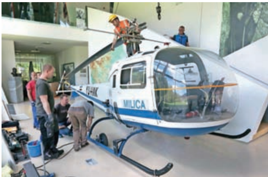
Helikopter so z jeklenicami pričvrstili pod strop.

Prav ta helikopter je nato še 15 let pomagal gorskim reševalcem, na zadnjo akcijo so ga poslali leta 1984. V torek so ga iz hangarja na brniškem letališču pripeljali v Slovenski planinski muzej v Mojstrano, kjer bo odslej, z jeklenico pritrjen pod strop tik ob vhodu, del muzejske zbirke.