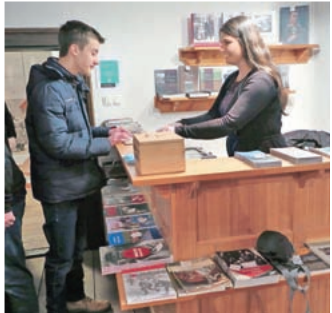
Od letošnje pomladi se v Kajžn'kovi hiši v Ratečah prepletata muzealstvo in turizem.

"Ko smo se odločali, kakšna naj bo vsebina in poudarek stalne razstave v Kajžn'kovi hiši, smo vedeli, da ne bomo delali še ene hiše, kakršna je Liznjekova, ampak bomo v