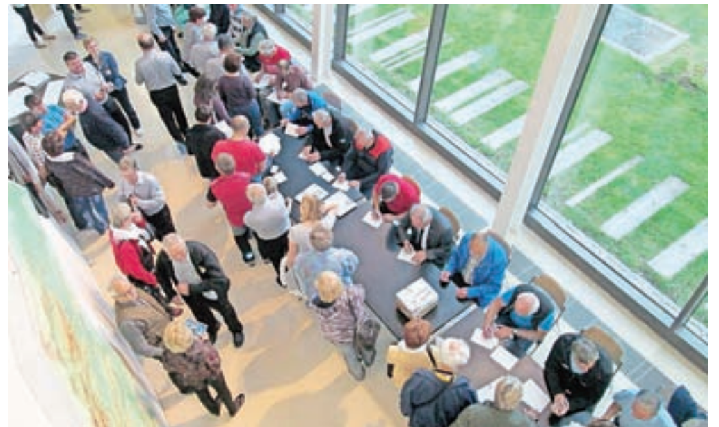
Na slovesnosti v Slovenskem planinskem muzeju

Na zgodovinske dogodke so se prejšnji teden v luči 25-letnice samostojne Slovenije spomnili tudi na slovesnosti v Slovenskem planinskem muzeju, ki so se je udeležili tudi vsi še živeči udeleženci odprave na Triglav 12. junija 1991. »Na vrhu je bil poltretji meter snega, tako da se Aljažev