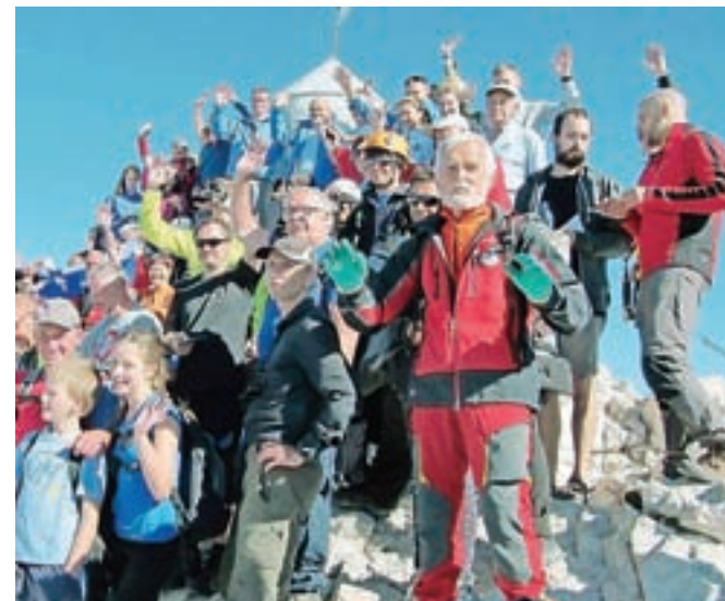
Vrh Triglava je vedno magnet za planince. Fotografija je z lanske slovesnosti ob 120-letnici Aljaževega stolpa.

re poleg osnovne še ustrezno opremo. Glede na letošnje velike pojave neurij je treba pred turo preveriti vremensko napoved, ki naj bo vsaj nekaj dni dobra in stabilna. In naj vsi upoštevajo vsa navodila, ki jih ni težko dobiti in se z njimi seznaniti. Ker je letos tudi sedemdesetletni jubilej našega društva, si res želimo, da bo za vse čim bolj varen korak pri vzponih in ob vrnitvi nazaj v dolino.«