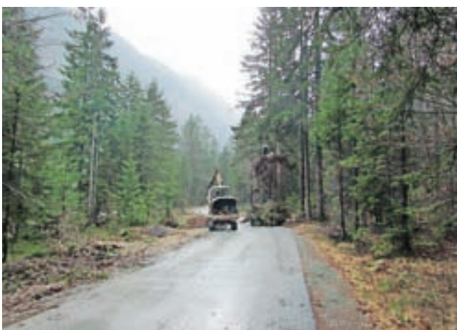
Podobno so očistili tudi cesto proti Peričniku.