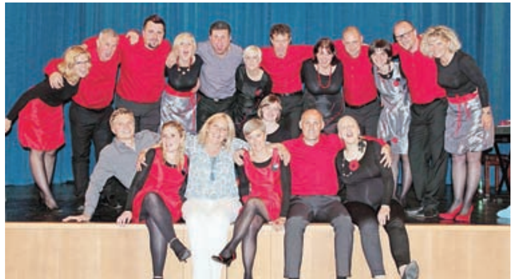
Triglavski zvonovi / Foto: ALOJZ MRVIČ

Za pevci je letos že kulturno pestro in bogato obdobje. Leto so pozdravili s koledniškimi željami; že devetih po vrsti so srečno novo leto voščili v Zgornji Radovni, v Kamnah, na Dovjem, Mojstrani, Belci, v Gozdu - Martuljku in Kranjski Gori. Prosvoljne prispevke so tokrat namenili starejšim občanom domačega društva upokojencev. Prav tako tradicionalno so v začetku januarja skupaj z mladinskim pevskim zborom Spominčice in moškim pevskim zborom Triglav priredili krajši novoletni koncert v baziliki na Brezjah. Praznik kulture so s pesmijo počastili v domu krajanov v Gozdu - Martuljku, februar pa zaključili z udeležbo na reviji odraslih pevskih zborov na Slovenskem Javorniku, kjer so premierno predstavili del lastnega repertoarja, ki ga razvijajo v sodelovanju z mladimi skladatelji. V začetku maja so sodelovali na prireditvi Ko oder oživi, ki jo je organizirala domača folklorna skupina KUD Jaka Rabič. Pred Slovenskim planinskim muzejem so sodelovali na srečanju planinskih zborov ter potovali v Muto, na slovensko Koroško, kjer je letos potekala Zvonariada, tj. srečanje slovenskih pevskih zborov z besedo zvon v imenu. Pred počitnicami pa so še zadnjič staknili glave ter poiskali