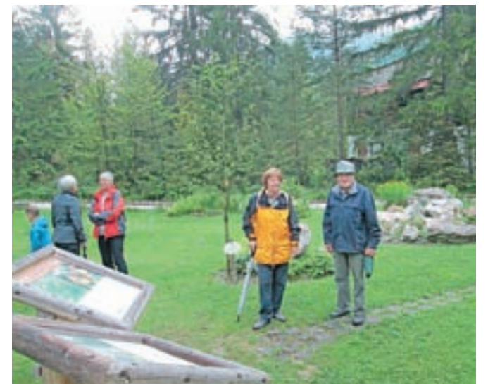
Skalnjak na začetku Gozdne učne poti Rute

Martuljek na učno pot in postavili mlinčke. Znotraj učne poti je tudi kopišče, kjer namerava Društvo oglarjev Rute postaviti šestrotkotni nastrešek. Idej je še kar nekaj pa tudi volje namreč zmanjka."