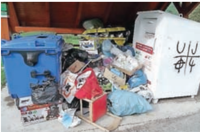
Divja odlagališča so odraz neodgovornega ravnanja posameznikov. Poskrbimo, da takšnih prizorov ne bo več.

Na Komunalni Kranjska Gora opozarjajo, da se kljub številnim opozorilom in vsesplošnemu obveščanju o ločevanju odpadkov še vedno vse prevečkrat, sploh ob koncih tedna na počivališčih, srečujejo z napačno odloženimi odpadki. "Odgovorno ravnanje z odpadki je eden bistvenih dejavnikov varovanja in ohranjanja okolja. Cilj pravilnega ločevanja je zmanjševanje količin odloženih odpadkov in povečevanje deleža njihove ponovne uporabe oziroma recikliranja. Eden izmed pogojev, da bi odpadki lahko ponovno postali uporabne surovine, je njihovo ločevanje in pravilno odlaganje, tako doma kot na ekoloških otokih," opozarjajo. Kosovne, nevarne in druge specifične odpadke, ki jih ni možno odložiti v hišni zabojnik, lahko vedno brezplačno oddate na zbirnem centru. "Zakonodaja s področja ravnanja z odpadki nas zavezuje k ločevanju na kraju njihovega nastanka, hkrati pa je to najmanj, kar lahko storimo za urejen kraj in ohranitev okolja, še opozarjajo. "Vsak posameznik je odgovoren za pravilno oddajanje svojih odpadkov v ustreznih zabojnikih. Urniki odvoza posameznih odpadkov so objavljeni na naši spletni strani www.komunala-kg.si ."