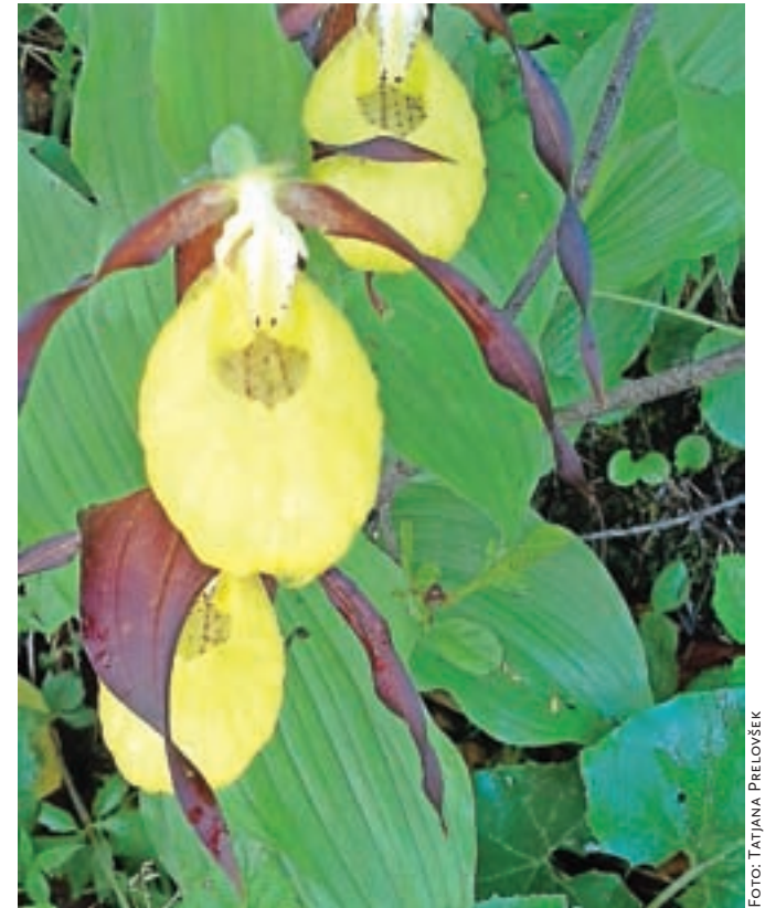
Lepi čevljec ( Cypripedium calceolus ) je ena izmed najlepših orhidej v Evropi. V Gozdu - Martuljku je največje poznano območje uspevanja te ogrožene vrste v TNP.

V prihodnje želijo predvsem vzdrževati to, kar so že naredili. "V skalnjaku bi radi zasadili še kar nekaj cvetja, ki je značilno za naše kraje, tudi kakšno drevesno vrsto bi še dodali. Namestili bomo nekaj valilnic in naredili hotel za žuželke. Prav tako bi radi speljali del potoka