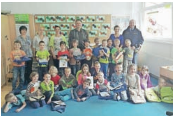
... kot tudi v Mojstrani.