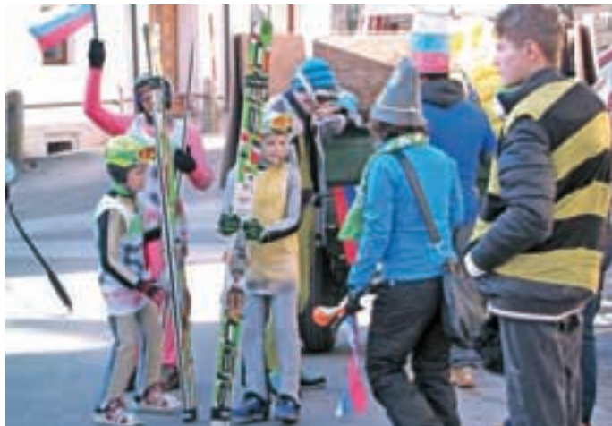
Slavna in uspešna brata Prevc sta si za pusta vzela eno uro časa in obiskala vaške šeme.

Zmage na drsališču se je veselila ekipa Društva mladih Kranjska Gora, kar morda namiguje, da so si metle sposodili od čarovnic, saj bi organizator moral solidarnostno pristati vsaj na drugem mestu. Še eno zmago pa so popoldne zabeležili v piceriji Špajza na Dovjem, kjer se je plesa v maskah udeležilo ogromno število najmlajših vaščanov. In ko so ti legli v svoje postelje po napornem dnevu, je še starše čakala zabava v hostlu Jozl. Ob zaključku pustnega rajanja so podelili tudi nagrade za najboljšo masko, ki jo je domov odnesel kdo drug kot pav, za družinsko