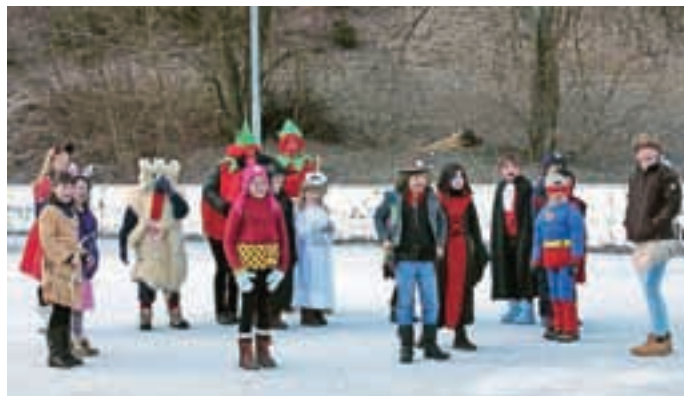
Maske se ogrevajo pred hokejem z metlami.