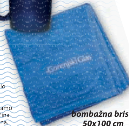
bombažna brisača 50x100 cm

Popust in darilo veljata le za fizične osebe. Daril ne pošiljamo po pošti. Količina daril je omejena.