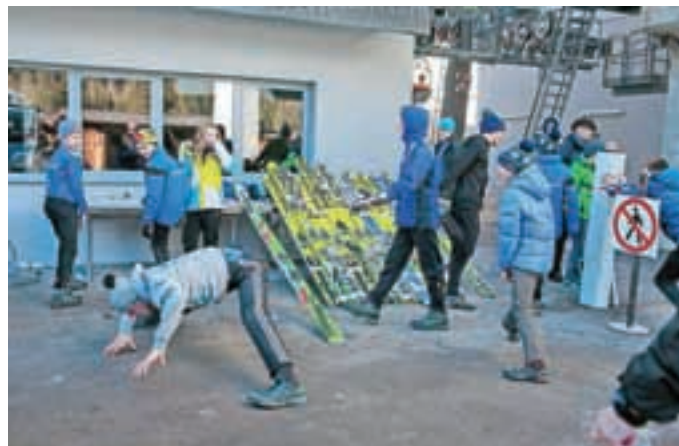
Ne le najboljši smučarji na svetu, tudi generacije, ki prihajajo za njimi, imajo svoj prostor v Planici.