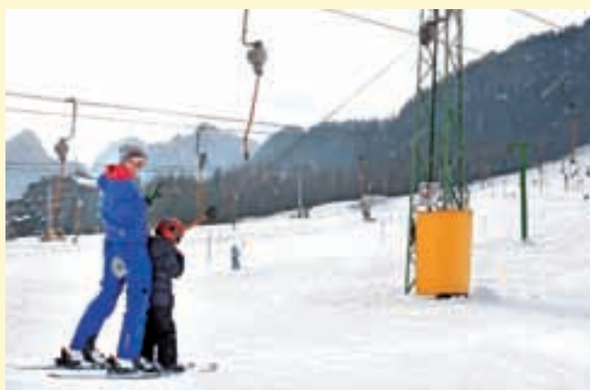
Ljubitelji snežnih radosti na kranjskogorskem smučišču / Foto: Gorazd Kavčič

Sicer pa so se kranjskogorski žičničarji v zadnjih dneh posebno razveselili snega, ki je pobelil Slovenijo. »Obratujemo že skoraj dva meseca in glede na izredno slabe vremenske pogoje za obratovanje smučišč v decembru smo s potekom sezone do sedaj zadovoljni, ker smo bili eno redkih evropskih smučišč, ki je obratovalo na nadmorski višini osemsto metrov. Do sedaj nas je obiskalo nekaj več