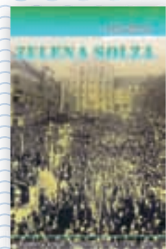
knjiga Zelena solza