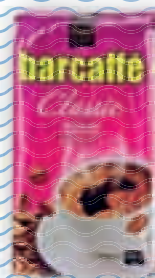
kava Barcaffè 250 g