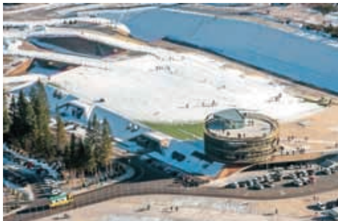
Planica zdaj poleg skakalcev privablja tudi smučarje tekače.