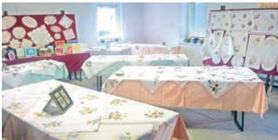
Razstava je vsako leto lepo obiskana.

bili na ogled prti z različnimi živobarvnimi motivi, večinoma cvetličnimi, pa tudi klekljanje, rateški žoki, otroški volneni copatki in cokle, ki so se jih učili izdelovati v okviru projekta Leader, ki so ga pri Turističnem društvu Rateče - Planica izvedli skupaj z Občino Kranjska Gora. Ker je razstava vsako leto zelo dobro obiskana, saj si jo poleg domačinov vsako leto ogleda tudi veliko radovednežev z vse Gorenjske, jo že napovedujejo tudi za prihodnje leto. Tudi zato, da tradicija ne bi šla v pozabo.