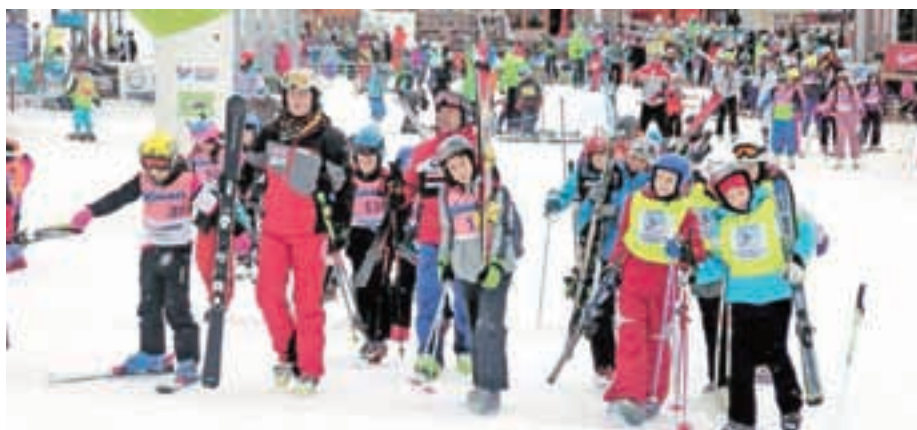
Petošolci iz zahodne Slovenije so povsem zavzeli smučišče v Kranjski Gori.

Strmine smučišča v Kranjski Gori so konec januarja prekipevale od mladostniške energije, saj je smučišče zasedlo več kot 550 petošolcev, ki so se udeležili zadnjega dne vseslovenskega projekta Šolar na smuči. Projekt so pripravila smučišča Pohorje, Rogla, Cerkljeva, Krvavec in Kranjska Gora v sodelovanju s Smučarsko zvezo Slovenije, Združenjem slovenskih žičničarjev, Olimpijskim komitejem Slovenije in Zavodom za šport RS Planica. Namen projekta je bilo petošolcem omogočiti dan brezplačnega smučanja z ustrezno podporo učiteljev smučanja, projekt pa je dosegel izjemen uspeh, saj je skupaj na petih smučiščih smučalo več kot 2400 petošolcev. »Super je, bolje kot šola,« so v en glas poudarjali petošolci v Kranjski Gori.