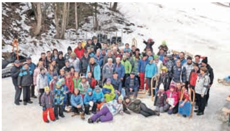
Kar okoli 60 članov gasilskih društev iz Kranjske Gore in pobratenega PGD Krašnja je sodelovalo na sobotni sankiški tekmi v Gozdu - Martuljku.