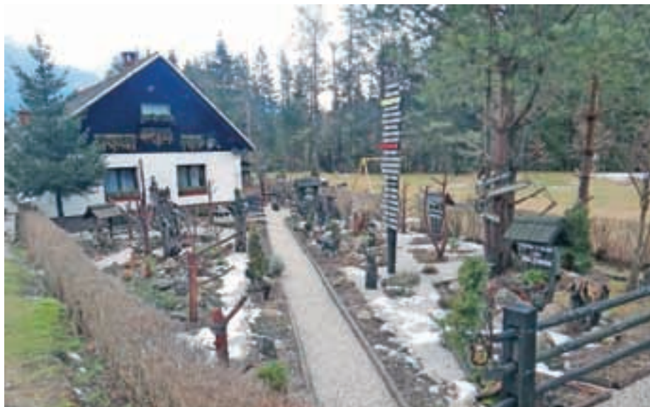
Vrt Viharnik bo prihodnje leto praznoval že četrto stoletje.