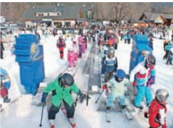
Polna snežna plaža v Kranjski Gori ob četrtem Zimskem čarobnem dnevu

Zadnja januarska nedelja v Kranjski Gori je bila po zaslugi prireditve Zimski čarobni dan posebno čarobna. Po zaslugi delovnih žični-