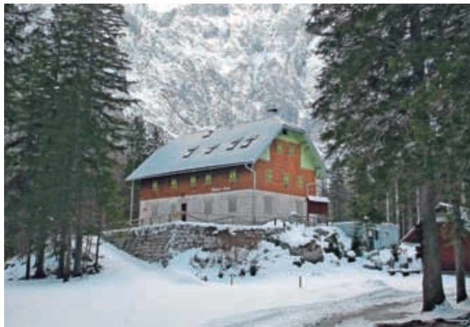
V agrarni skupnosti so zadovoljni, da je postopek vendarle končan, a razočarani, ker jim država ni zaupala naravnih spomenikov.

»Dolgo smo nasprotovali elaboratu parcelacije, ki ga je pripravila Geodetska uprava RS, saj so v njem zaščitena področja, ki so izvzeta iz vračila, preširoko zarisana. Prav tako ne moremo sprejeti dejstva, da nam Republika Slovenija ni bila pripravljena izkazati zaupanja, da bi za območja naravnih spomenikov lahko skrbeli kot dober gospodar – skozi zgodovino se je Agrarna skupnost Dovje-Mojstrana vedno izkazala, da zna čuvati naravne danosti in zanje primerno skrbeti. Žal posamezni primeri kažejo, da tega ne moremo trditi za državo. Upamo in pričakujemo pa, da nam bo tokrat s svojimi ravnanji in dejanji dokazala ravno nasprotno.«