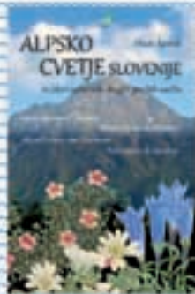
Priročnik Alpsko cvetje Slovenije