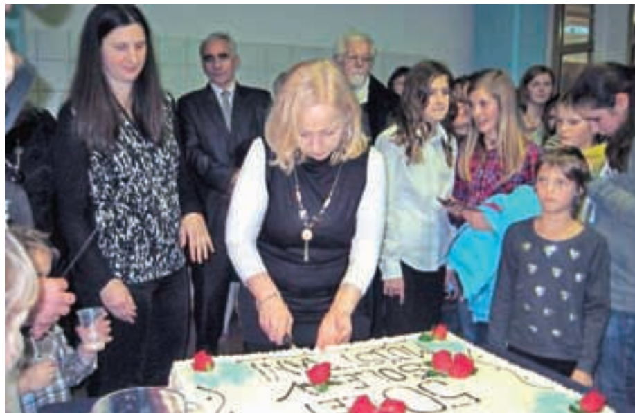
Slovesnost ob 50-letnici šole so pripravili 16. decembra, ob krajevnem prazniku, po katerem šola nosi ime.

Na Dovjem in v Mojstrani se je upor proti Nemcem začel 16. decembra 1941, le nekaj mesecev po okupaciji. V njem je sodelovalo 119 vaščanov. Nemci so jih aretirali 89, devet domačinov so že 12. februarja 1942 ustrelili v Dragi pri Begunjah, 17 jih je umrlo kmalu po prihodu v koncentracijska taborišča.