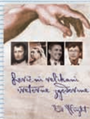
Zbornik Levični velikani svetovne zgodovine