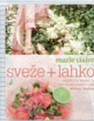
Kuharska knjiga Sveže + lahko