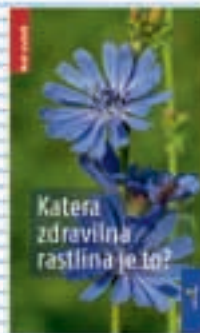
Priročnik Katera zdravilna rastlina je to?