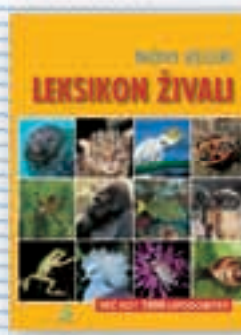
Leksikon Novi veliki leksikon živali