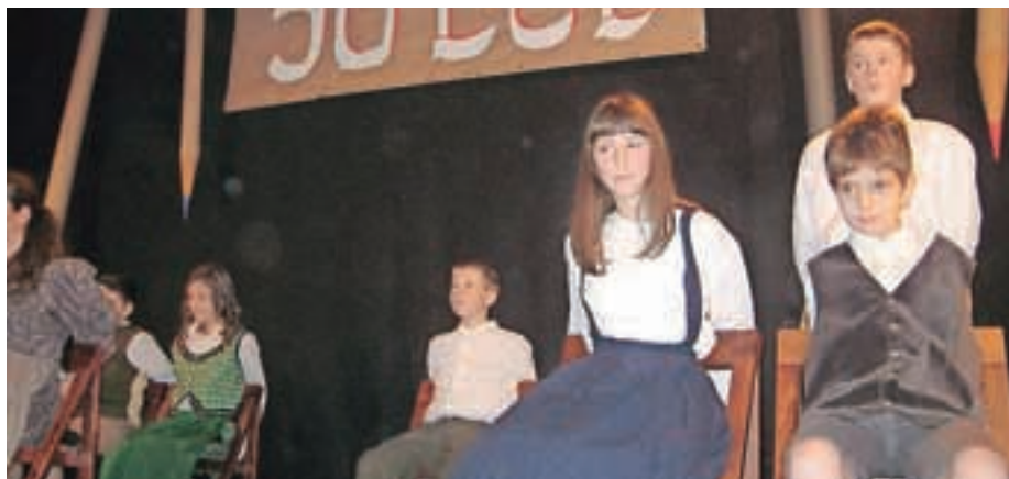
Na prireditvi so nastopajoči učenci občinstvu, ki je do zadnjega kotička napolnilo šolsko telovadnico, predstavili življenje v šoli nekoč in danes.