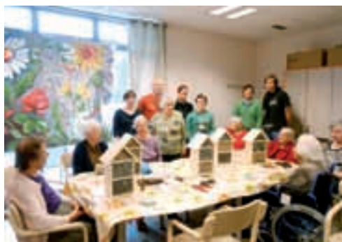
Hoteli za koristne organizme so napolnjeni z različnimi naravnimi materiali. Pri delu nam pomagajo dijaki in študenti BC Naklo.