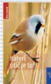
Priročnik Kateri ptič je to?