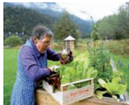
Poglejte, koliko pridelka imamo ...

S prihodom zime se je delo v »garklcu« za nekaj mesecev ustavilo, kljub temu pa stanovalci že načrtujemo spomladanske vrtnarske podvige. Pridi in igray se »Garklc« skupaj z nami.