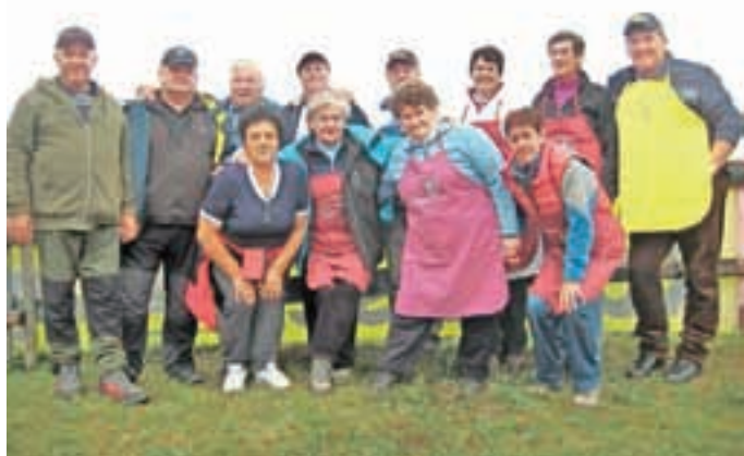
Dolgoletna ekipa Ratečanov je tudi letos poskrbela, da je bilo na Tromeji vse tako, kot mora biti.