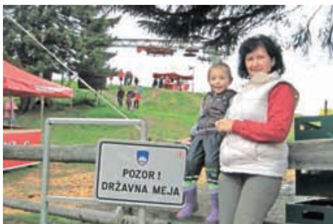
Državna meja je zdaj za obiskovalce le še napis na tabli.