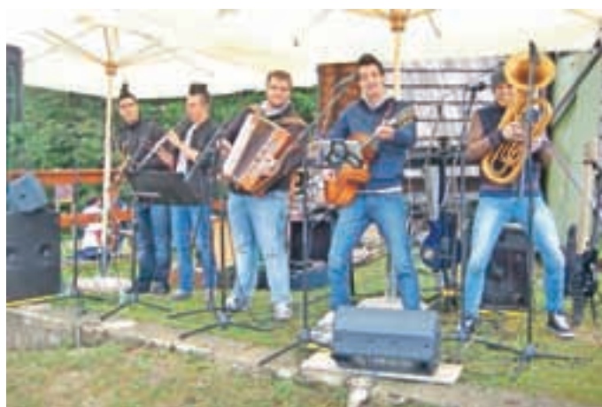
Tudi tokrat je bilo poskrbljeno za dobro vzdušje.