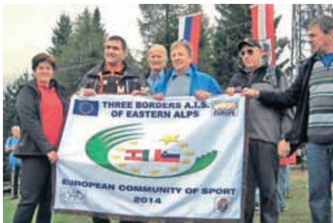
Zastava Evropske športne skupnosti

Letos je bilo obiskovalcev sicer nekaj manj kot prejšnja leta, saj je slabo vreme v dneh pred prireditvijo marsikoga odvrnilo od obiska te slikovite točke nad Ratečami, a to organizatorjem ni vzelo poguma. Tisti, ki so na srečanje prišli, pa so tudi dobili vse, kar so pričakovali: prijetno planinsko vzdušje, dobro hrano in obilo zabave.