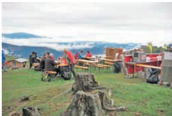
Obiskovalcev je bilo letos manj kot prejšnja leta.