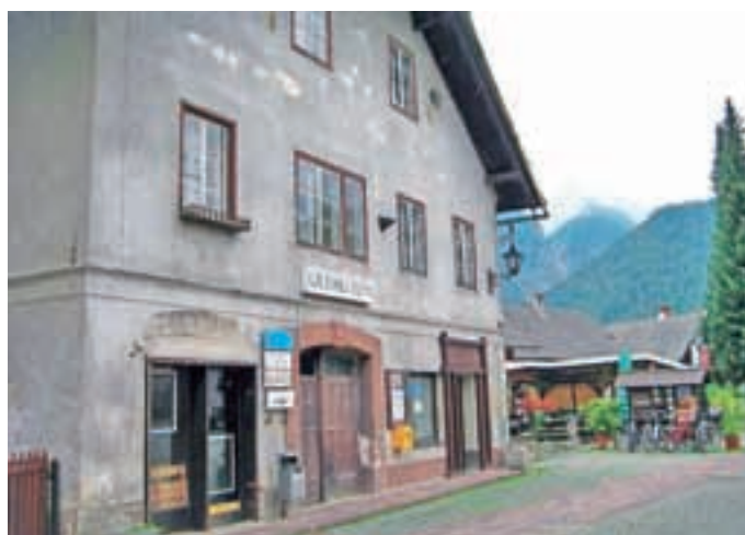
Na mestu starega Ljudskega doma bo že prihodnje leto stala nova stavba, namenjena predvsem društveni in kulturni dejavnosti.