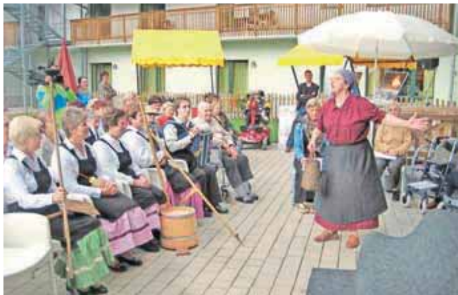
Udeleženci so z velikim veseljem prisluhnili nastopu v pristni zgornjesavski govorici.