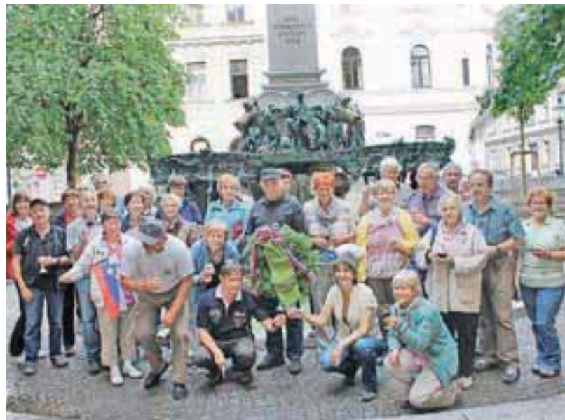
Zdravica kulturnemu društvu ob stoletnici na Dunaju pred Plečnikovim vodnjakom Karla Boromejskega 25. 6. 2014, venček v spomin Jakobu Aljažu, avba iz časa ustanovitve in navdušeni udeleženci ekskurzije