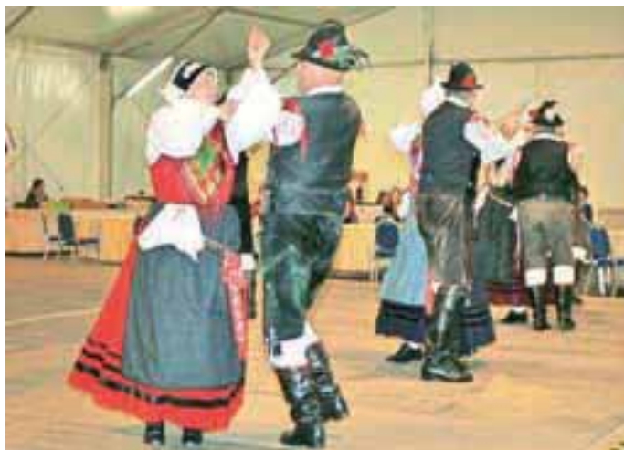
Folklorniki so zabavali prisotne in kdorkoli je želel, je tudi sam postal del plesnega večera.

V Kranjski Gori so nedavno pripravili dogodek, ki so ga poimenovali Slovenska folklor ... s pridihom modernega. Degustacije vin so združili s plesom, glasbo in predstavitvijo domačih okusov.