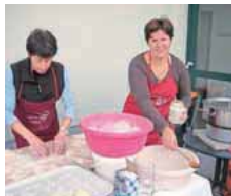
Članice turističnega društva Rateče - Planica so kuhale domače rateške krape.