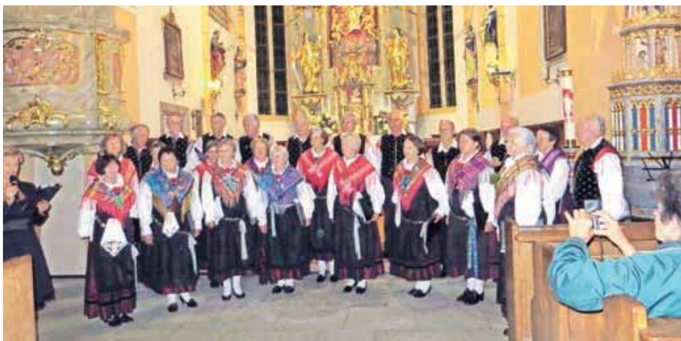
Škerlovi dnevi so bili tokrat v kranjskogorski cerkvi.