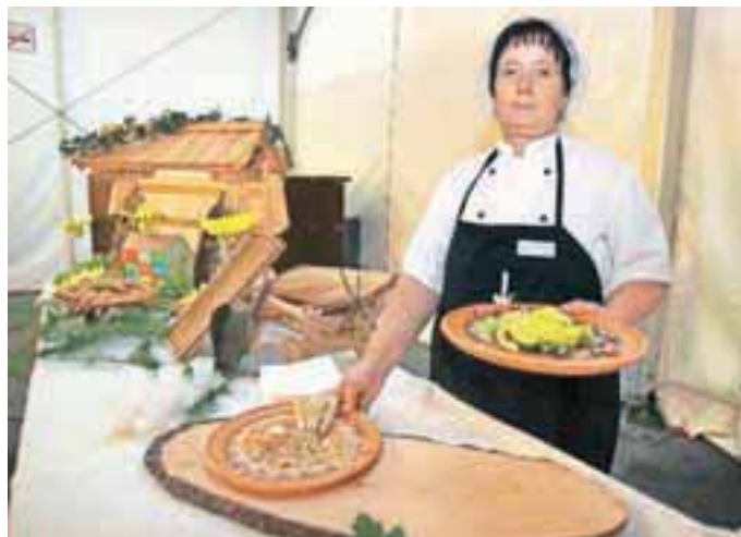
Pri Marjetki Ivanovič ste se lahko nagledali in naužili domačih dobrot ali pa vas je zamikal ričet s suhim mesom.