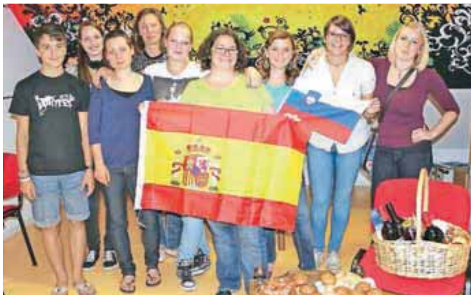
Navdušeni udeleženci jezikovnega tečaja španščine.

V septembru prirejajo nove, zabavne in zanimive delavnice. Vljudno vabljeni, da se nam pridružite na potopisnih predavanjih, pri izdelavi lovilcev sanj ter delavnici izdelovanja jesenskih aranžmajev. Vsem, ki ste pomagali ali nam na kakršenkoli način omogočili izvedbo delavnic, pa se iz srca zahvaljujemo. V prihodnosti nas lahko spremljate prek Facebooka in na oglasnih deskah, kjer vas bomo pridno obveščali o svojih aktivnostih.«