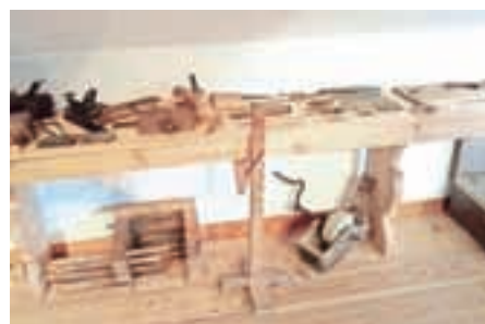
V Kajžnkovi hiši so med drugim na ogled kombinirani oblič, vodni brus in dvoklini oblič.