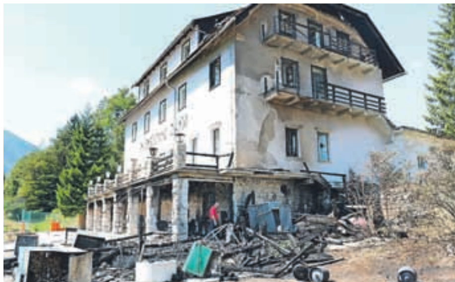
Požar je brunarico Golf kluba Kranjska Gora (v ospredju) in Porentov dom popolnoma uničil.

Prostovoljni gasilci so gasili zunanji del doma, gasilci GARS Jesenice so poskusili izvesti notranji napad in gasili podstrešje, vendar so se morali zaradi visokih temperatur ter padajoče izolacije in kombi plošč s stropa umakniti. Gašenje požara je trajalo več kot šest ur, težave pa jim je povzročala tudi pločevinasta streha, ki so jo morali razrezati in pripravili dostope za gašenje z gasilskima lestvama. Po informacijah policije je na objektih nastala velika materialna škoda, ki po prvih ocenah znaša približno dvesto tisoč evrov: «Pogorela sta dva objekta, in sicer lopa in dom. Vzrok požara kriminalisti se ugotavljajo.»