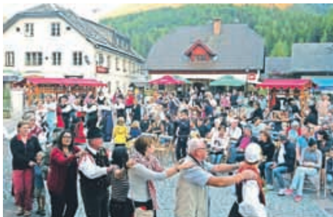
Letošnje prireditve so bile v znamenju ljudskih plesov in petja.