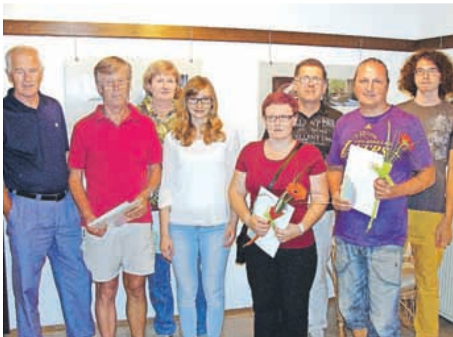
Nagrajenci fotografskega natečaja

Člani organizacijskega odbora pri KUD Jaka Rabič Dovje-Mojstrana so skupaj z domačim planinskim društvom in drugimi ljubiteljskimi zanesenjaki na letošnjih 22. Aljaževih dnevih od petka, 23., do nedelje, 25. avgusta, s sodobnimi vsebinami dali nov prispevek k ohranjanju planinskih, kulturnih, posvetnih in domoljubnih dejanj dovškega župnika Jakoba Aljaža.