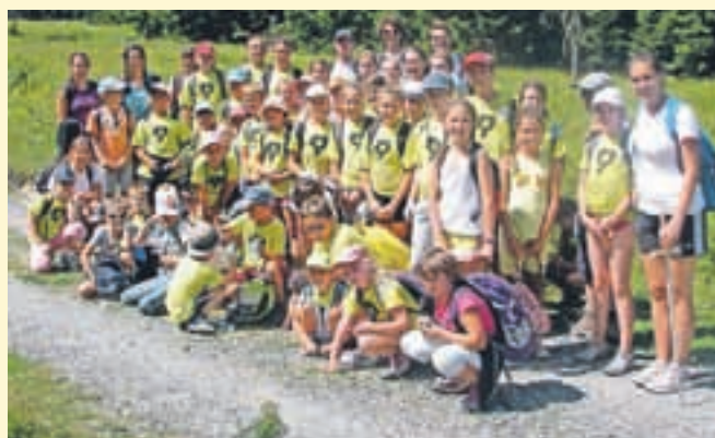
Na oratoriju so ustvarjali, se igrali in šli na izlet.