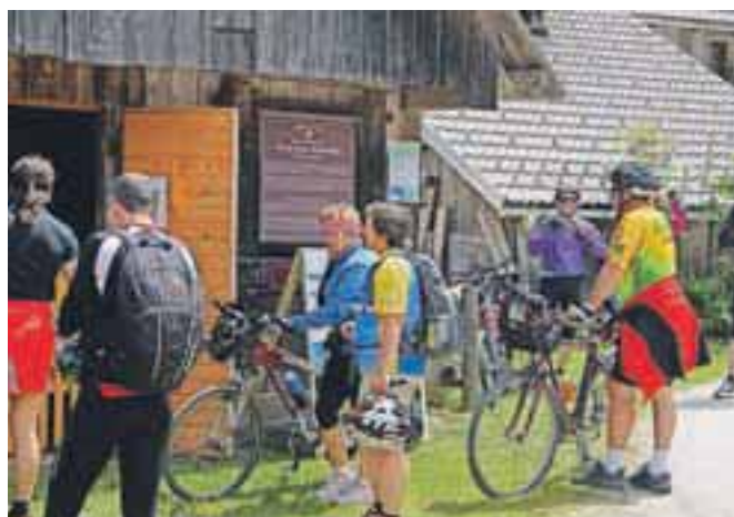
Pohodniki in kolesarji so si z zanimanjem ogledali Pocarjevo domačijo v Radovni, etnološki muzej, ki deluje v okviru Triglavskega narodnega parka.

veščati tako o pestrosti narave kot o bogastvu kultur v alpskem prostoru. Osnovno namen Dneva Alpske konvencije je bil tako opozoriti na občutljiv alpski prostor, predstaviti pomen Alpske konvencije in posebnosti alpskih dolin, pomen ohranjanja narave in kulturne dediščine ter spodbuditi obiskovalce, da alpske doline obiskujejo na okolju prijazen način.