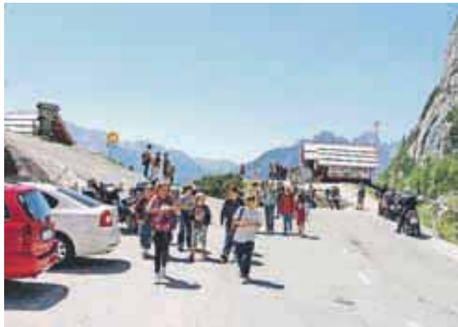
Živahen poletni vrvež na Vršiču

»Letošnja dolga zima je kar pošteno zamaknila začetek sezone. Najprej je bilo kar za polovico manj obiskovalcev kot lani, šele ob lepem junij-