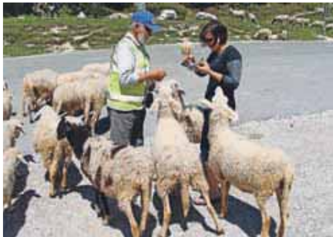
Ovce se med obiskovalci počutijo povsem domače.

skem vremenu se je obisk povečal. Najprej so bili predvsem tuji turisti, naših je veliko manj kot prejšnja leta, mislim,