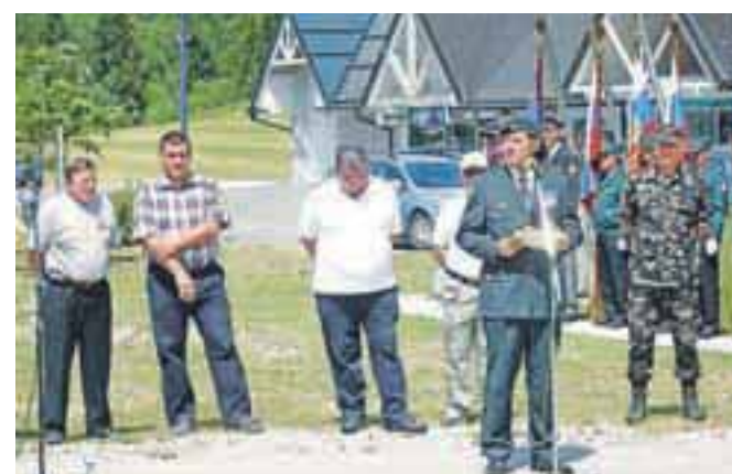
Dan državnosti so tudi letos počastili ob spominskem obeležju na nekdanjem mejnem prehodu Rateče.