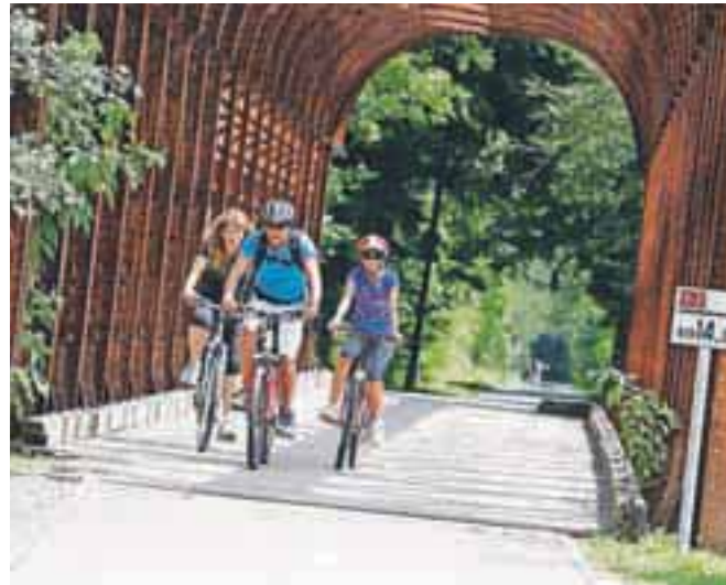
Večina aktivnosti in dogodkov, ki jih za letošnje poletje pripravljajo turistični delavci iz vse občine, bo potekala na prostem.

Kot pravi, struktura gostov ostaja podobna kot v zadnjih letih, saj tudi večino promocijskih aktivnosti izvajajo na standardnih trgih: »Največ je Slovencev, sledijo Italijani, Nemci, gostje iz Velike Britanije in Belgiji pa tudi gostje iz Hrvaške in Srbije. Veliko si obetamo od prireditve Eurobasket, ko bo pri nas bivala večina reprezentanc, ki igrajo v prvem delu na Jesenicah, prav tako pa pričakujemo navijaške skupine iz tujih držav. Naši hotelirji v času Eurobasketa napovedujejo dobro zasedenost; dogodek bo prav gotovo podaljšal poletno sezono.« Za letošnje turistično sezono so pripravili kar nekaj novosti. Med zanimivejšimi je vzletišče za skok s padalom v tandemu na območju Karavank, ki ga je uredila agencija Julijana. »Žičnice