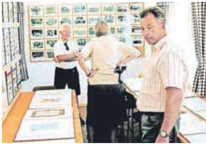
Predsednik Gasilske zveze Kranjska Gora si je ob 120-letnici gasilskega društva Mojstrana ogledal tudi tamkajšnjo razstavo značk in gasilskih odlikovanj.