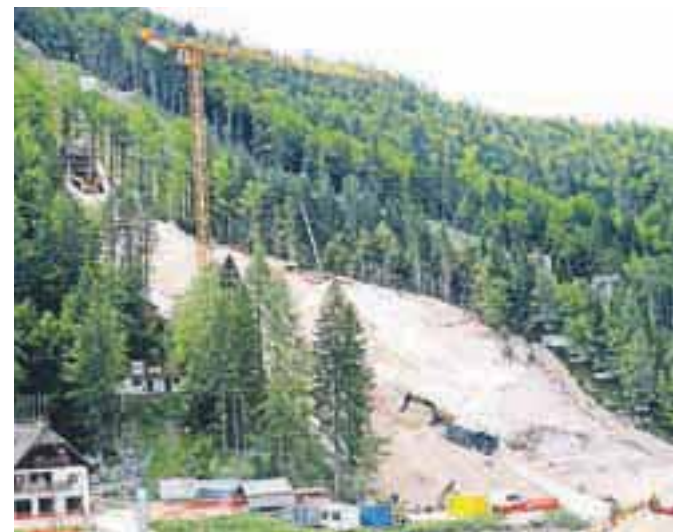
Planica je v teh dneh veliko gradbišče. Če bo šlo vse po načrtih, bodo skakalnice zgrajene že do pomladi.