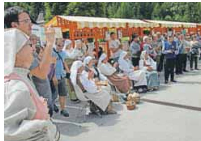
Dogajanje pred Slovenskim planinskim muzejem so popestrile številne folklorne skupine iz Slovenije, Italije in Avstrije.