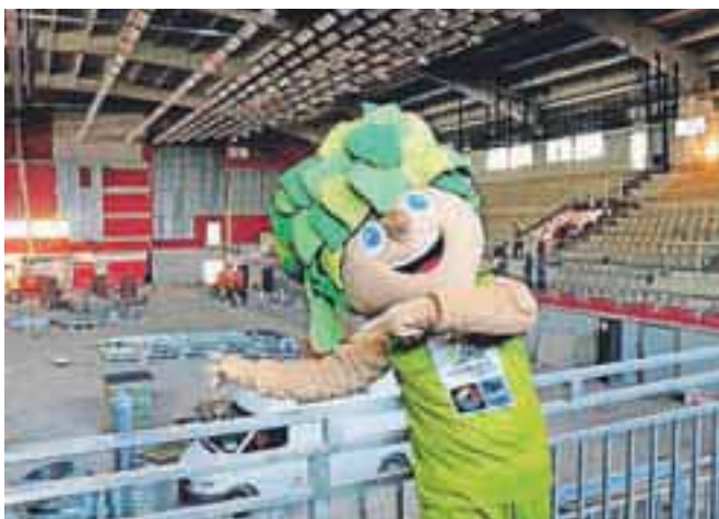
Maskota EuroBasketa 2013 Lipko

če reprezentance bodo namreč bivale v Kranjski Gori, in sicer v hotelu Kompas, ki je uradni hotel za nastanitev udeležencev EuroBasketa 2013, nam je povedal Borut Dubrovič iz družbe Hit Alpinea. Poleg reprezentanc v Kranjski Gori pričakujejo tudi množico navijačev in na osnovi dosedanjih rezervacij in povpraševanj pričakujejo, da bodo v času tekmovanja kranjskogorski hoteli povsem zasedeni. V drugem delu prvenstva, ko se bodo tekme igrali v Ljubljani, pa pričakujejo, da bodo proste nočitvene kapacitete ob drugih gostih zapolnili navijači, ki bodo ogleda tekem kom-