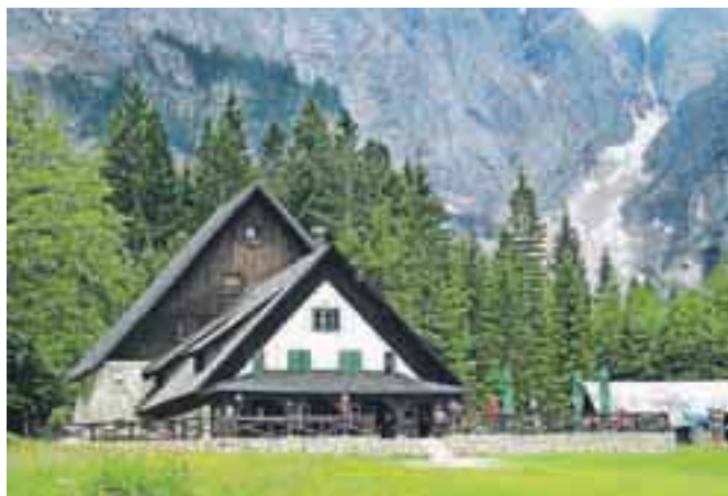
Dom v Tamarju poleti in pozimi privablja številne obiskovalce.

Čeprav so si na Planinski zvezi Slovenije dolgo prizadevali, da doma denacionalizacijskemu upravičencu ne bi bilo treba vrniti v naravi, so s podpisano poravnavo vseeno zadovoljni, saj se za planince še vsaj deset let ne bo nič spremenilo. Koča bo po zagotovi-