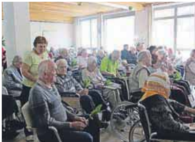
Junija je bilo v Viharniku zelo živahno.

lovna terapevtka. Posebej veselili pa so bili v Viharniku obiska stanovalcev in pevskega zbora iz Doma dr. Franceta Berglja z Jesenic. Skupno petje in ples ostajajo nepozabni. Po Viharniku je odmevalo: »Prelepa Gorenjska, ponos si mi ti, ko Dom dr. Franceta Berglja skupaj z Domom Viharnik zaživi.« Tako stanovalci kot zaposleni se že veselijo naslednjega srečanja. Kranjskogorci namreč že napovedujejo obisk na Jesenicah.