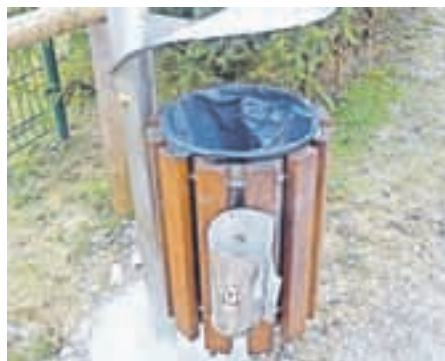
... in se znesli nad košem za pasje iztrebke.