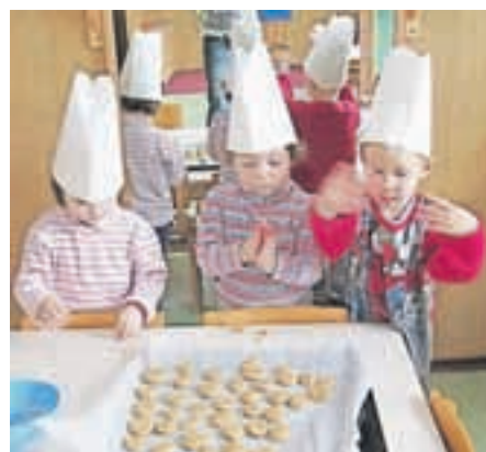
Mali kuharji pri delu