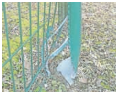
Uničili so del ograje ...

jeten kotichek za igro in sprostitev. Leta 2010 so postavili še ograjo okoli celotne površine zahodnega dela parka, kjer je tudi otroško igrišče. Lani so postavili nove zaščitne podlage. Vse s ciljem, da otroci uživajo v igri in zabavi. Nekatere to očitno moti ali pa pri svojih dejanjih ne izbirajo, kaj uničiti ali poškodovati. In to se ponavlja, saj je bila ograja igrišča poškodovana že leta 2011, prav tako table z oznako prepovedano za pse. Vandalizem so prijavili policiji, vsi pa upajo, da bo odkrila povzročitelje.