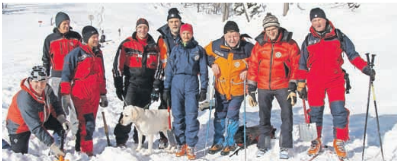
Tečaja vodnikov z reševalnimi psi so se udeležili vodniki društev Gorske reševalne zveze Slovenije, med gosti pa so bili gorski reševalci iz Hrvaške, Italije in Avstrije ter predstavniki Kinološke zveze Slovenije.