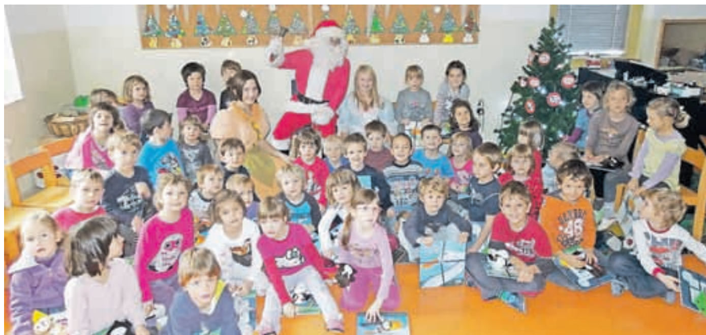
Tudi Božiček se je oglasil pri Sovicah in Bobrih.

Vsega vam niti povedati ne morejo, pravijo. Le še to, da je vsak dan veselega decembra otrokom odkrival pomembne vrednote, ki se dandanes žal izgublajo. Svetloba upanja, pomoči, dobrote in sodelovanja; objem modrosti, družine, ljubezni in skrbi za drugega; vrednost hvaležnosti, praznovanja, zdravja in iskrenosti; vse te in mnoge druge vrednote so otroci simbolično obesili na novoletno jelko in si za praznik zaželeli, da moč in luč teh vrednot v njihovih srčkah ne bi nikoli ugasnili.