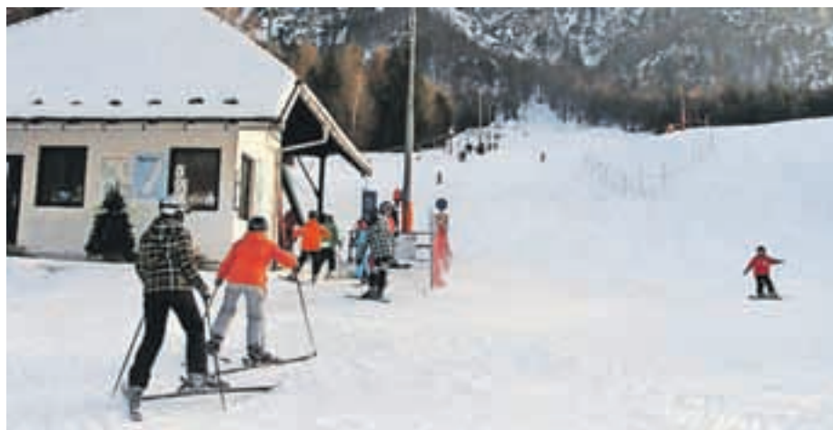
Smučišče je odprto vsak dan od 9. do 16. ure, za nočno smuko pa je na voljo od 18. do 21. ure.

Poleg smučišča je na voljo drsališče, urejene so tekaške proge, nedaleč stran na travniku pa je tudi sankališče.