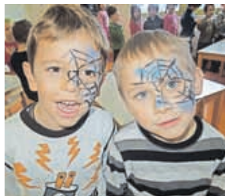
Vzgojiteljice so jim poslikale obraze.

Vsega vam niti povedati ne morejo, pravijo. Le še to, da je vsak dan veselega decembra otrokom odkrival pomembne vrednote, ki se dandanes žal izgublajo. Svetloba upanja, pomoči, dobrote in sodelovanja; objem modrosti, družine, ljubezni in skrbi za drugega; vrednost hvaležnosti, praznovanja, zdravja in iskrenosti; vse te in mnoge druge vrednote so otroci simbolično obesili na novoletno jelko in si za praznik zaželeli, da moč in luč teh vrednot v njihovih srčkah ne bi nikoli ugasnili.