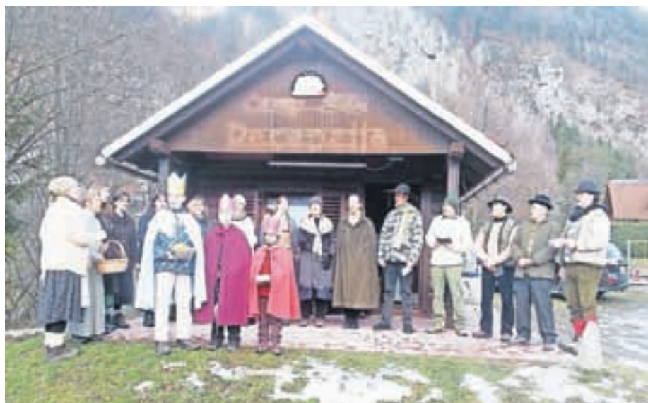
Koledniki vokalne skupine Triglavski zvonovi

Tudi tokrat so koledniki prijetno združili s koristnim. Zbrali so več kot 900 evrov, ki so jih namenili obnovi dovške cerkve. V posebnem spominu jim bo ostalo, kot pravijo, prepevanje ob bolniških posteljah tistih, ki jim ne morejo prisluhniti na odprtih prizoriščih in ki jim bolezen in starost ne dovoljujeta, da bi jih pozdravili zunaj. Vsem, ki ste jim prisluhnil, jih pogostili in ki jih podpirate pri pevski dejavnosti, se zahvaljujejo.