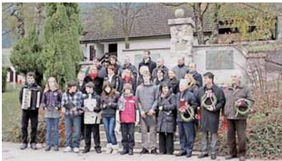
Položili so cvetje in prižgali sveče za vse padle v vojni.

Prispevek je zaradi tehničnih težav izpadel iz zadnje lanske številke Zgornjesavca, zato ga objavljamo v tej številki.