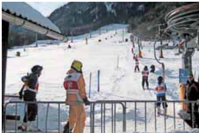
Kljub pomanjkanju snega so smučišča v Kranjski Gori pobeljena in pripravljena za smuko.