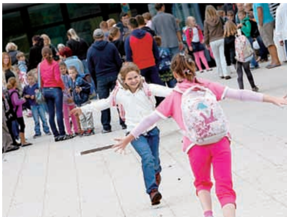
Kranjskogorski šolarji so v ponedeljek zjutraj zadovoljni začeli s poukom v popolnoma prenovljeni šoli.

V OŠ Mojstrana imajo v novem šolskem letu na šoli devet oddelkov devetletke in tri