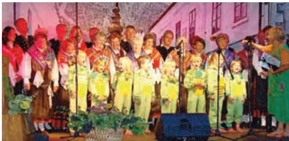
Živahno pevsko dogajanje v središču Kranjske Gore.

V kranjskogorskem zboru je trenutno 26 pevk in pevcev, v svoje vrste pa vabijo tudi nove moči. »Take, ki nameravajo delati resno in redno hoditi na vaje, ki jih imamo v pritličju zdravstvenega doma v Kranjski Gori,« pravi Burkeljčeva, ki že snuje načrte za zbor v prihodnjih mesecih. Tudi letos ne bo šlo brez tradicionalnih božičnih koncertov po cerkvah v Kranjski Gori, Ratečah in Podkorenu, z veseljem pa bodo zapeli tudi varovancem Doma dr. Franceta Berglja na Jesenicah.