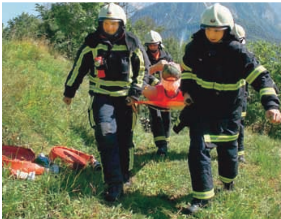
Gasilci so morali do mesta vaje od vodnega zajetja potegniti okoli kilometer gasilskih cevi.