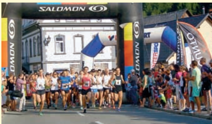
Kranjskogorska desetka - start v Kranjski Gori