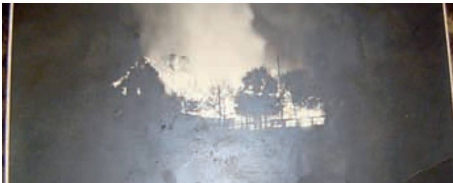
Domačija je po vojni pogorela.

Sedanjima gospodarjema zagnanosti prav tako ne primanjkuje, a včasih se tudi ta ne spleča, povesta, saj državni birokratski mlini meljejo prepočasi. Včasih so imeli živino, zdaj je zaradi previsokih zakonskih zahtev nimajo več, čeprav želja ostaja, hlev pa prav tako čaka na krave in konje. Zapletov ni zmanjkalo niti s pridobivanjem dovoljenj za odprtje turistične kmetije. Čakala sta vse, od gradbenega do uporabnega dovoljenja. De-