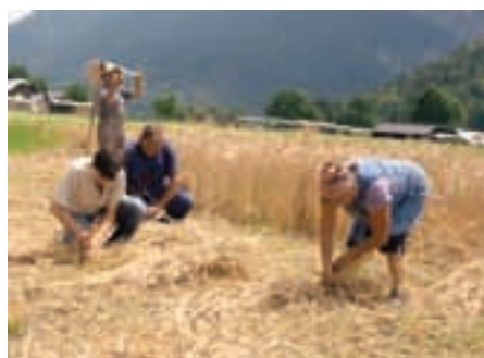
Žito je pokosil kosec, žanjice so ga s srpi zbirale in vezale v snope.

Kot je še dodal Petrič, prostovoljcev za sečnjo po starem ni bilo težko zbrati: »Redko kdo pa še zna uporabljati koso in srp, saj jim to tudi ni treba, ko pa za vse obstajajo stroji.« Kot je še ugotovil Petrič, če bi prišel kombajn tudi sami verjetno ne bi želi na roke. Prihodnje leto bodo zasejali še več žita, vendar ugotavljajo, da se bodo žetve raje lotili z mehanizacijo, saj ročna žetev zahteva preveč dela, kljub temu da je bolj atraktivna. Tako se je na glavni cesti