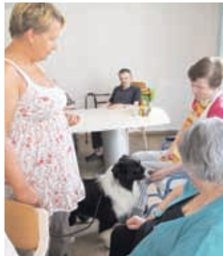
Pasji prijatelji med stanovalci doma

dni dan, ko se stanovalci srečajo in poklepetajo ob osvežujočem sladoledu.