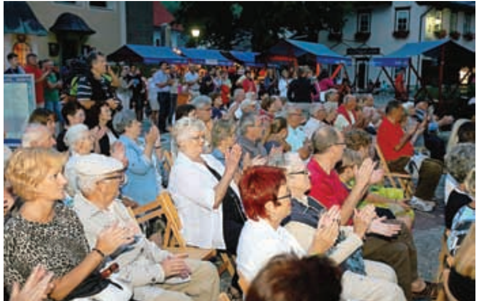
Številno občinstvo je napolnilo trg pred cerkvijo.

Kot je zapisano v obrazložitvi imenovanja Mojstrančana Janeza Brojana za častnega občana Kranjske Gore, se je leta 1947 rojeni