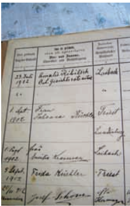
Zapis iz knjige gostov