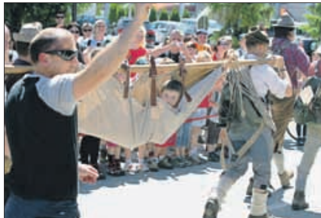
Najbolj slavnostni del dneva je bila povorka, v kateri so reševalci pokazali tudi, kako se je iz gora reševalo nekoč.