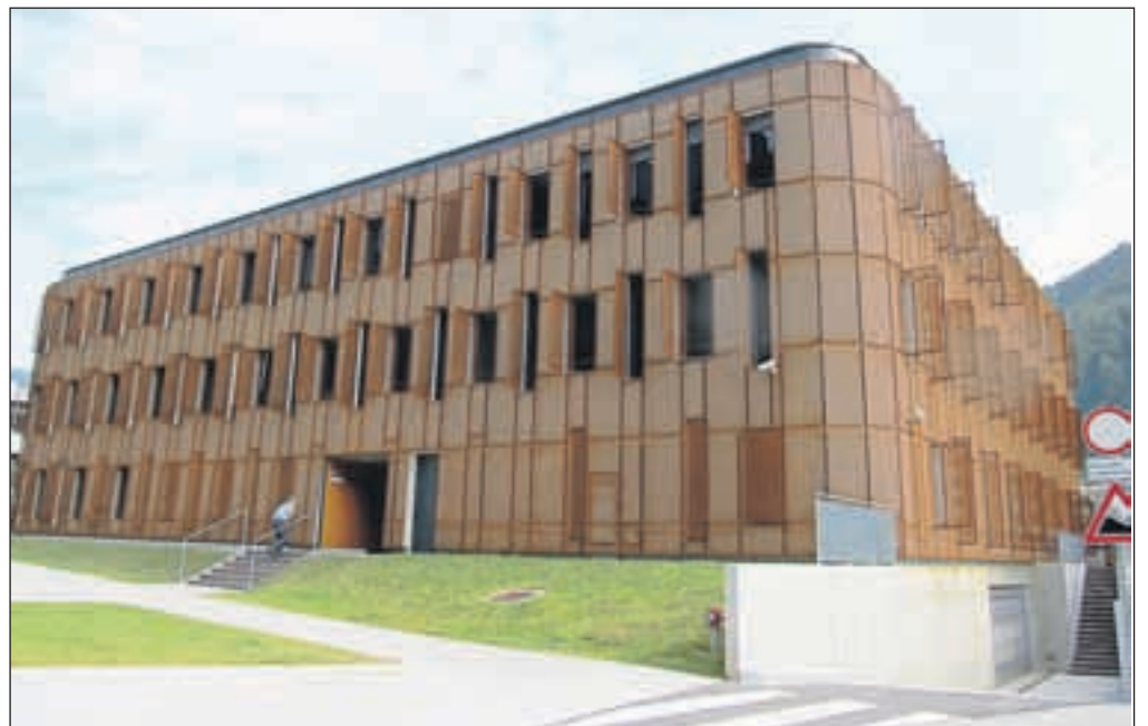
Novi Upravni center Jesenice – fasada, izdelana iz kortenskih plošč, ki simbolizirajo železarsko tradicijo Jesenic, pa med ljudmi zbuja mešane občutke.

Upravna enota Jesenice, izpostava davčne uprave, inšpekcijske službe in izpitni center so 18. junija začeli sprejemati stranke v novih prostorih v Upravnem centru Jesenice. Novi objekt, v neposredni bližini stavbe jeseniške občine, je zgradila država, naložba pa je stala 2,9 milijona evrov. Objekt ima skoraj tri tisoč kvadratnih metrov površin - klet, pritličje in dve nadstropji. V pritličju imajo prostore izpostava davčne uprave, zdravstveni inšpektorat, inšpektorat za energetiko, promet in prostor, inšpektorat za delo in izpitni center, v prvem in drugem nadstropju pa imata prostore Upravna enota Jesenice. »Že prvi dan nas je obiskalo veliko število strank. Kakšnih posebnih težav nismo imeli, bo pa nekaj časa vseeno potrebnega, da se vsi skupaj seznanimo s hišo.