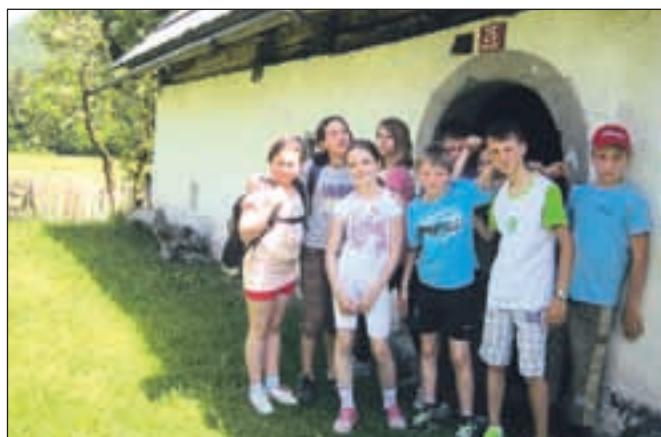
Pocarjeva domačija je danes muzej na prostem, ki ga obiskujejo številni obiskovalci, med katerimi so pogosto tudi šolarji: na fotografiji so petošolci iz Gorij, ki so se v nekaj več kot 15 kilometrov oddaljeno Radovno pripeljali kar s kolesi.