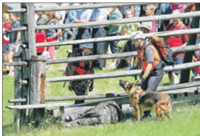
Po vaji reševanja s sedežnice v Kranjski Gori so vodniki z reševalnimi psi iskali pogrešane osebe.