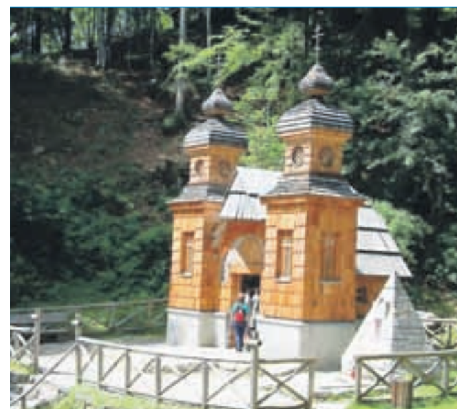
Obnovljena ruska kapelica

ko posluha, sedem slovenskih velikih podjetij se je dogovorilo, da bo financiralo prireditev pri kapelici in nekdanje poslovne partnerje smo povabili v Slovenijo. 73-članska delegacija politikov, kulturnikov in gospodarstvenikov je v Kranjsko Goro prispela pod vodstvom Sergeja Jurjeviča Glazijeva, takratnega ministra za zunanje ekonomske