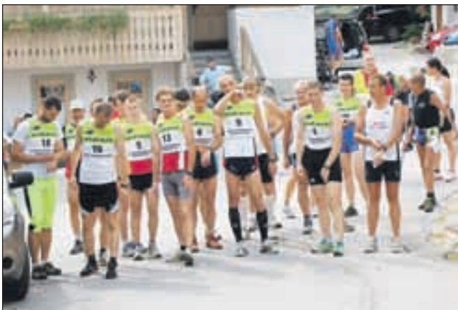
Juriša na Dovško Babo se je udeležilo 31 tekačev in kolesarjev.