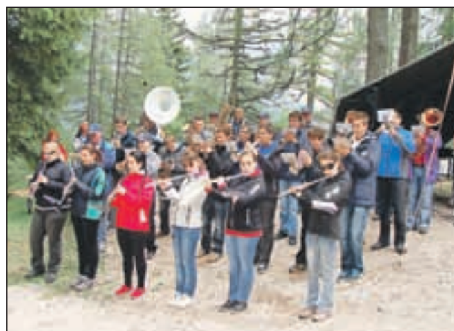
Pihalni orkester Jesenice-Kranjska Gora

membnih prireditvah v Kranjski Gori. Najprej ob stoletnem jubileju organiziranja gorske reševalne službe, zatem pa še na odprtju