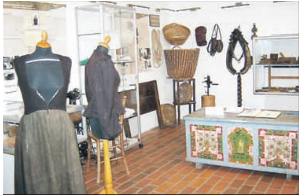
Rokodelci in domača obrt v Liznjekovi domačiji