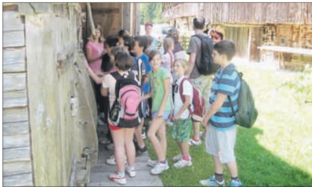
V Triglavskem narodnem parku, ki upravlja z domačijo, predvsem za šolarje pripravljajo številne delavnice, v katerih se mladi seznanjajo z naravo, parkom in življenjem nekoč.

»Bogastvo Pocarjeve domačije so bili gozdovi, pašniki, rovti, travniki in njive, posredno pa se njena gospodarska moč vidi v velikosti stanovanjske hiše in gospodarskega poslopja,« kmetijo, ki ima