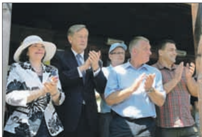
Osrednjo prireditve so spremljali številni reševalci, planinci in drugi obiskovalci pa tudi predsednik države s soprogo.