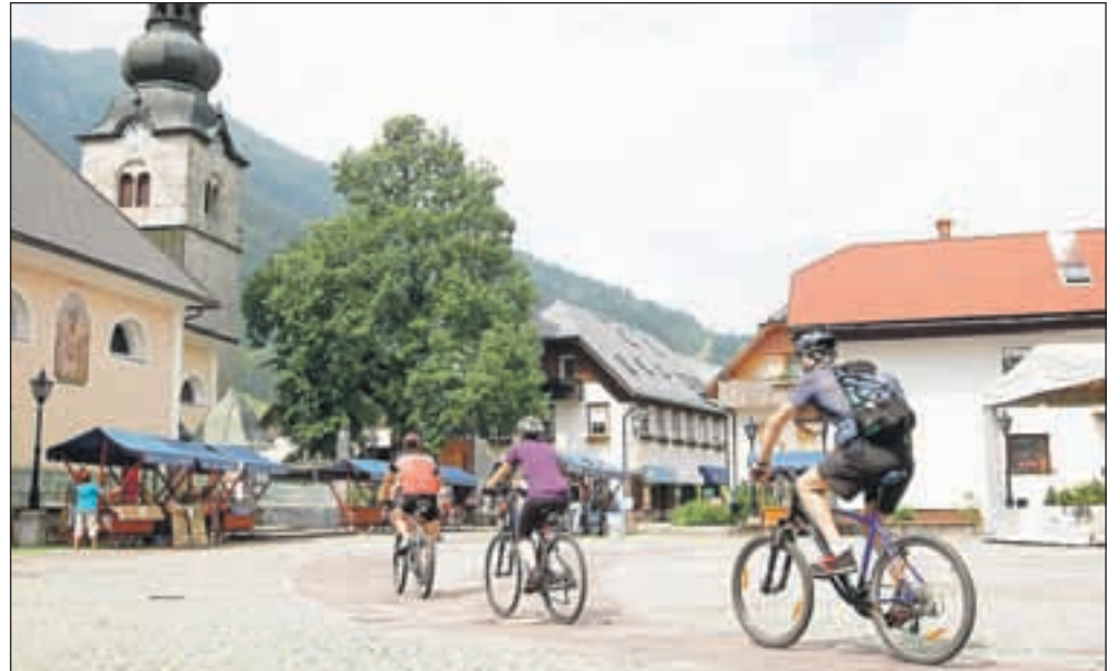
Vse poletje bo Kranjska Gora živela v športno-počitniškem utripu.

V sodelovanju s turističnim društvom Kranjska Gora in drugim društvu ter turističnim gospodarstvom LTO vse poletje pripravlja različne prireditve. »Naj izpostavim evropsko prvenstvo v košarki za stare do 20 let, nadaljujemo z dogodki ob srečanju pri Ruski kapelici. Za to prireditve smo pripravili tudi