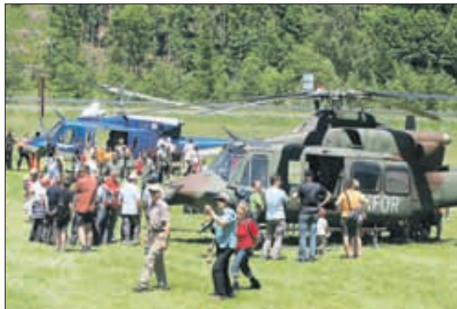
Domači gorski reševalci so predstavili klasični način reševanja iz ostenja Grančiča nad Mojstrano.

po najboljših močeh, s pametnim premislekom, tudi zaradi lastne varnosti. V naših vrstah so se v teh letih zamenjale številne generacije. Kar zadeva danes mlade, bi bili veseli novih moči.« In čeprav so si reševalci v letošnjih mesecih vzeli čas za bolj prijetne stvari v okviru praznovanja stoletnega jubileja, so spet hiteli iz akcije v akcijo. Do sredine junija so beležili že več kot 140 posredovanj v gorah in ob drugih izrednih dogodkih, kjer so nepogrešljivi pri nujenju pomoči.