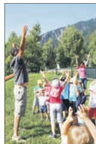
Dihalnica za otroke iz vrtca Kekec v Kranjski Gori