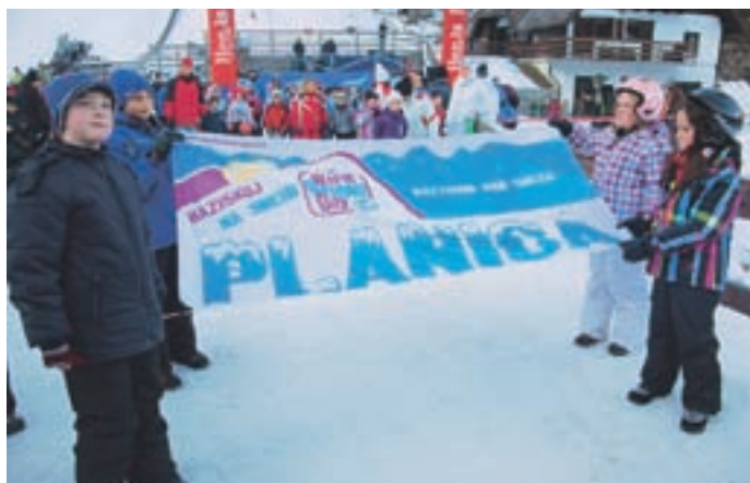
Na Svetovni dan snega se je v Planici zbralo veliko otrok.