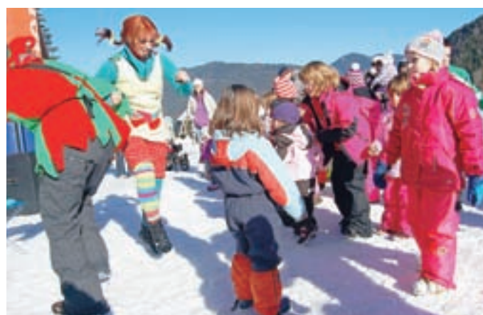
Za zabavo sta skrbela tudi Pika Nogavička in škrat.