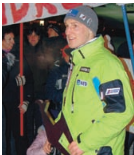
Sprejem v Kranjski Gori po 2. mestu pred leti v Kitzbuehlu