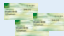
ali darilni bon za trgovine TUŠ v vrednosti 20 EUR