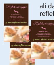
ali darilni bon za refleksno masažo stopal