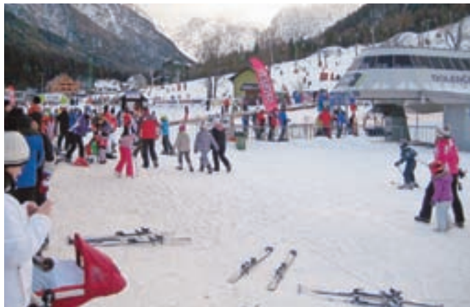
Kljub temu da naravnega snega ni veliko, so žičničarji odlično pripravili proge, zato so lahko zadovoljni z obiskom. Smučišča in nastanitvene kapacitete so bile polne tako med prazniki kot še ves teden po tem.