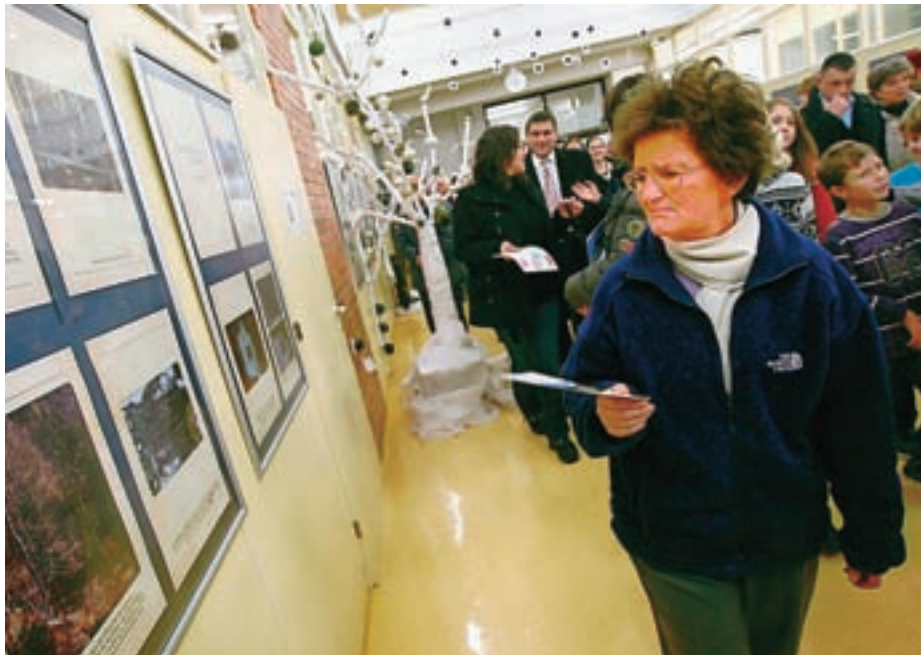
Razstava z naslovom Ne pozabimo preteklosti je bila na ogled v avli mojstranske osnovne šole.