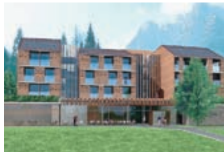
Maketa bodočega hotela Erika

Z novo naložbo so zadovoljni tako v lokalni turistični organizaciji kot na občini Kranjska Gora. Direktorica lokalne turistične organi-