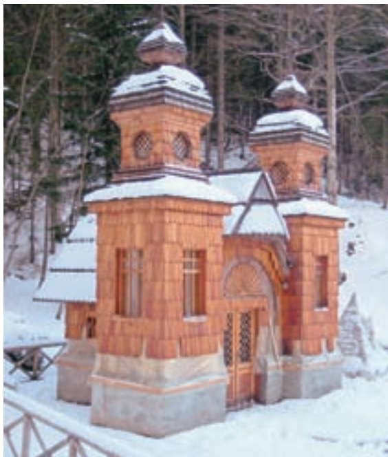
Rusko kapelico so začasno zaščitili s polivinilom.

Nova skakalnica naj bi bila nared do februarja, je deset let po sramotnem sesutju Bloudkove velikanke prepričan minister Lukšič. Stran 13