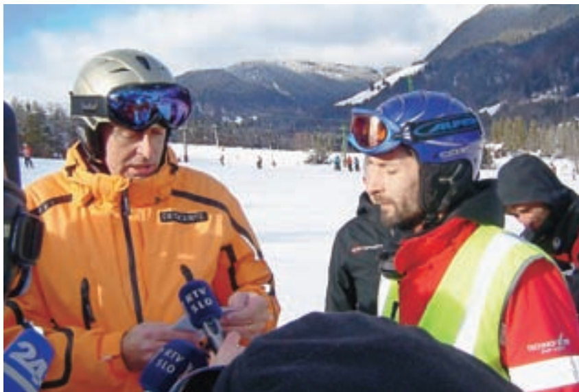
Minister Aleš Zalar je zato nadzorniku Mihi Kokalju predal posebno brošuro o nalogah nadzornikov in njihovem sodelovanju s policijo.

”Na naših smučiščih se še vedno zgodi preveč nesreč,” je bil jasen minister za pravosodje in notranje zadeve Aleš Zalar . V lanski smučarski sezoni se je zgodilo 1247 nesreč, 1176 smučarjev se je lažje poškodovalo, 69 pa huje. Zato je minister Zalar nadzorniku Mihi Kokalju predal posebno brošuro o nalogah nadzornikov in njihovem sodelovanju s policijo, seveda z željo, da bi delo opravljali dobro in z belih strmin umaknili nevarne smučarje ter deskarje.