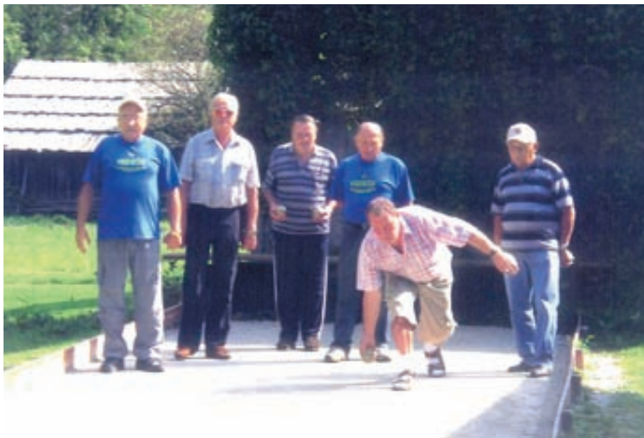
Domači tekmovalci so tokrat na domačem terenu pokazali močno prevlado v tem športu.