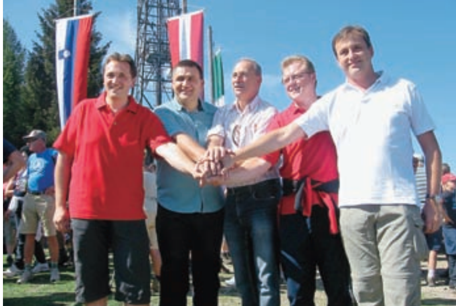
Točno opoldne so se na vrhu 1.509 metrov visoke Peči zbrali tudi župani treh obmejnih občin: Kranjske Gore, Podkloštra in Trbiža.