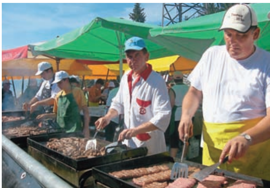
Italijani so na svojih stojnicah ponujali testenine, Avstrijci golaž, rateškim turističnim delavcem pa, čeprav gostom ponujajo tudi kranjske klobase, največ zaslužka vsako leto še vedno prinesejo čevpčiči.