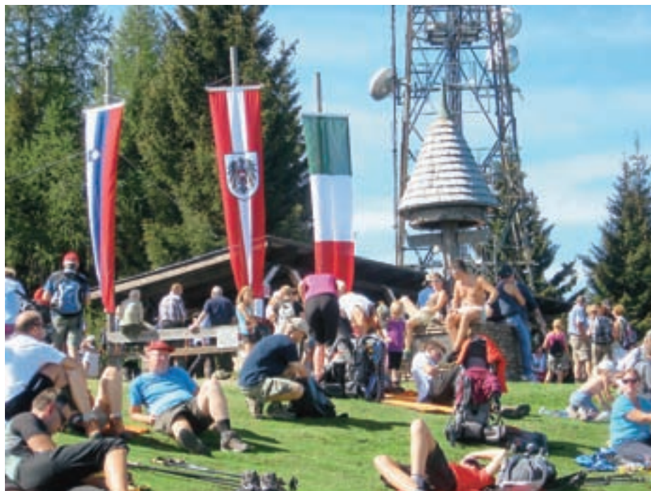
Srečanja na tromeji se je udeležilo približno 8 tisoč pohodnikov z vseh treh strani meje.