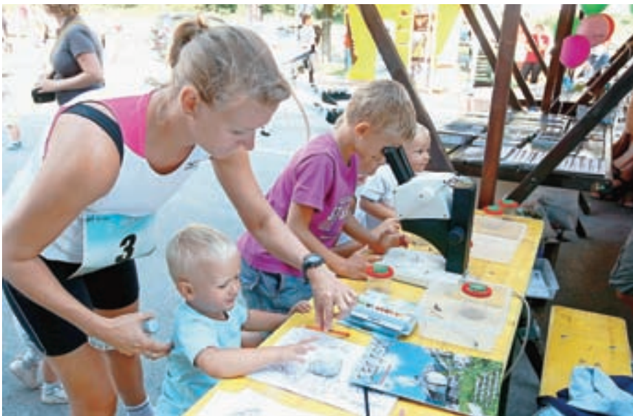
Otroci so z zanimanjem sodelovali na delavnicah, ki jih je pripravil Triglavski narodni park.