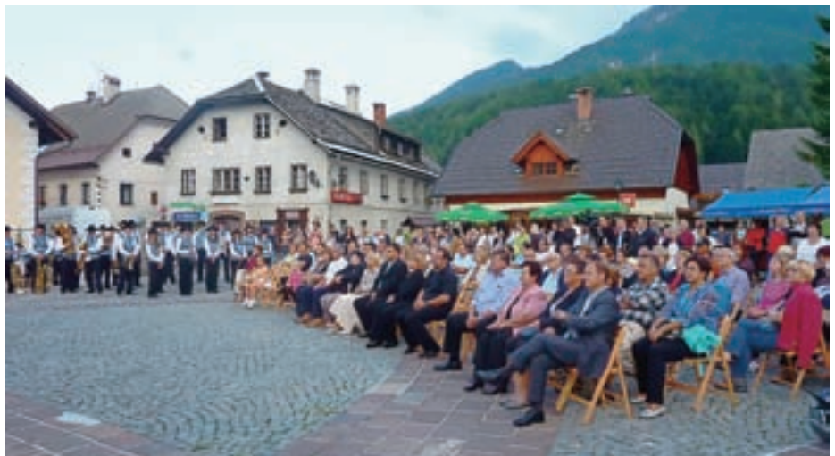
Na Trgu na Gorici se je na predvečer občinskega praznika zbrala množica ljudi, tudi številni turisti.

Sedmega avgusta leta 1895 je Jakob Aljaž postavil stolp na vrhu Triglava in z njim simbolično zaznamoval slovenske gore. V občini Kranjska Gora v spomin na ta zgodovinski mejnik praznujejo občinski praznik.