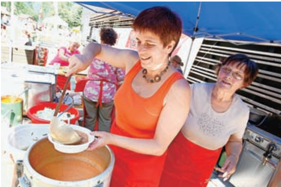
Pr' Katr' so za obiskovalce pripravili velikanov golaž.