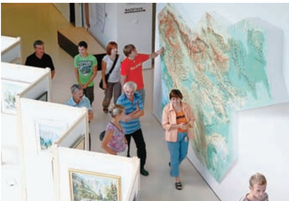
V soboto je bil vstop v Slovenski planinski muzej prost.