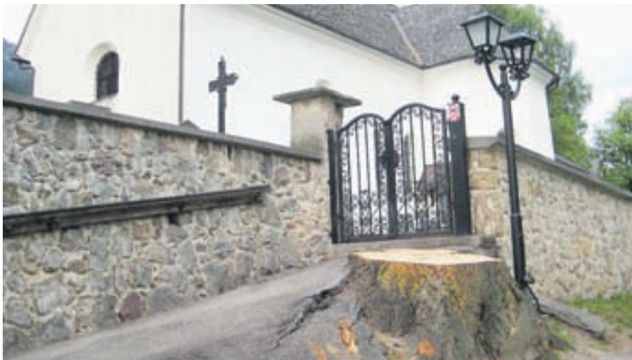
Stara lipo je že tako zelo poškodovala pot do pokopališča in se vraščala tako v pokopališki zid kot v pokopališče, da jo je bilo treba posekati.

Prve pobude za posek omenjene lipe so bile dane že sredi leta 2007, saj je stala blizu cestišču in je ovirala promet. Strokovnjaki so nato konec leta 2008 svet krajevne skupnosti obvestili, da bi bilo potrebno zaradi varnosti lipo ob pokopališču podreti, lipo pri stari osnovni šoli pa strokovno očistiti. Ko je javno podjetje Komunala Kranjska Gora pridobilo še dodatno strokovno mnenje strokovnjaka iz Arboretuma Volčji Potok, dendrologa Matjaža Mastnaka, ki si je stanje ogledal na terenu in prav tako predlagal, da lipo zaradi varnosti podrejo, so to pretekli ponedeljek tudi storili. Ugotovil je namreč, da ima drevo s štirimi debli koreninski del tik pod povezovalno asfaltirano potjo med starim in novim delom pokopališča ter s svojo rastjo rine v oporni zdi in cesto. Zato je priporočil, da v izogibitev novim poškodbam na pokopališkem zidu in vozišču drevo posekajo.