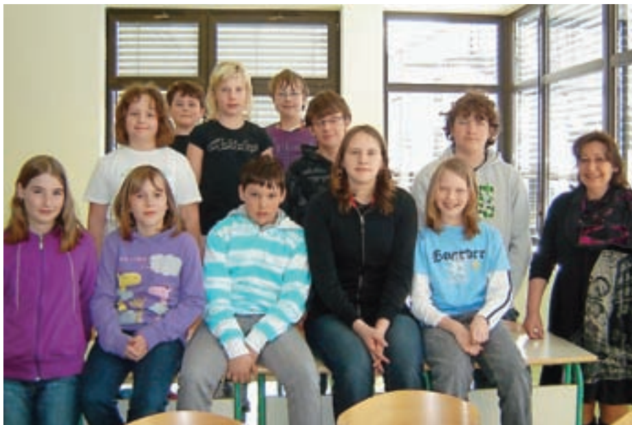
Udeleženci projekta Kako se pa pri vas reče