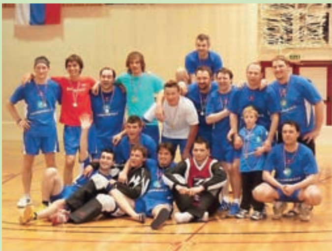
Kljub porazu v velikem finalu so se člani ekipe Zelencev Kranjska Gora veselili medalj za drugo mesto.