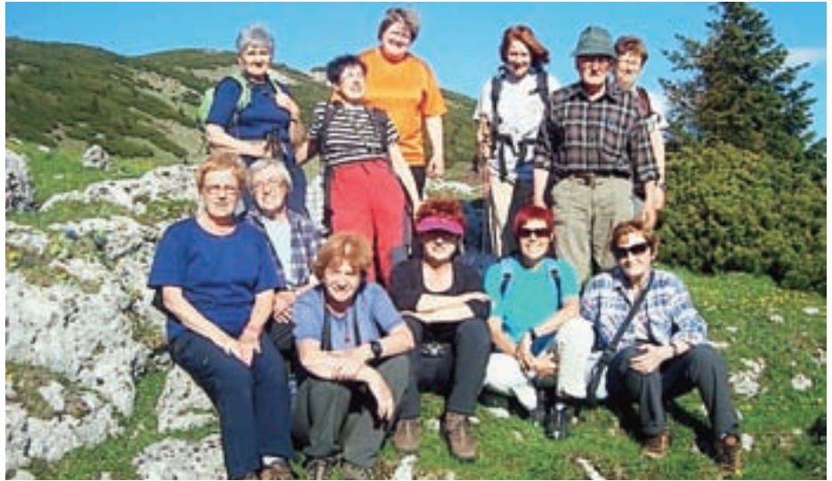
Lani je pri društvu zaživel tudi odsek za varstvo gorske narave - na sliki so člani na planini pod Struško.