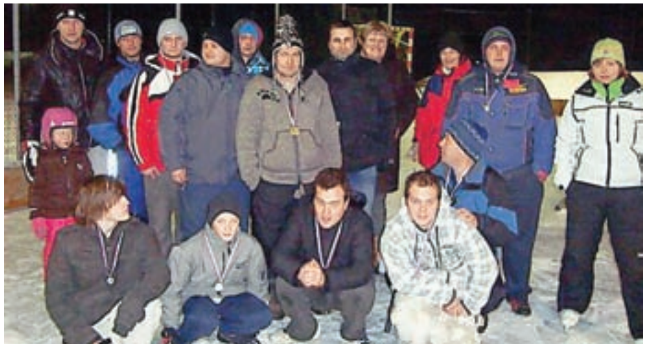
Januarja so pripravili hokejsko tekmo