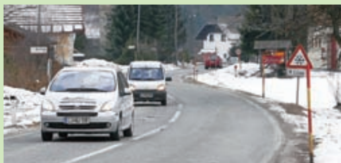
V Gozd-Martuljku že težko čakajo na hodnik za pešce ob državni cesti skozi naselje.

Na področju vzdrževanja cestne infrastrukture ima na svojih, občinskih cestah, veliko dela tudi občina. "Leta 2007 smo sprejeli štiriletni plan obnove in vzdrževanja lokalnih cest, po katerem smo za obnovo namenili 2,8 milijona evrov in večino načrtovanih sredstev tudi porabili. Seveda so se v teh letih pokazale prioritete tudi na drugih območjih, nekaj investicij je bilo nujnih, nekaj sofinanciranih, nekaj pa so jih izpeljale tudi krajevne skupnosti," pojasnjuje župan. "Prav zdaj pa pripravljamo načrt obnove občinskih cest za obdobje 2011 do 2014; že sedaj lahko povem, da bomo najmanj na tem področju naredili prav letos, ko občina čaka zares velika investicija v drugi del obnove osnovne šole Josipa Vandota v Kranjski Gori," je še povedal Jure Žerjav. M. A.