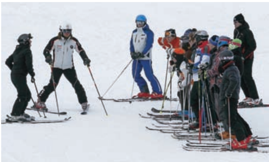
Na kranjskogorskih smučiščih je trenutno okoli pol metra naravnega in kompaktnega snega.