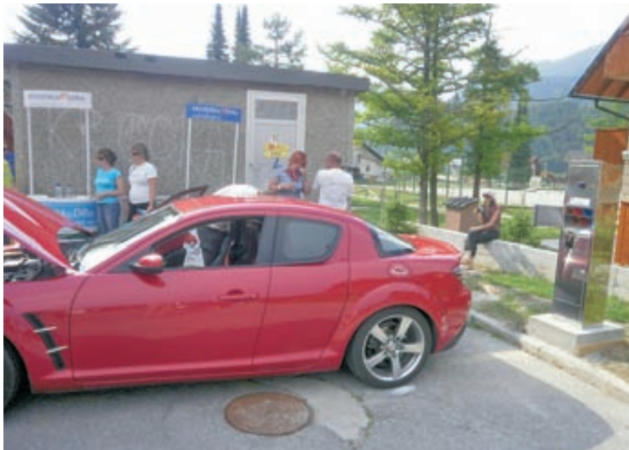
Lastniki avtomobilov na električni pogon se lahko z energijo preskrbijo tudi v Kranjski Gori.

Gorenjska je z vzpostavitvijo petih novih polnilnic za električna vozila postala vodilna v državi, skupaj s polnilnico na Laborah pri Kranju, ki so jo predali namenu lansko jesen, je mogoče baterije električnih vozil napolniti še na Jezerškem, v Preddvoru, na Bledu, v Bohinju in Kranjski Gori, kjer so jo postavili za občinsko stavbo pri dvorani Vitranc. Hkratna vzpostavitev petih polnilnih mest, ki predstavljajo prvo traso za vozila na električni pogon v Sloveniji, je skupen projekt Elektra Gorenjska, Centra za trajnostni razvoj podeželja Kranj in podjetja Just EE. Vrednost celotnega projekta je približno petdeset tisoč evrov, polovica sredstev je iz programa za razvoj podeželja, preostalo pa bodo prispevali partnerji in občine. Na vsaki polnilnici se lahko hkrati polnijo baterije treh vozil, enega s trifazno in dveh z enofazno napeljavo. Čas polnjenja je odvisen od zmogljivosti baterij, običajno pa traja eno do dve uri, medtem ko je za celovito polnjenje potrebnih približno osem ur, kar pomeni, da je še vedno najprimernejše in najceneje prek noči. Za zdaj na javnih polnilnicah lastnikom vozil za električno energijo še ne bo treba plačevati. Matjaž Gregorič