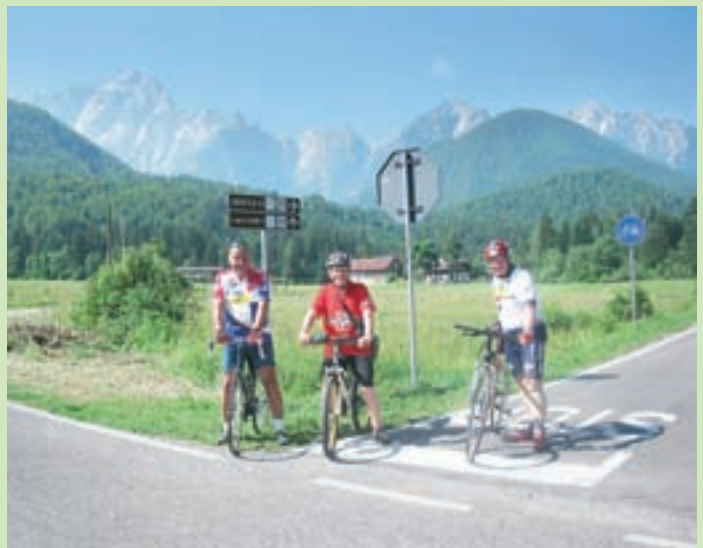
Kolesarji so z novo povezavo od rateške železniške postaje do nekdanjega mejnega prehoda zelo zadovoljni.

V začetku poletja so v Ratečah z asfaltom preplastili še zadnja dva kilometra kolesarske steze, ki se začne v Mojstrani in teče po vsej Zgor-njesavski dolini ter se kasneje naveže na italijanski Trbiž in Belopeška jezera. Občina Kranjska Gora je za investicijo namenila približno sto tisoč evrov. Odsek od odcepa regionalne ceste za Planico do nekdanjega mejnega prehoda je tako zaokrožil približno dvajsetkilometrsko kolesarsko pot, ki je prekinjena le na nevarnem odseku na mostu čez Savo Dolinko v Gozdu Martuljku. Novi most za kolesarje naj bi bil po načrtih zgrajen že letos, a se bo projekt, ki ga financira država, kot kaže, precej zavlekel. M. A.