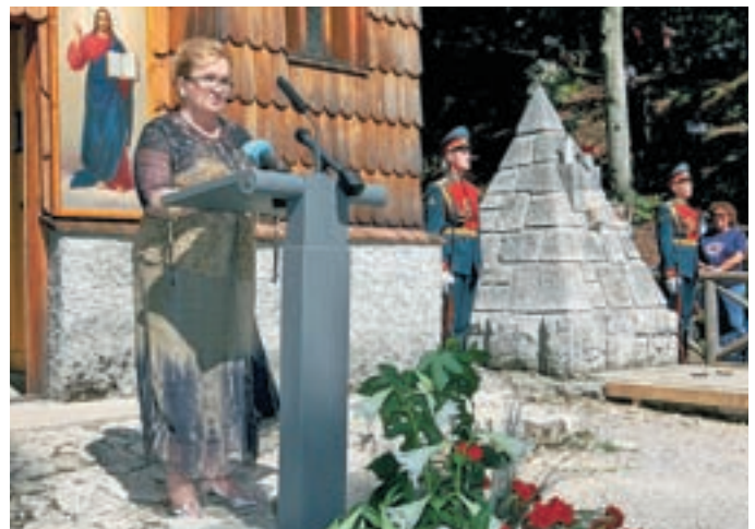
Podpredsednica ruske dume Ljubov Sliska se je v imenu ruskega naroda zahvalila tudi Občini Kranjska Gora, da skrbi za ohranjanje spomina na umrle ruske vojake.