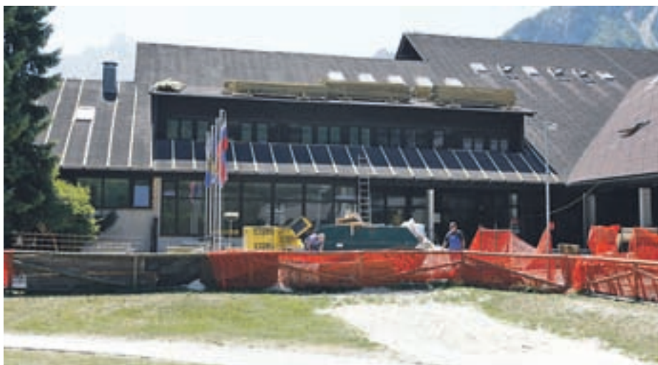
Obnova osnovne šole Kranjska Gora, za katero občina namenja približno milijon in pol evrov sredstev, je ob Slovenskem planinskem muzeju v Mojstrani največja letošnja investicija.

Občina za investicije v KS Rute namenja 373 tisoč evrov. Največ, skoraj dvesto tisoč evrov, je namenjenih za sofinanciranje izgradnje kolesarske poti, 60 tisoč pa za sanacijo brežine Save. Za pobočno zavarovanje ceste v Srednji