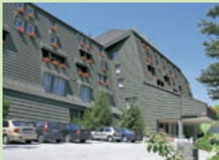
Strošek sanacije hotela Alpina je znašal sto tisoč evrov.