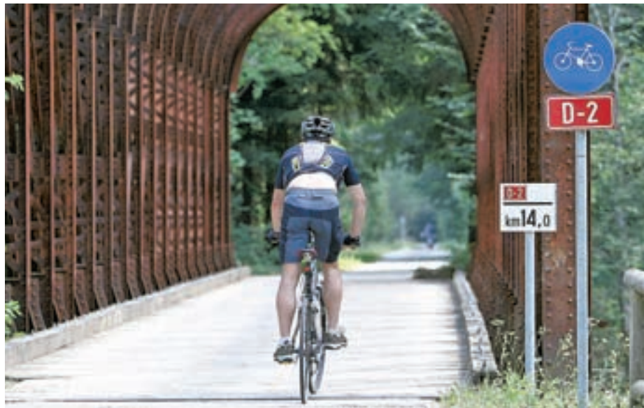
Previdno tudi na kolesarski stezi, posebej ob koncih tedna, ko je gneča zares velika. Pozor: pešci in ljudje na rolarkah ne sodijo na kolesarsko stezo!