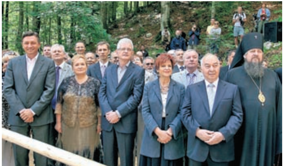
Visoki gostje na slovesnosti pod Vršičem, med njimi tudi predsednik vlade Borut Pahor in predsednik državnega zbora Pavel Gantar